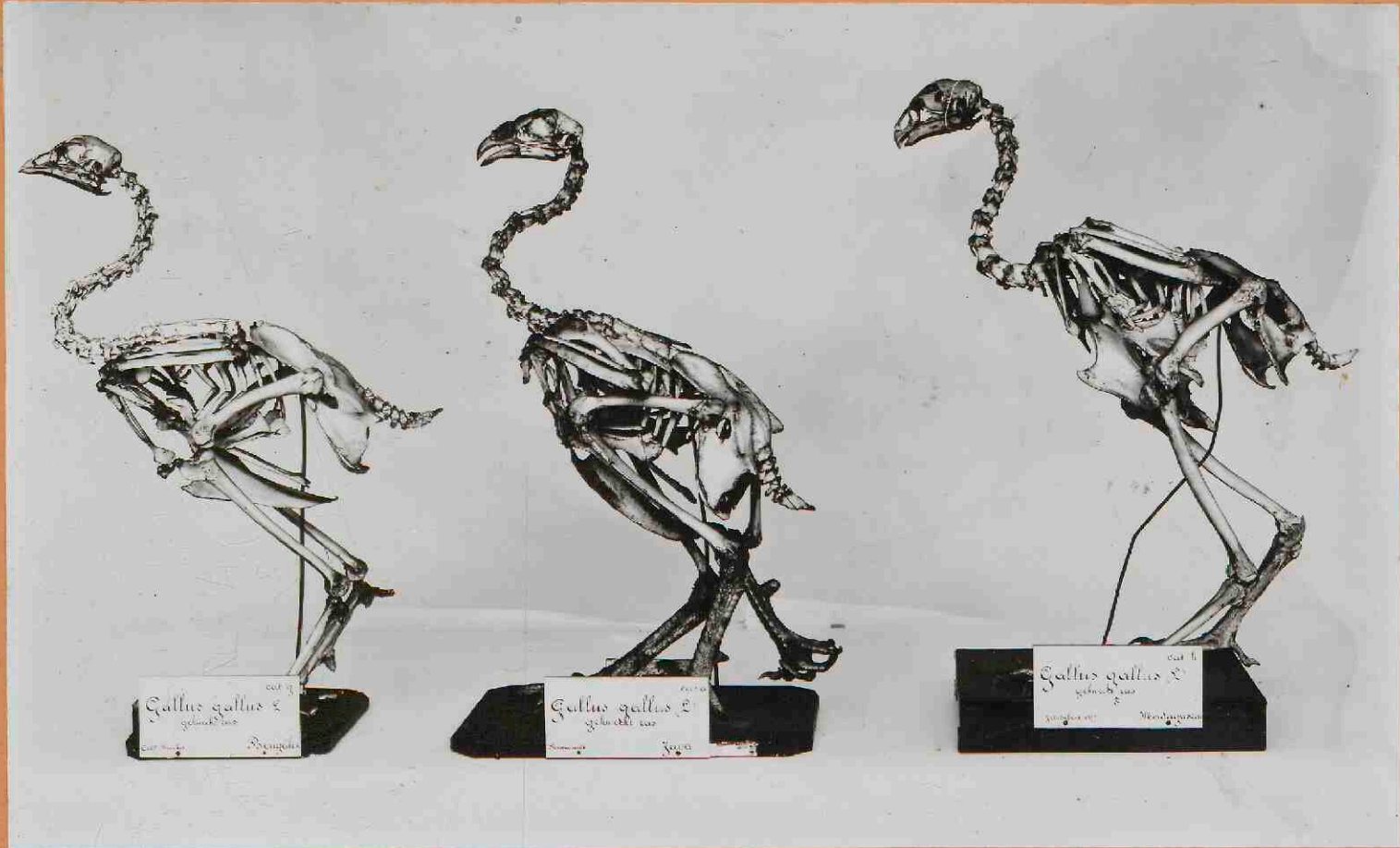
GROEP. 2. KRUISINGSRASSEN. (MALYERTIJPEN. ) a. Gallus gallus (L) Giganteus Coll. Brookes. Pengalen. b. „ „ „ „ Monstrus Reinwardt. Java. c. „ „ „ „ Gekw-Ras. J. Audebert. Madagaskar.