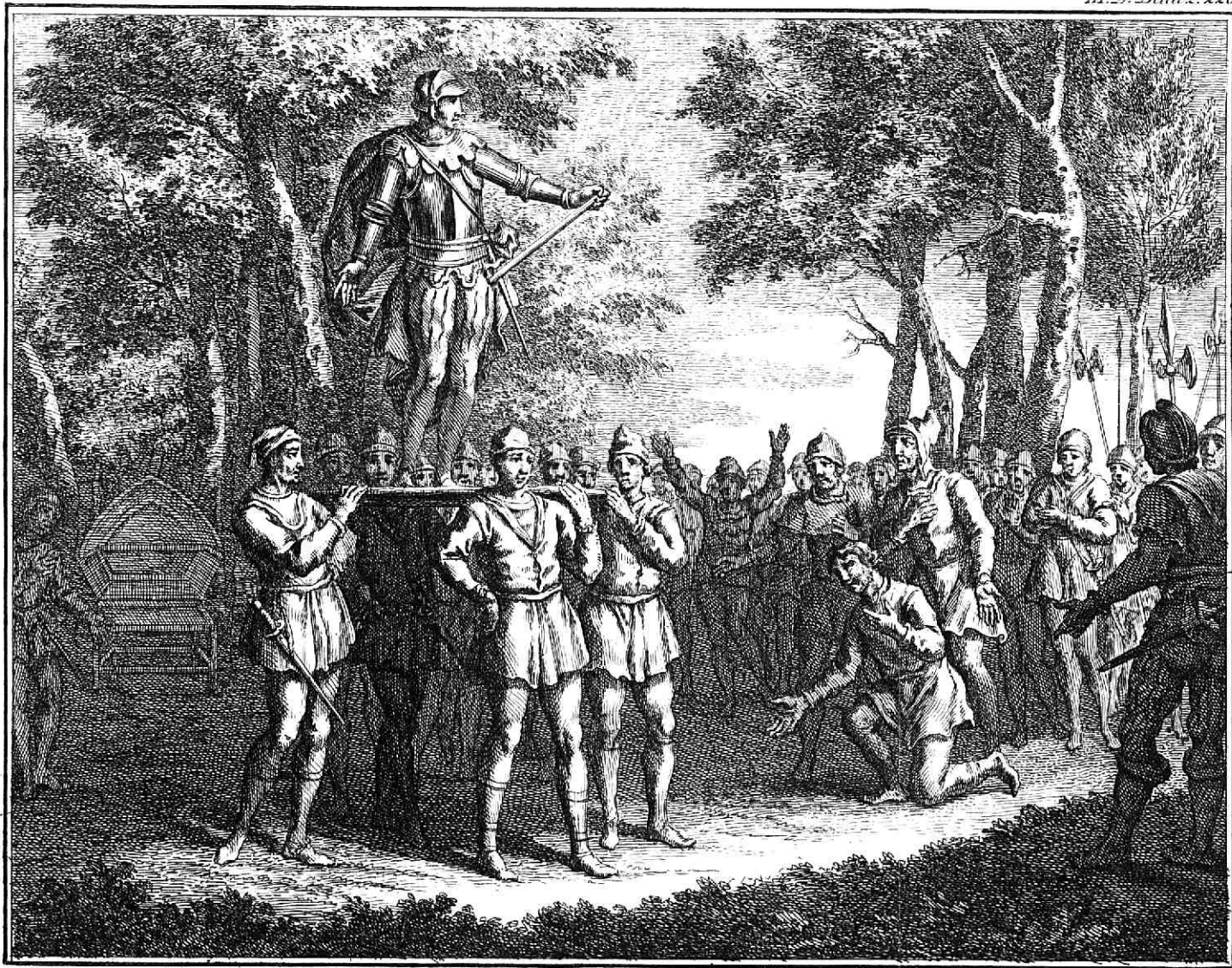
Inhuldiging van den Graave van Holland, tot Heere van Friesland.