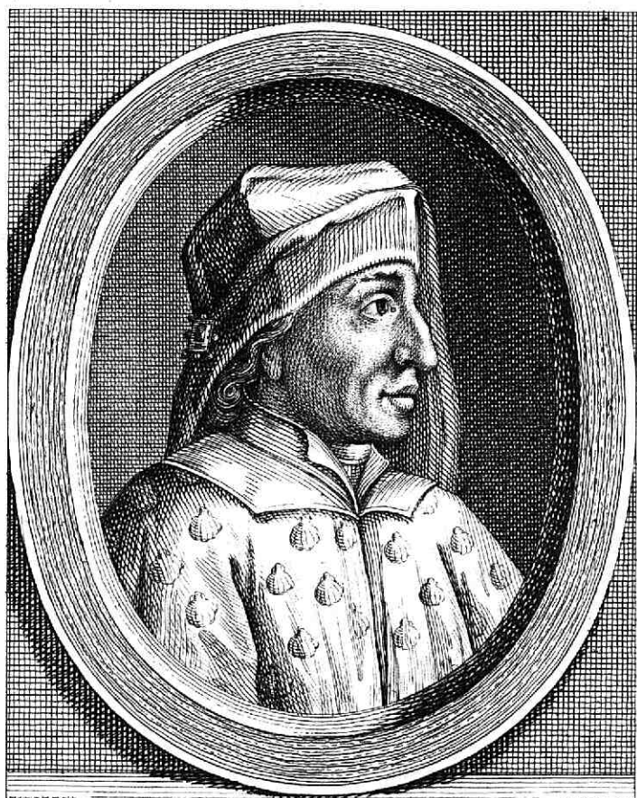
PHILIPS VAN VALOIS, bygenoemt de STOUTEN, Hertog van Bourgogne, Grave van Vlaanderen, Artois, enz. GESTORVEN IN DEN OUDERDOM VAN 70 JAREN MCCCC III.