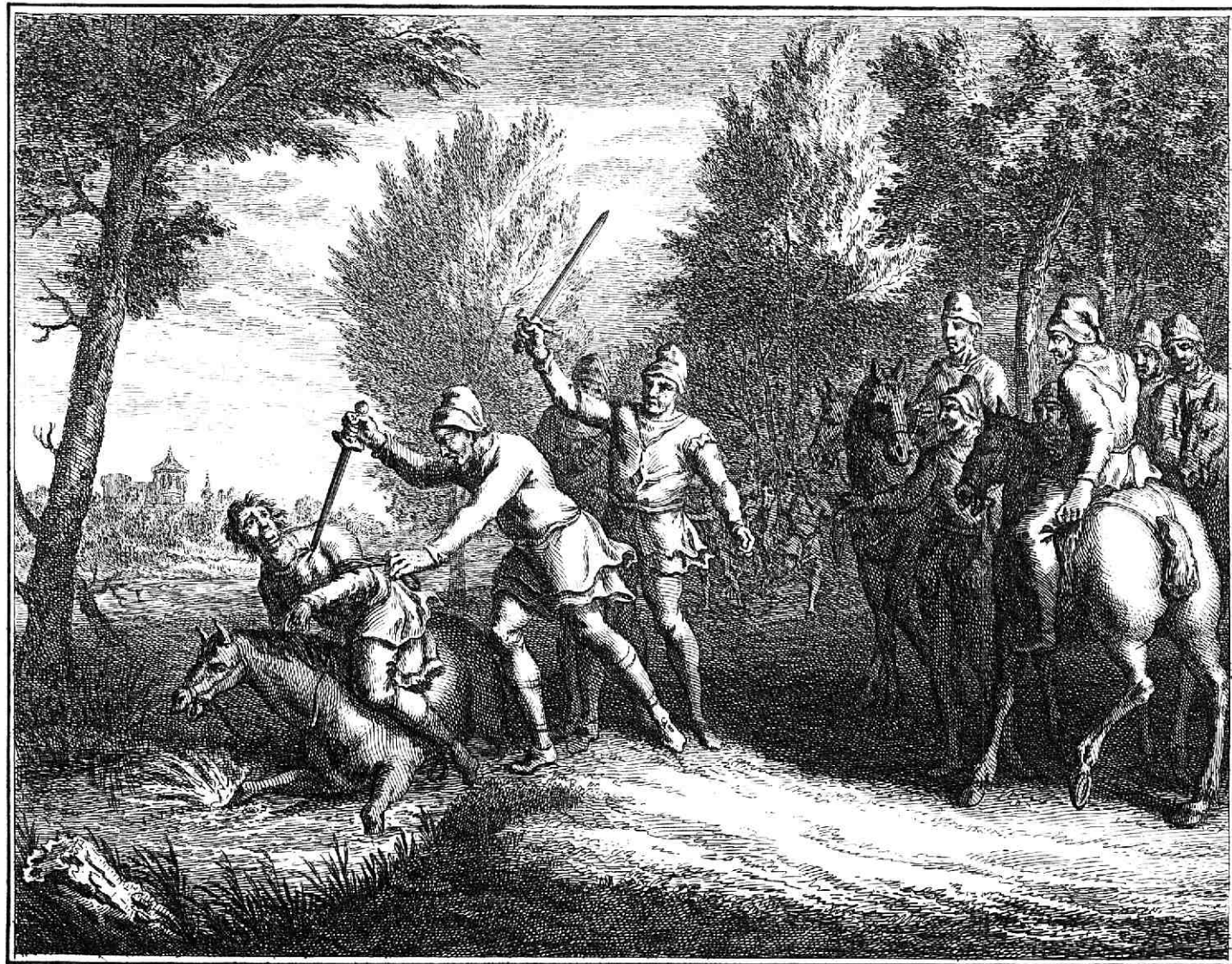
Moord van GRAAVE FLORIS DEN VYFDEN.