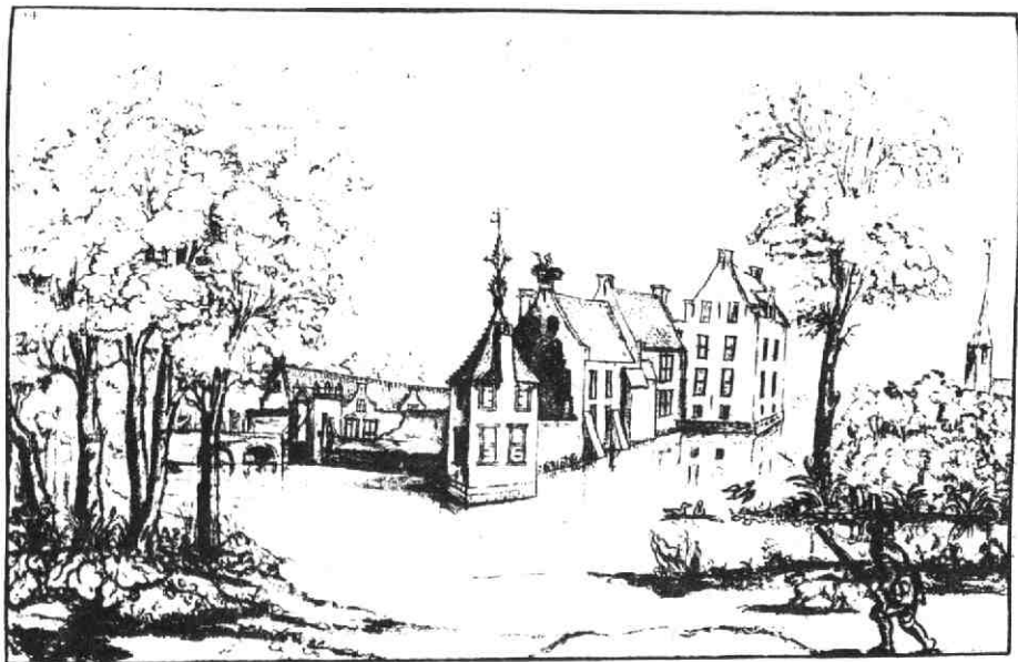
"Het huis te Schalckwijck". Tekening zonder naam. (C. 1650) Topografische atlas Rijksarchief Utrecht, nr. L 1119