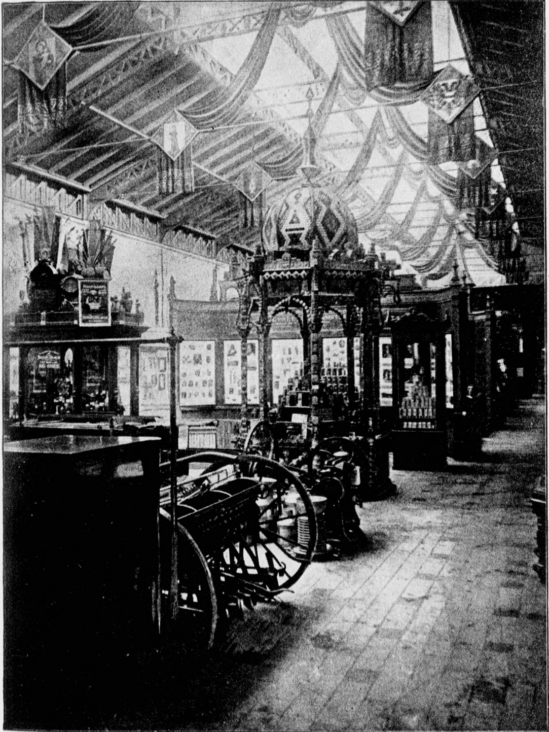
GEZICHT DOOR DE AFDEELING.