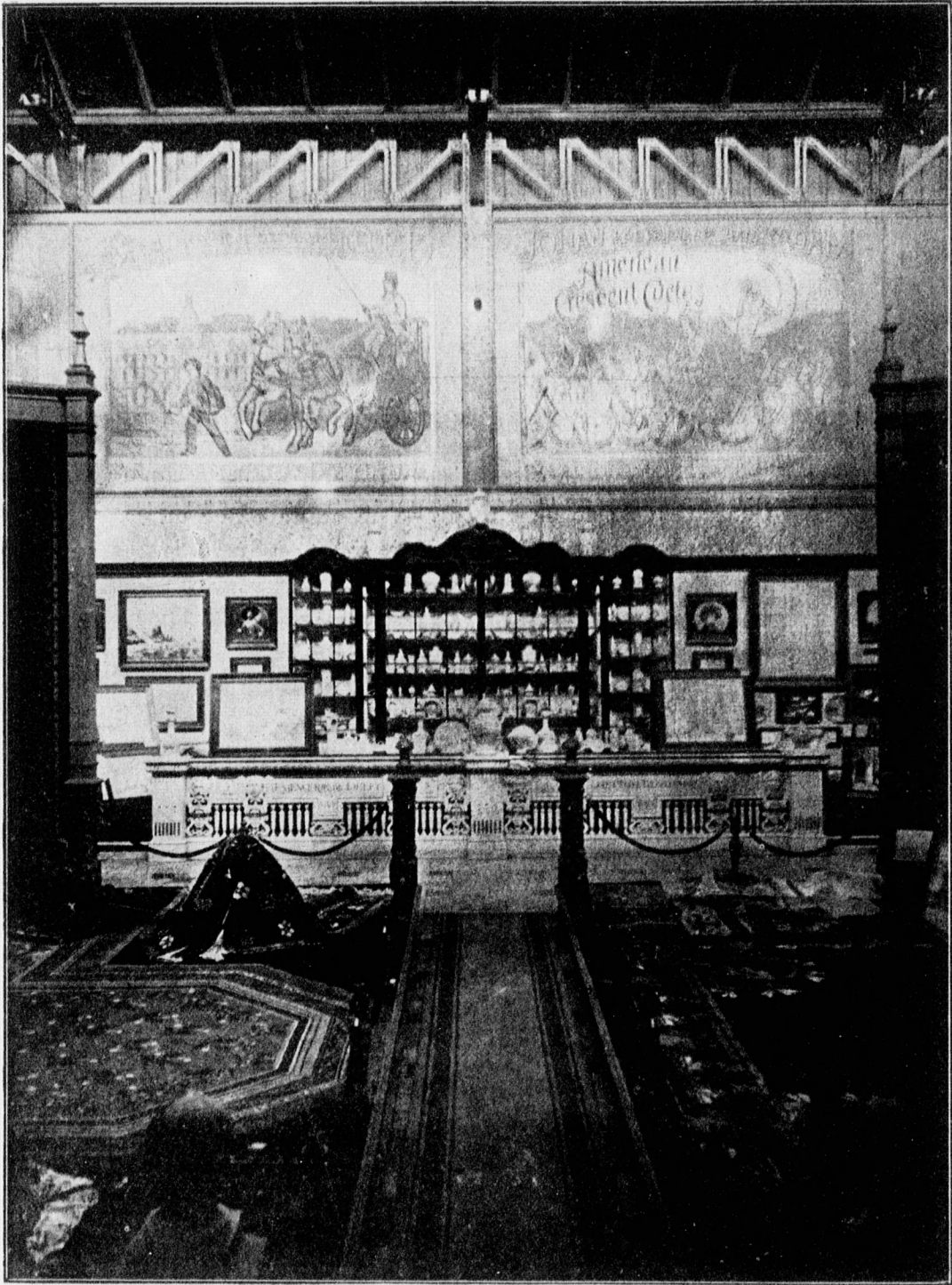
EXPOSITIE VAN JOOST 'T HOOFT & LABOUCHÈRE TE DELFT EN W. STEVENS TE KRALINGEN.