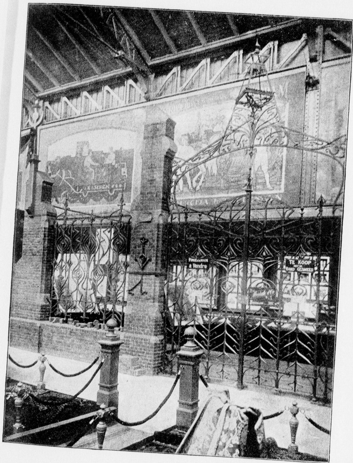
UIT DE HAND GESMEEDE IJZEREN HEKKEN VAN B. KRANIUS EN J. J. MEIJER TE AMSTERDAM.