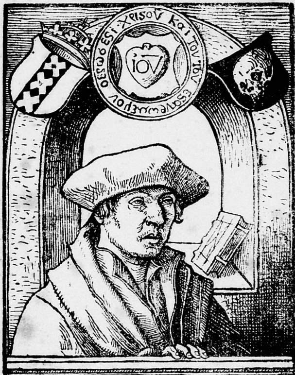
ALARDUS AEMSTELREDAMUS 1532.