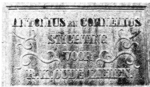
Gewelsteen in de voorgevel van Kloosterstraat 5 te IJsselstein (thans Het Centrum).