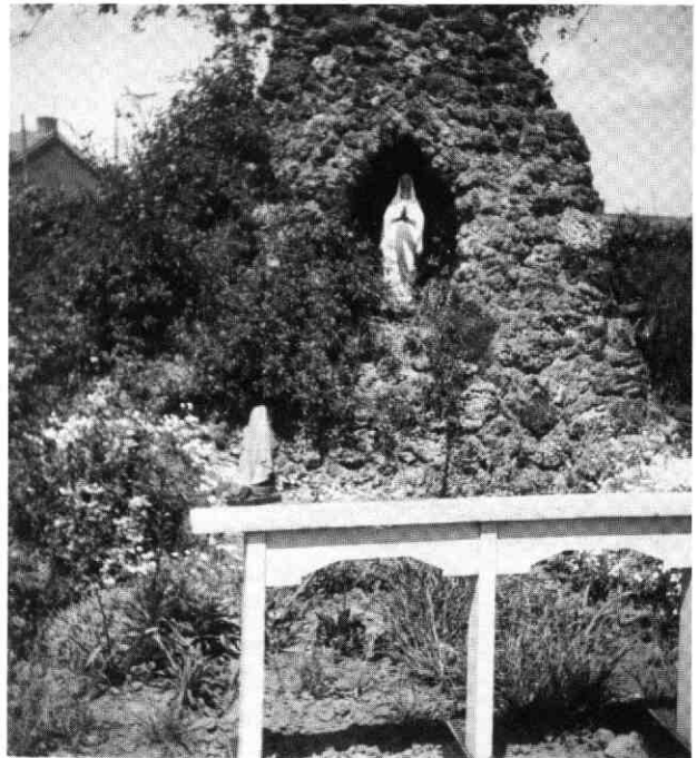
De 'Mariagrot' in de tuin van het ziekenhuis.

De zusters wilden voortaan elk jaar op St. Jansdag of de zondag na St. Jan een 'Heilige Sacramentsprocessie' in de tuin houden rond de 'Mariagrot'. Velen zullen zich deze processie nog wel herinneren.