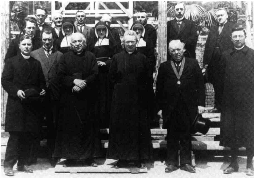
Eerste steenlegging met bestuur, burgemeester, pastoor, kapelaan en de zusters van St. Joseph.

maken voor de nieuwbouw. Tevens moest men onderzoeken of 'de Hofkamp' geschikt bouwterrein was. Het terrein werd na grondboring geschikt bevonden want tot op 6,5 m was er geen veen aangetroffen. Daarop werd besloten het terrein te kopen en '.....de overdracht der Hofkamp te doen plaats hebben na de vruchten Campagne' .