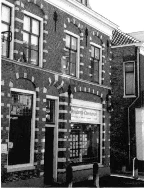
Utrechtsestraat 71 waar de Zusters van de Congregatie van Sint Joseph uit Amersfoort hun eerste huis- vesting vonden.