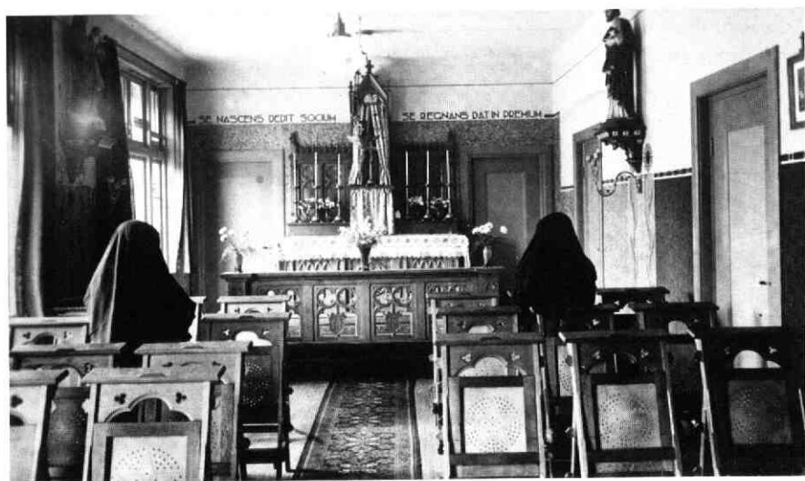
De oude kapel, begin jaren 30.

In 1930 nam het bestuur contact op met de 'Algemeen Overste' in Amersfoort voor eventuele overname van het ziekenhuis en pension. Zij schreef dat het mogelijk was maar pas over 2 jaar omdat zij eerst af moest wachten of ze wel herkozen zou worden. Intussen werd er ook druk gepraat over uitbreiding. Hierover kon men het niet eens worden. Dokter de Haas, operateur in het zie-