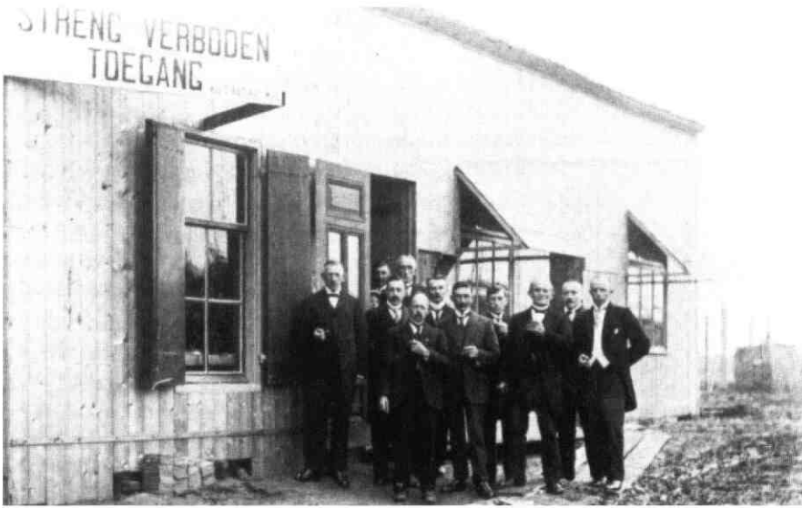
Bouwkeet met aannemers, bestuur en opzichters.