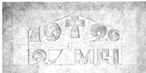
Eerste steen van 27 mei 1926.

financiën rond moesten zijn voor men verder ging met de plannen. Omdat Zuster Florentia geslaagd was voor het examen 'Huisbezoekster voor bestrijding van tuberculose' kon men nu wel subsidie aanvragen. Ook was er een gift binnengekomen van fl. 34,64 van de 'Coop. Onderlinge In- en Verkoop Vereeniging IJsselstein'. Een prachtig voorbeeld ter navolging hetgeen echter geen zoden aan de dijk zette. Daarom werd besloten een lening van ± fl. 100.000,- aan te gaan op losse schuldbekentenissen in stukken van fl. 100,-, fl. 250,- en fl. 1.000,- voor één jaar vast en met een opzegtermijn van 6 maanden tegen 5% rente per jaar, zo mogelijk in de gemeenten IJsselstein en Benschop. De storting moest plaats vinden voor november 1925. De beide pastoors namen op zich om 's zondags tijdens de preek de mensen