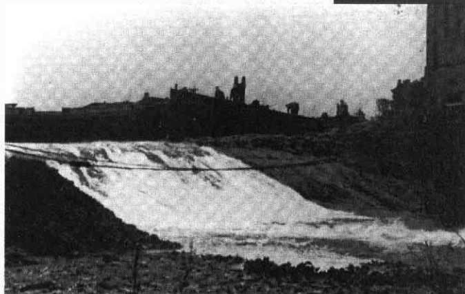
Gereformeerde kerk met twee afgezonken schepen. Hier stonden eens twee woningen.

Daartoe werd vanuit Stolwijk het hulpwerk geleid. Van de in aanleg zijnde provinciale weg werd zand met auto's naar Ouderkerk gestuurd. In Ouderkerk zelf werden man-