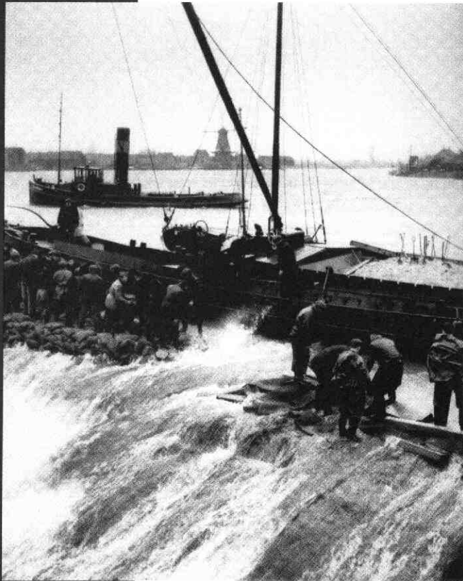
Wij kregen de taak om de met zand gevulde zakken en betonblokken in het gat te dumpen. (rechts op de foto)

Terwijl wij bezig waren met onze werkzaamheden werd ons verteld dat Hare Majesteit koningin Juliana op de ramp-plek was gearriveerd en vanaf de andere kant van de dijkdoorbraak de situatie in ogenschouw nam. Hoewel we uiteraard geen tijd hadden om uitgebreid naar de vorstin te gaan staan kijken, was dit voor het dijkleger een bijzonder opbeurend moment in een gespannen situatie. Het was voor iedereen die al vele uren onafgebroken in touw was, een stimulans om