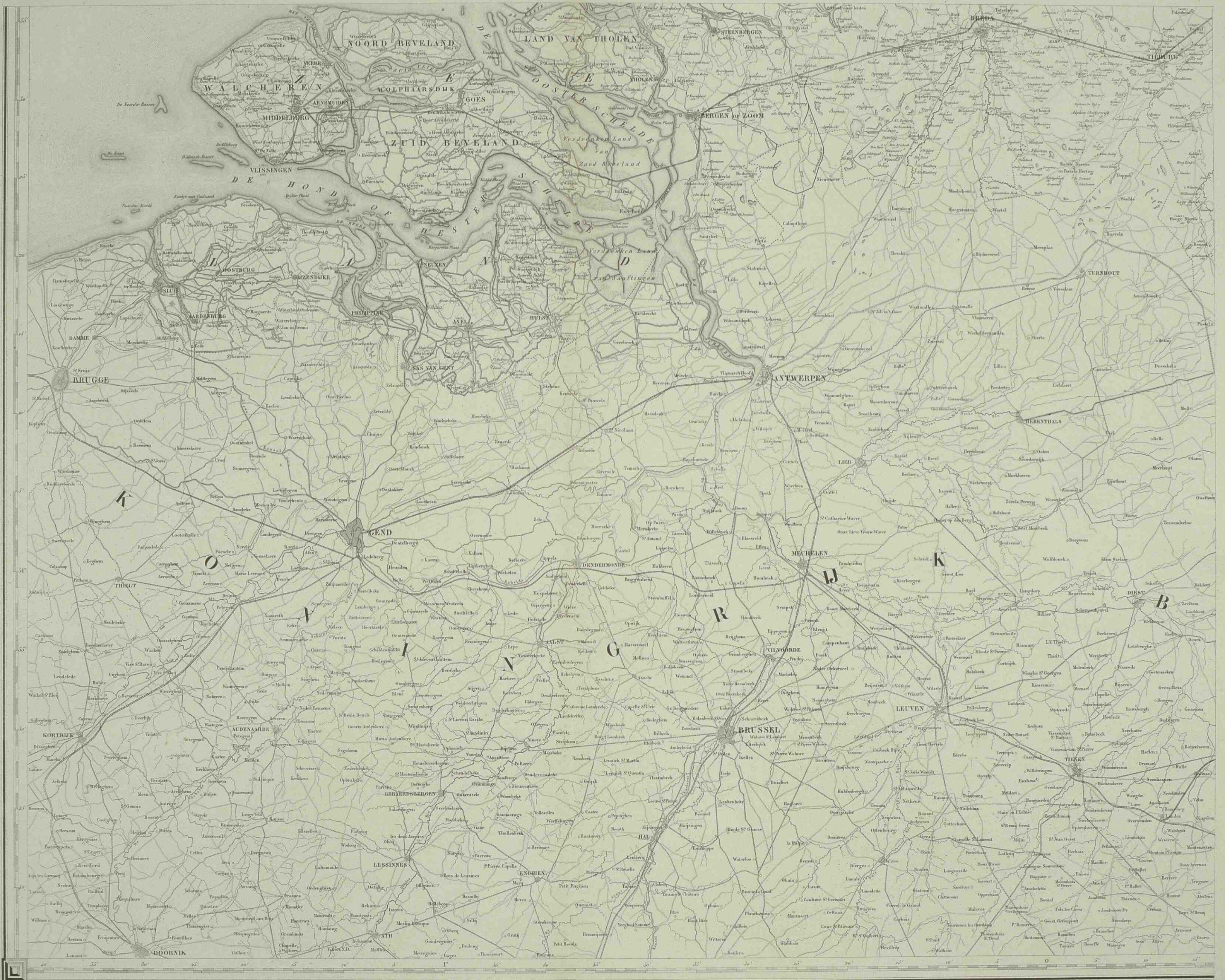
Verkeerskaart opgesteld bij de Eeren Doorman te 's Gravenhage.