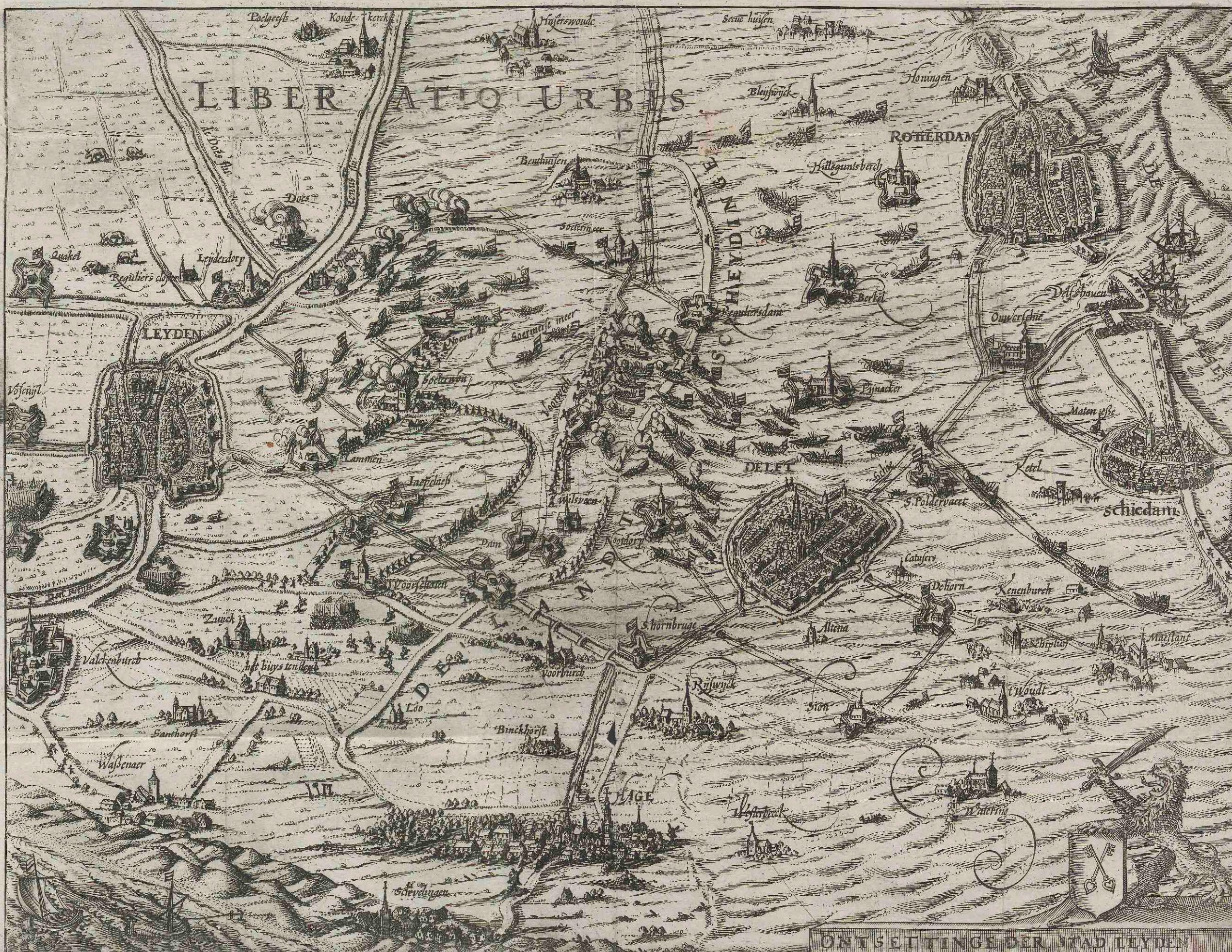
ONTSETTINGE DER STAD LEYDEN