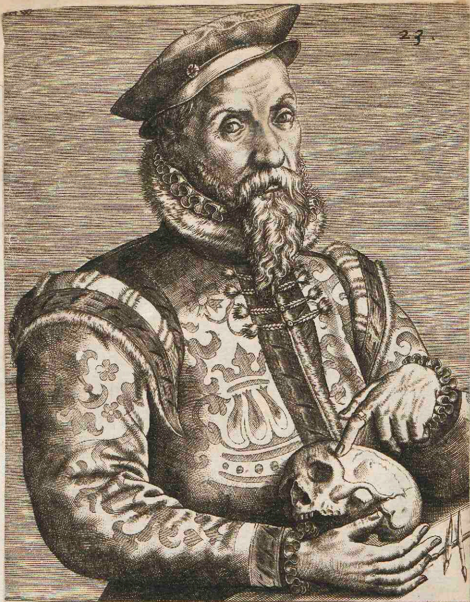
HIERONYMO COCO ANVERPIAN. PICTORI.

Fallor? an effigiem vultus, Hieronyme, primum Hanc duxit pictor post tua fata tui? Nescio quid certè torpens & languidum in illa Non prorsum indoctis innuit hoc oculis. Clarius, heu, sed enim loquitur caluaria cunctis, Indice commonstrat quam tua læua manus: Hi præiere Cocum artifices • quos deinde secutus Vos ijsdem comites ille, sibi que vocat.