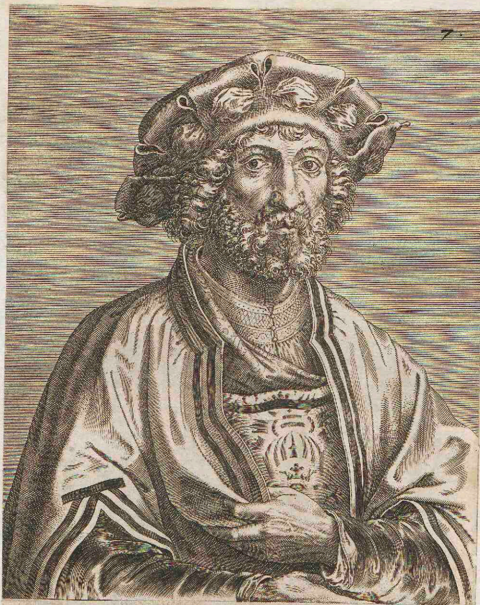
IOANNI MABVSIO, PICTORI.

Tuque adeo nostris seclum dicere, Mabusi, Versibus ad graphicen erudijisse tuum. Nam quis ad aspectum pigmenta politius alter Florida Apelleis illineret tabulis? Arte alijs, esto, tua tempora cede secutis. Peniculi ductor par tibi, rarus erit.