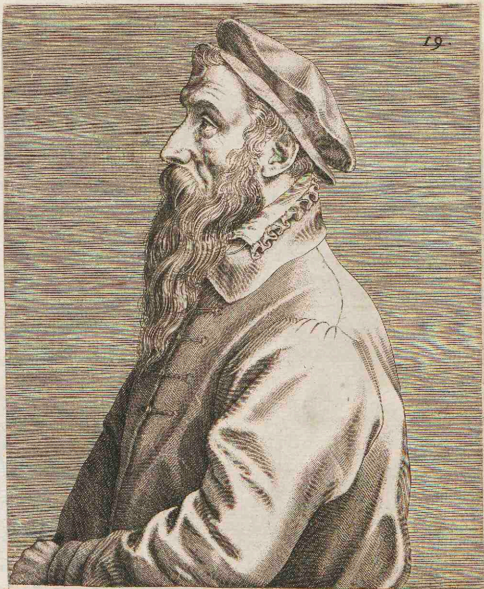
PETRO BRUEGEL, PICTORI.

Quis nouus hic Hieronymus Orbi Boschius? ingeniosa magistri Somnia peniculoque, styloque Tanta imitauerit arte peritus,