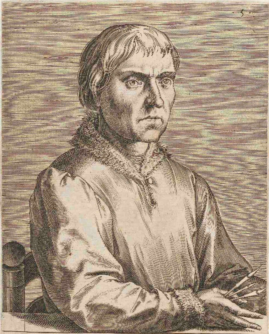
THEODORO HARLEMIO, PICTORI.

Huc & ades, Theodore, tuam quoque Belgica semper Laude nihil ficta tollet ad astra manum, Ipsa tuis rerum genitrice expressa figuris Te Natura sibi dum timet arte parem.