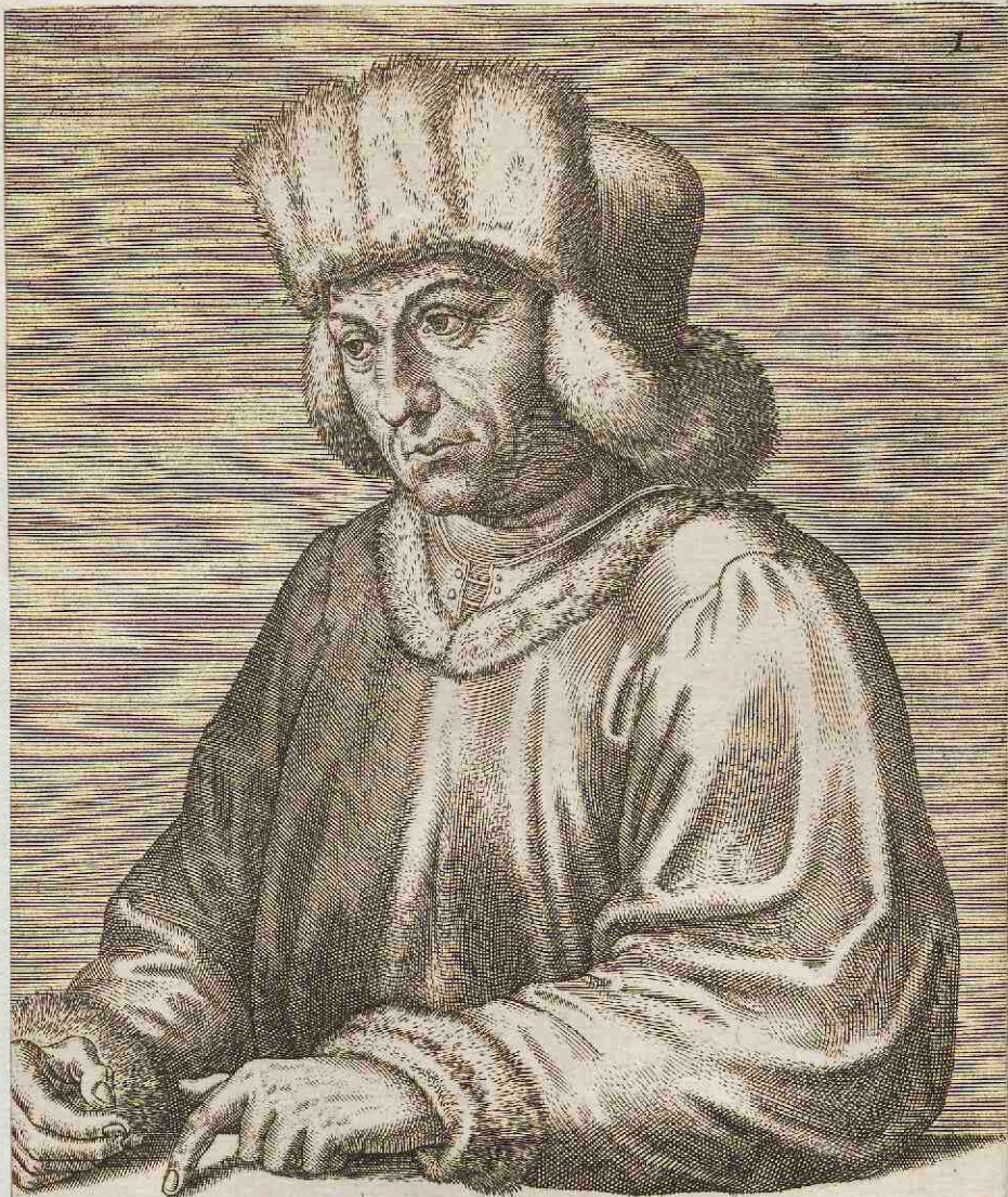
HVBERTO AB EYCK, IOANNIS FRATRI; PICTORI.

Quas modò communes cum fratre, Huberte, merenti Attribuit laudes nostra Thalia tibi, Si non sufficient : addatur & illa tua quòd Discipulus frater te superavit ope. Hoc vestrum docet illud opus Gandense Philippum Quod Regem tanto cepit amore sui : Eius vt ad patrios mittendum exemplar Iberos †Coxenni fieri iusserit ille manu.