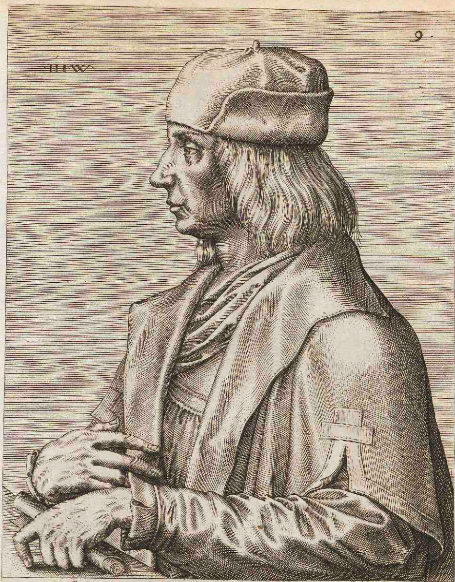
QVINTINVS MESIVS ANVER- PIANVS PICTOR.

Antè faber fueram Cyclopæus ast vbi mecum Ex æquo pictor cepit amare proci: Seque graues tuditum tonitrus postferre silenti Peniculo obiecit cauta puella mihi: Pictorem me fecit amor. tudes innuit illud Exiguus, tabulis quæ nota certa meis. Sic, vbi Vulcanum nato Venus arma rogarat, Pictorem è fabro summe Poëta facis.