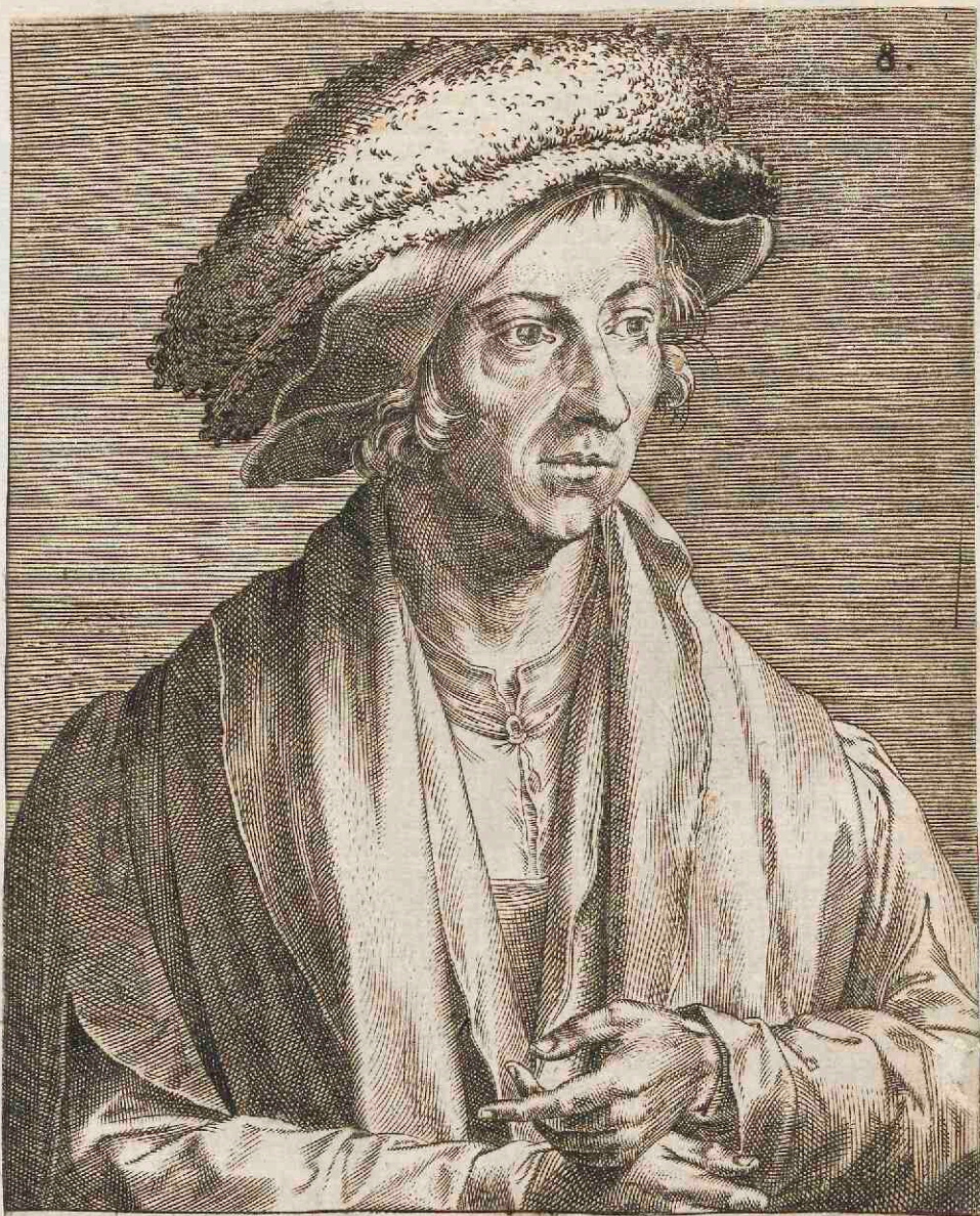
IOACHIMO DIONANTENSI PICTORI.