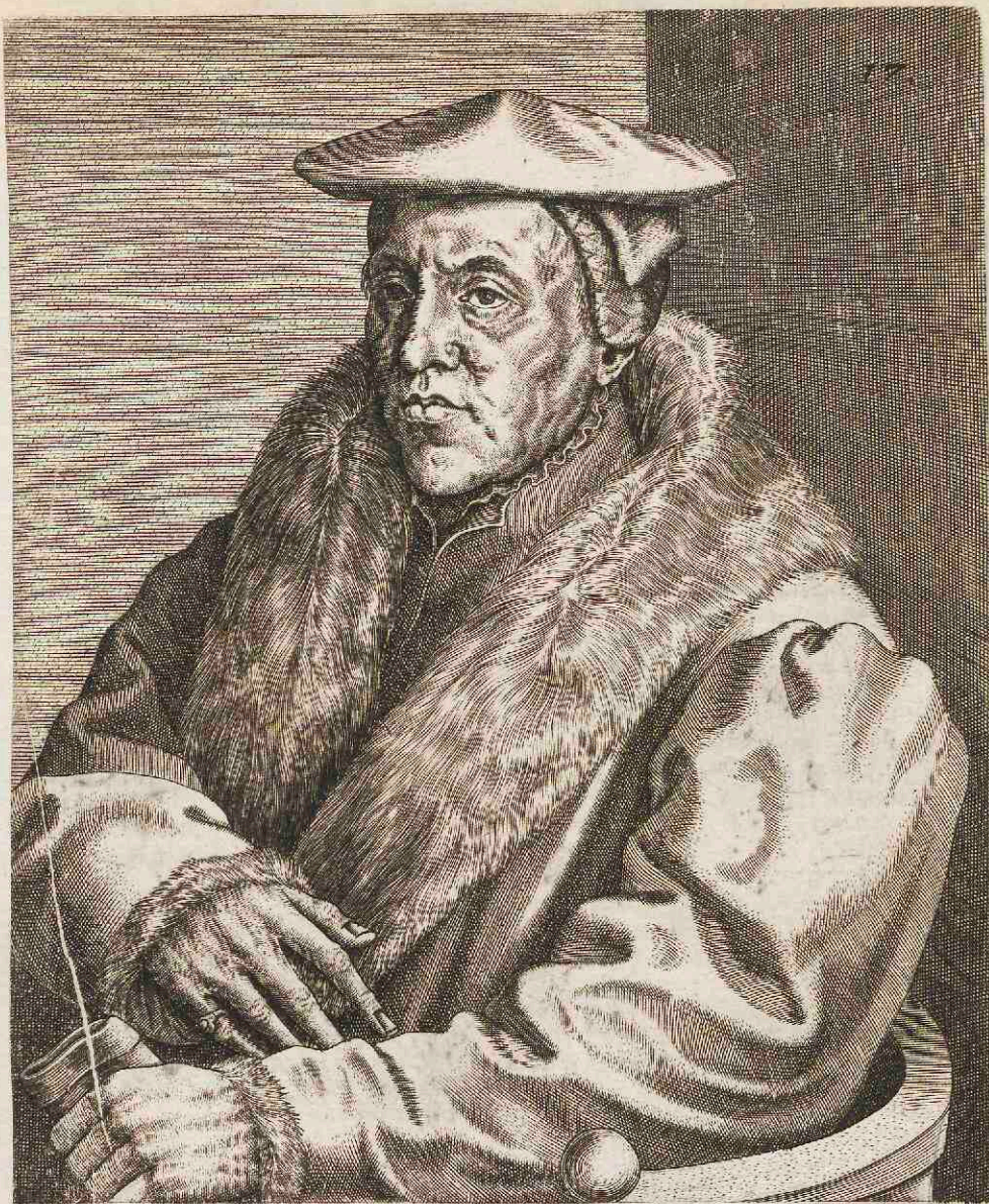
IOANNES SCORELLVS BATAVVS, PICTOR.

Primus ego egregios pictura inuisere Romam Exemplo docuisse meo per secula Belgas Cuncta ferar. neque enim iusti dignandus honore Artificis, qui non graphidas, pigmentaque mille Consumpsit, tabulasque schola depinxit in illa.