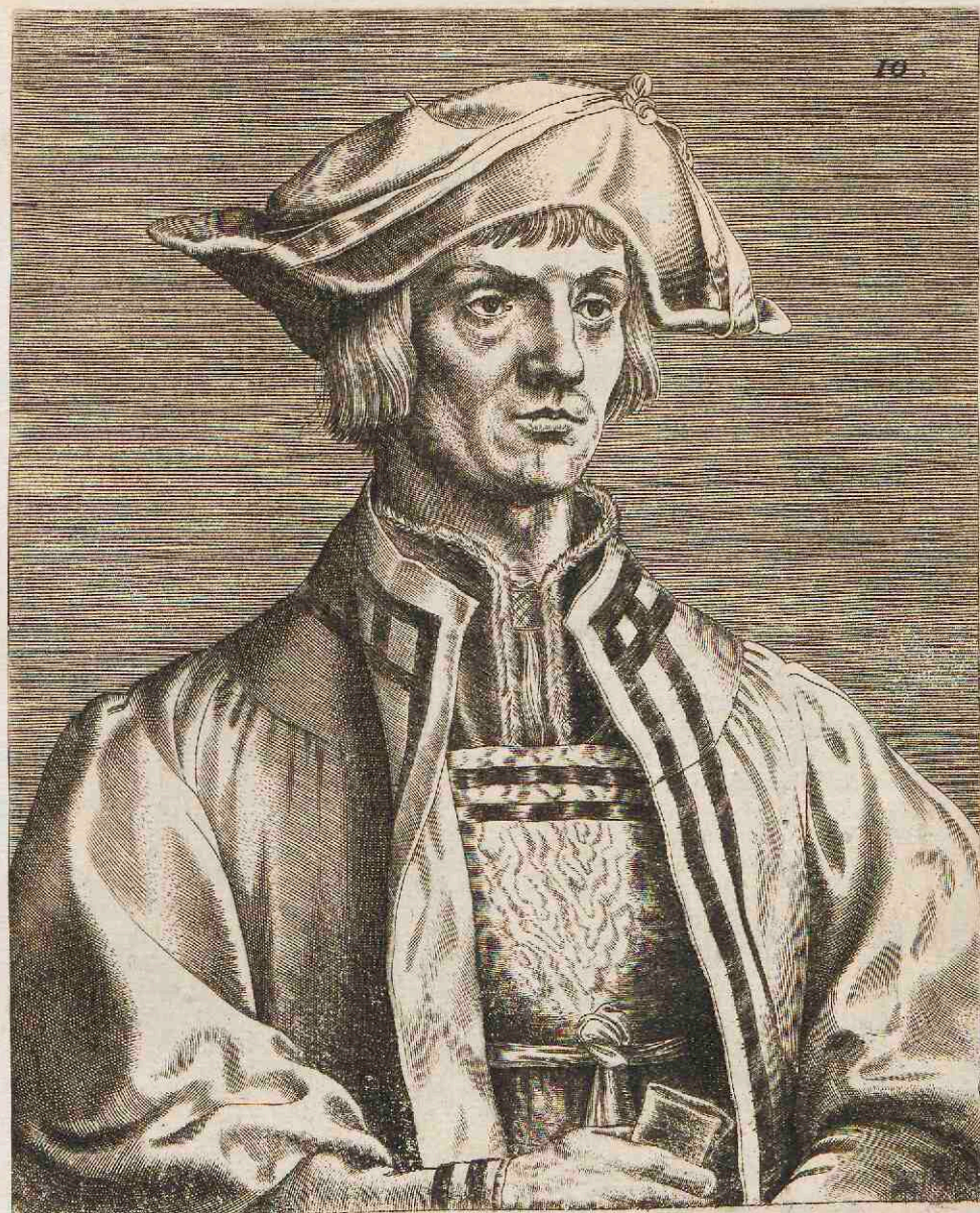
LVCAE LEIDANO PICTORI.

Tu quoque Durero non par, sed proxime, Luca, Seu tabulas pingis, seu formas sculpis abenas, Ectypa reddentes tenui miranda papyro, Haud minimam in partem (si qua est ea gloria) nostrae Accede, & tecum natalis Leida, Camena.