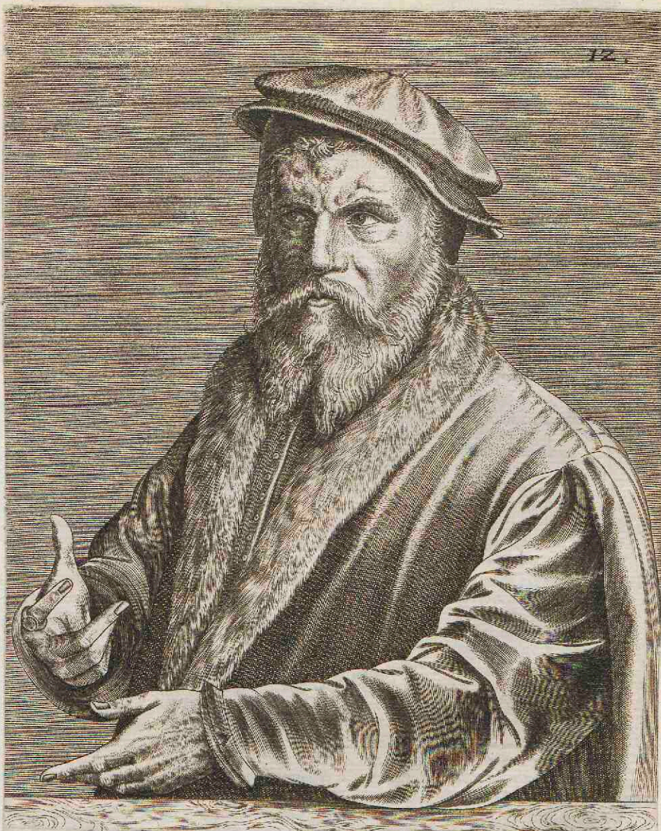
IVSTO CLIVENSI ANVERPIAN. PICTORI.

Nostra nec artifices inter te Musa silebit Belgas, picturae non leue, Iuste, decus. Quam propria, nati tam felix arte fuisses; Mansisset sanum si misero cerebrum.