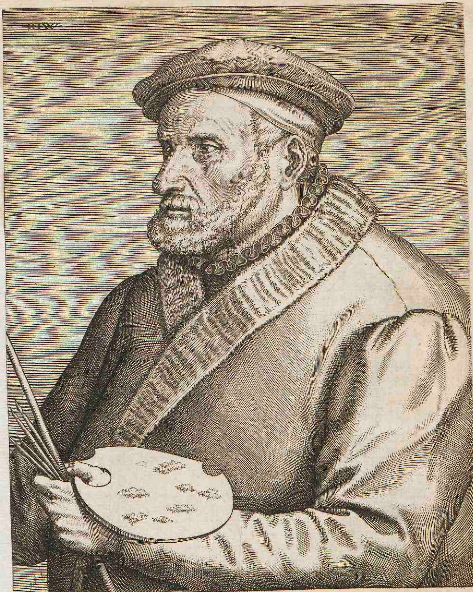
LVCAE GASSELO HELMONTANO, PICTORI.

Salve omnes, Lucae, ante alios carissime quondam, Nec leuius proprio culte parente mihi. Quippe mihi primus graphices datus auctor amandae, Dum pingis docta rura, casasque manu. Par arti probitasque tuae, candorque, bonorum Et quicquid mentes ducere amore potest. Ergo fama tuae virtutis, & artis in aevum Vuat, utroque mihi nomine amate senex.