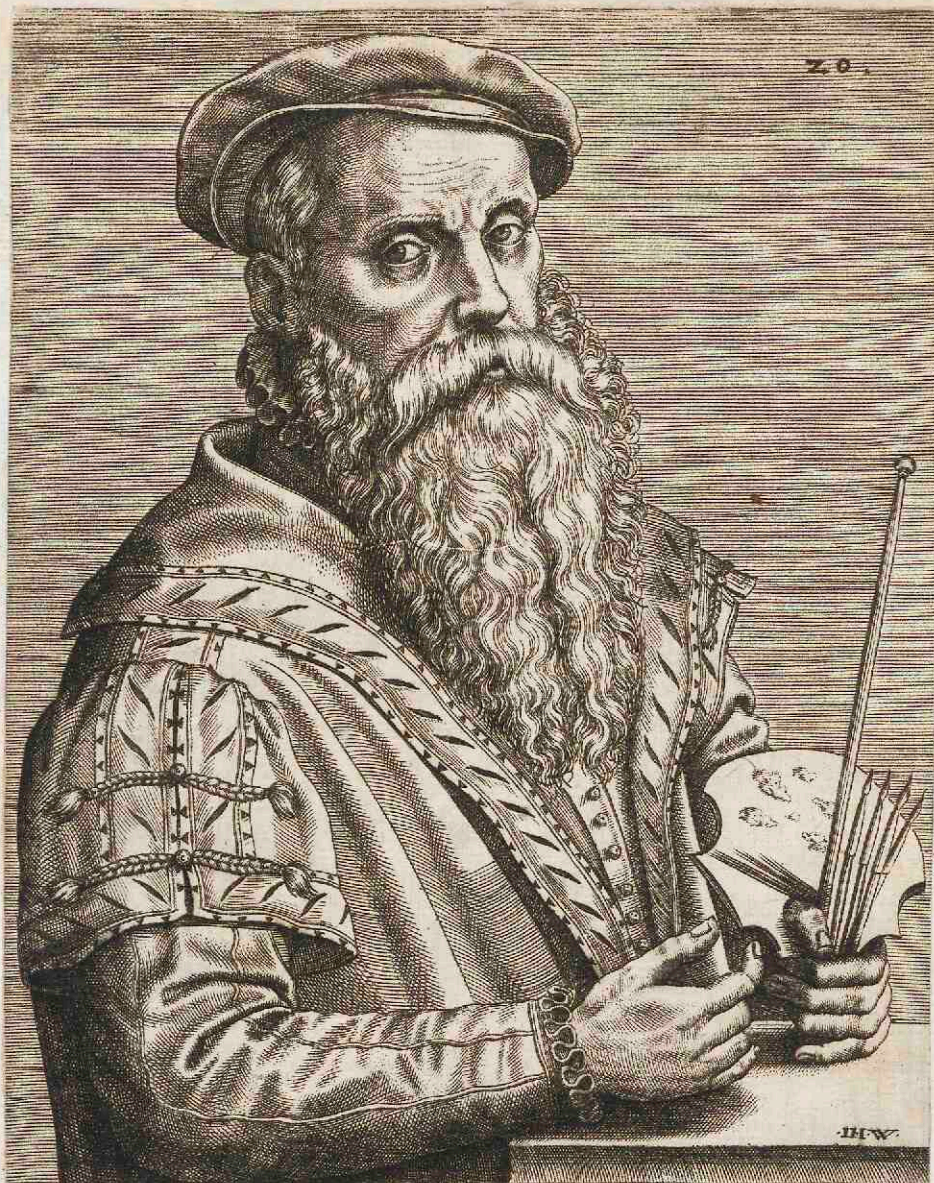
DE GVILIELMO CAIO BREDANO, PICTORE.

Quas hominum facies, vt eos te cernere credas, Expressit Caij pingere docta manus, (Si tamen excipias vnum, me iudice, Morum, ) Culpari Belgæ nullius arte timent.