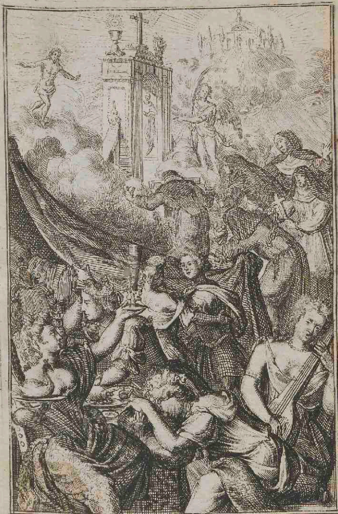
Afbeeldingen der eygene dragten nevens een korte beschryvinge van alle GEESTELYKE VROUWEN EN NONNE ORDERS.