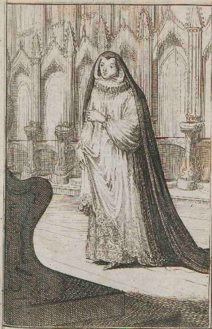
Canonissa Nobilis Colonienfis S ae Mariae in Capitolio