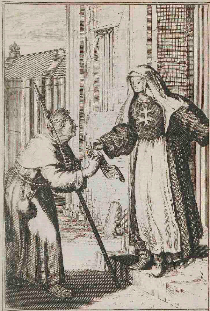
Hospitalaria St. Spiritus.