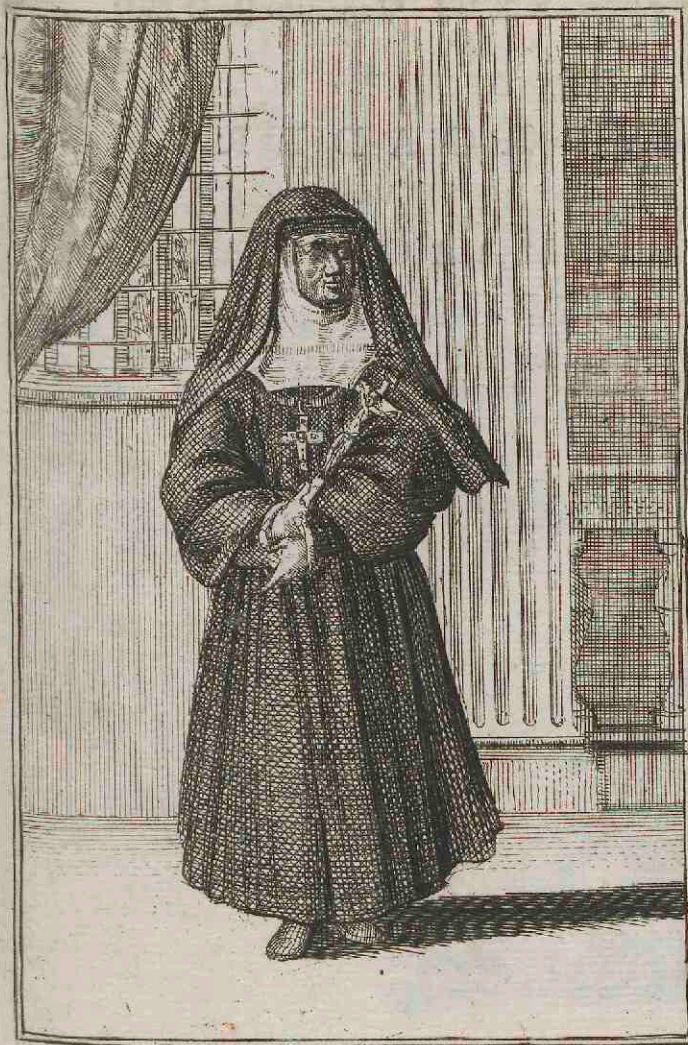
Virgo Visitationis B. Mariæ.

d'ORDER van 't bezoek der H. Maagd Maria is door den H. Francois de Sales, Biscop en Prince van Geneve, ontrent het jaar 1610 ingestelt; zynde de regels van d'instelling door hem ontworpen, en van den Paus zelfs goet gekeurt; is verders zoo gelukkig in de voortgang van zyn Order geweest, dat hy in zyn leven meer dan dertig Kloosters heeft kunnen tellen, die al te zamen na zyn regels leefden. De Stichtster die deze Order in Vrankrijk tot een groote aanwas gebracht heeft, en als voor de grontlegster met recht kan verstreken, is geweest de eerwaardige moeder Joanna Francisca Fremiot, Vrouwe van Chantail. Zy zijn gantsch in 't swart laken gekleed, met een linnē overrok aan. De H. Francois de Sales is in 't jaar 1664. door Paus Alexander VII. in 't getal der Heyligen gestelt, en word zyn feestdag door gantsch Vrankrijk plechtelyk geviert.