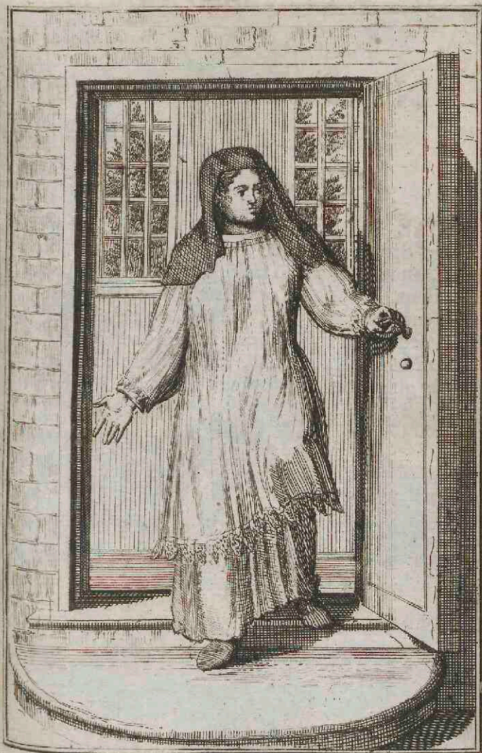
Abbatissa St. Cassiani.

D Eze Order is ingestelt door den H. Cassianus, geboren tot Alexandrien, in Ægypten, die zyn wereltlyke goederen verliet om de eeuwigdurende te vinden. Hy toog dan na Palestina, om de heilige Plaerzen te bezoeken, en van daar na Marseille, tot aan 't Stedeken Autun, alwaar deze Nonnen haer begin, en hy zijn einde gevonden hebben ontrent het jaar 400. De Abdissen gaan gekleet in witte Wol, met een linne Subtil daar over, en de swarte Wiel op 't hoofte. Zy zijn naderhand, volgens Pauselyke schikking, onder den regel van den H. Augustinus bevestigd.