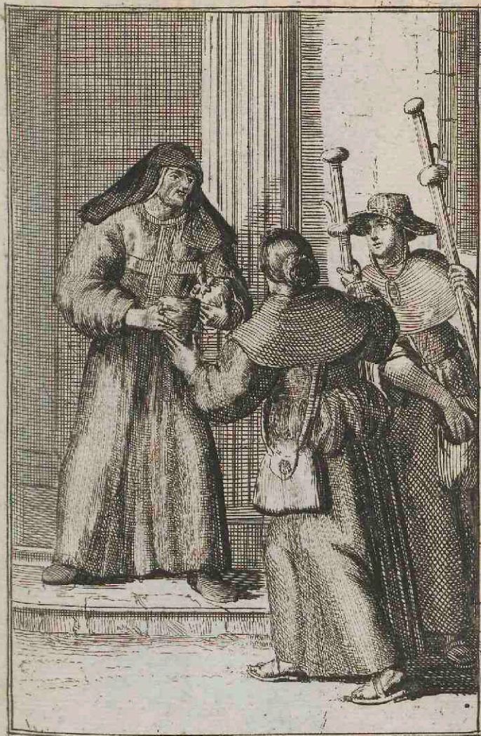
Hospitalaria S ti Joannis Hierosolymitam.

V erscheyde schrijven 't begin der Mannen of Ridders dezer Orders toe aan Johannes Hircanus, een der kinderen Machabeën. Andere weder aan Johannes den Aalmoessenier, 'Aartsvader van Alexandrien. Alhoewel zy haar beloften aan den H. Joannes den Dooper doen, en hem als voorstander dezes Orders erkennen. Andere meynen, en meer gegront, dat de oorspronk maar van eenen Gerard te achten zy, die ten tyde als Godfroy de Bouillon Jerusalem innam, door hem daar ingezet is, en de stichting van 't Jerusalems Gasthuys de naam behouden heeft. Paus Gelazius was de eerste die deze instelling voor goed keurde. De Gasthuys-Nonnen van deze zelve naam, die men tot Romen, in 't Gasthuys van de H. Maria Magdalena vind, zijn ontrent het Jaar 1080 door de welzalige Agnes, tot Romen geboren ingevoerd, in 't welk de reyzende, en pelgrims, die na 't H. Land gaan, van nooddruft en reys-gelt versorgt worden. Zy zyn gewielt, en gaan met een leusgrauwe rok, met een rood kruys op de borst, gekleed, en leven volgens de regels van den H. Augustyn.