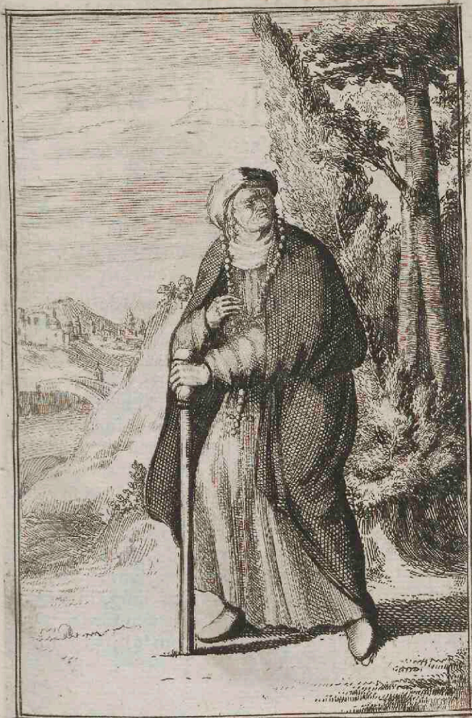
Virgo boni Iesus Ravennæ.