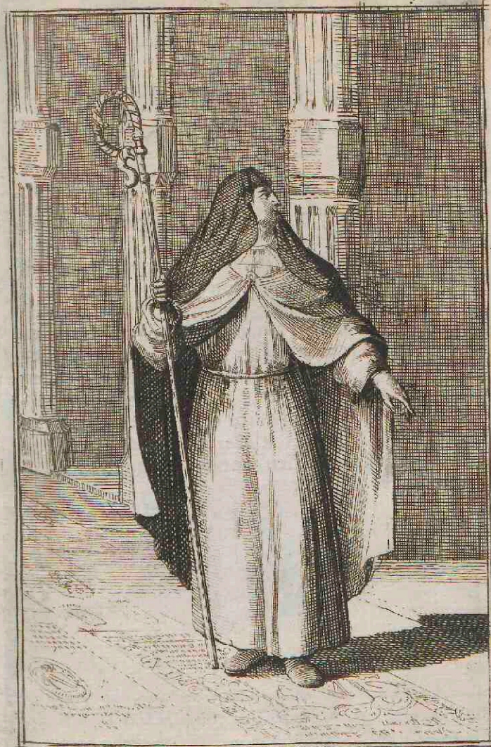
Canonissa Belgica Germanica &amp; Lotharingica