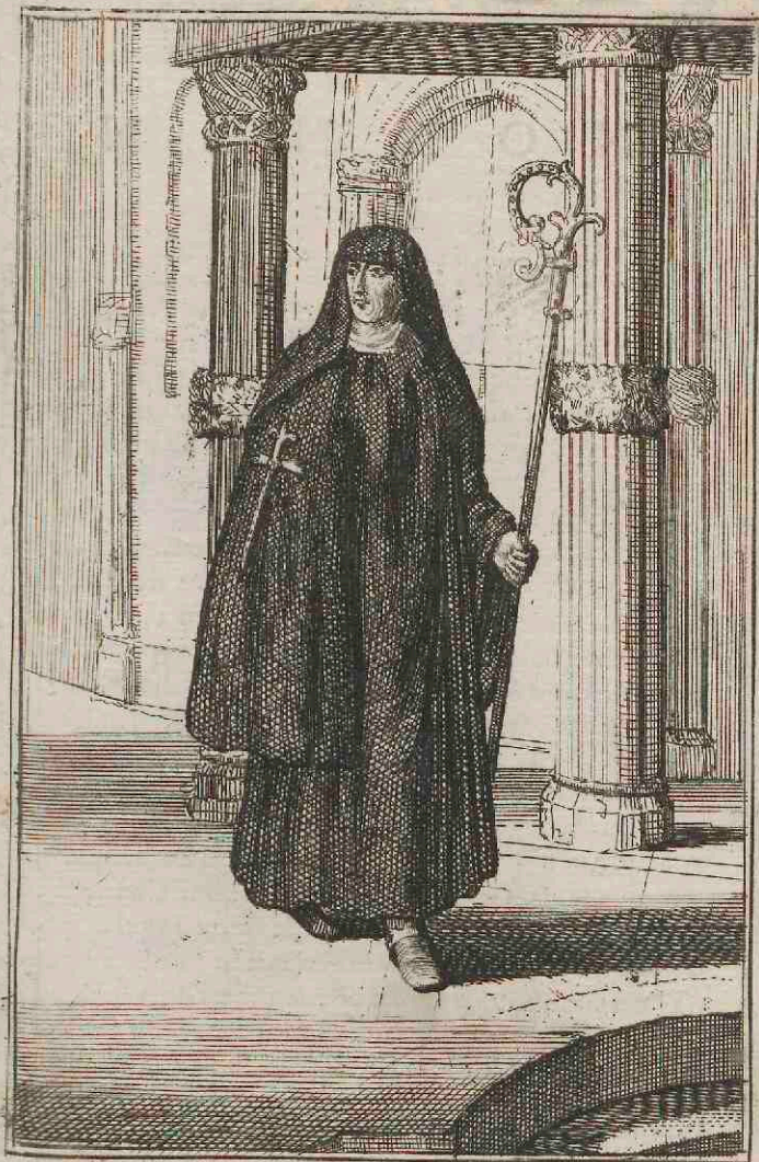
Monialis ordinis Equestris S ti Jacobi de Spata.

M EN meynt dat een Abdiffe van 't Klooster van den H. Geest te Salamanca, de eerste Commendadora of Bevelhebster van de Geestelijke Ridders Vrouwe Order van St. Jacob ( de Spata ) met den Swaarde geweest zy, ontrent het jaar 1030; maar andere meynen dat dees Order opgericht is in Leon en Galiffien, door desselfs Koning Ferdinand, ontrent het jaar 1170; haar oeffening bestaat in 't herbergen en 't behulpzaam zyn der arme Reyzigers die na St. Jacob in Galiffien haar bedevaard gaan doen. Zy zyn onder den regel van den H. Augustijn, en volgens Pausfelyke brieven is den Koning 't altijdduurend hoofd van deze Order. Zy zyn geheel in 't zwart gekleed, en op de rechter zijde haars overroks is een rood swaard, mer een schulp op 't kruys van 't geveest.