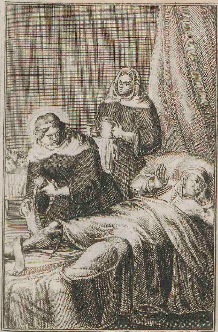
Mulier Infirmis Ministrans.

D E eerste die Orders voor de Vrouwen ontworpen en opgesteld heeft, om de kranken te dienen, en alle noodzakelijkheden te verzorgen, is de H. Fabiola geweest, die ontrent het jaar 390 leefde. Men vind haar met swarte klederen afgebeeld.