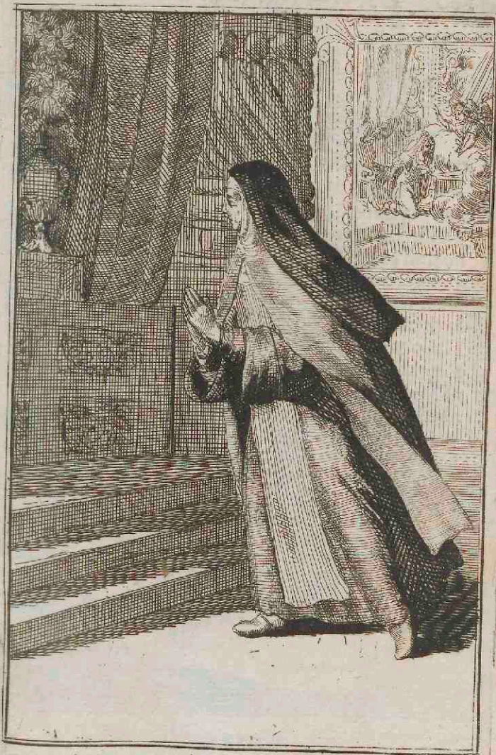
Annuntiata altera .