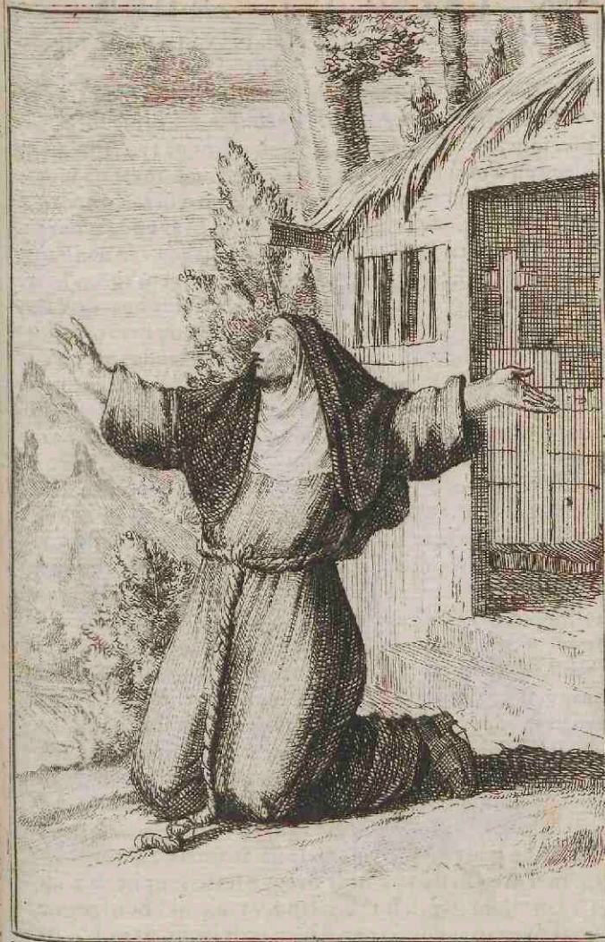
Pœnitens tertii Ordinis S. Francisci, apud Germanos

I N 't hoogste van Duytsland vind men noch een zeker slag van Nonnen van den H. Franciscus, die haar uyt het Klooster in de bosschagien begeven, om aldaar meerder berouw en strengheid te oeffenen; Zy wonen en leven daar als de aaloude Kluyzenaasters, in een van de Steden verafgelegen hoek, in een kleyn celletje of hutje, en leven meest van kruyden of wortelen. Zy gaan gekleed met een grauwe rok, die met de koord gegord is, en dragen groote houtse klompen aan de blote voeten.