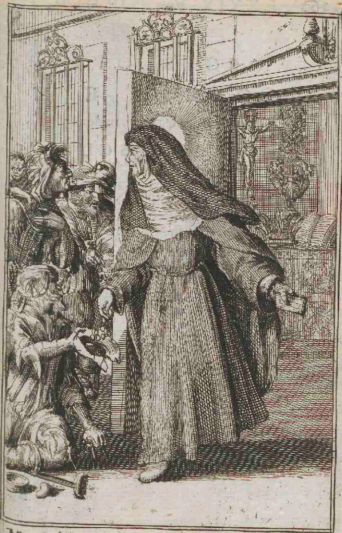
Monialis tertii Ordinis S ti Francisci.