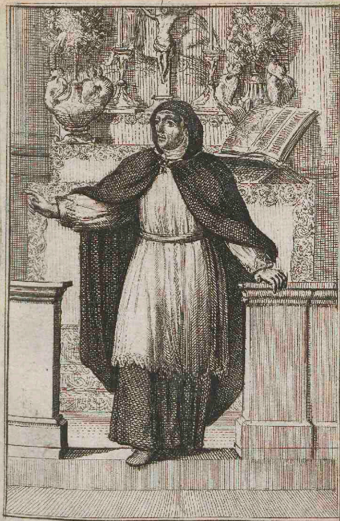
Canonissa Regularis S t i Augustini.

D E H. Brigitte in Schotland uyt een slavinne geboren (op welke haar Vader, alhoewel getrouwd, om haar byzondere schoonheyd, verliefde) door wonderwerken en groote heiligheyd zeer vermaard. Zy was mede van zoo een volmaakte schoonheyd, dat ze van de aenzienlijkste des Rijks ten huwelyk verfocht wierd; maar haar zin meerder tot de Godtsdienst en zuiverheyd strekkende, bad zy God dat hy deschoonheyd (haer hinderlijk) geliefde weg te nemen, gelijk zy ook haar een oog verloor, door welke mismaaktheyd zy haast rust kreeg, en in een klooster ging; zy stichte de Order der Geregelde Kanonikessen, volgens de regels van den H. Augustijn, ontrent het jaar 615; zy gingen voor dezen in Engeland, Schotland, Yrland, en Nederland, met een swarte onder en linnen overrok, en met een swarte mantel, zelfs over de swarte wiel, omhangen. Deze klederen zijn by de Nederlandse tegenwoordig wat verandert, als by de volgende blijkt.