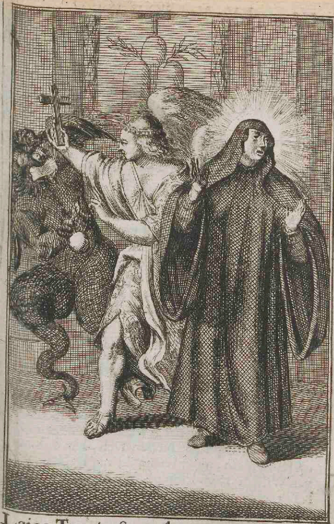
Laica Turris Speculorum, montis Oliveti.