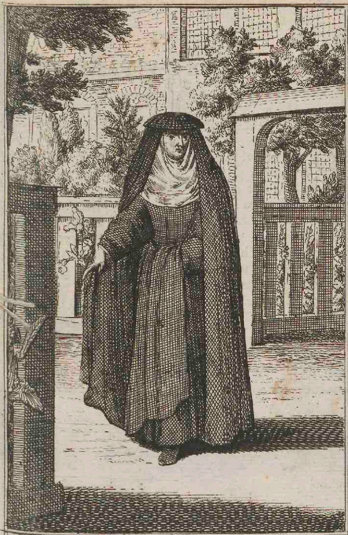
Beggina Antverpiensis .

D Eze gaan mede in 't swart gekleed, met een huyk op 't hoofd, en een schorte-kleed voor 't lyf, zy zijn aan geen beloften van zuyverheyd voor altijd gebonden, maar als 't haar welgevald, zoo word haar toegelaten te trouwen, zonder dat het haar voor schande gerekend word; maar haar huys, 't geen zy op 't hof hebben, moeten zy afftaan, ten behoeven der arme Beggijnen die daar uyt onderhouden worden.