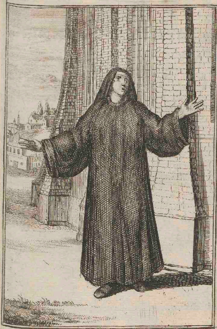
Canonissa sti. Basili.

Ontrent het jaar 300. na Christi geboorte, leefde den H. Bazilius, die 't aldereerst de Moniken en Nonnen, die tot dees tyd toe zonder eenige gefchreve regels na haar eygen goedduncken in wilderniffen, kloosters, en afgezonderde woningen geleefd hadden, vergaderde, en deedde in kloosters onder zekere regels, die hyze voorschreef, leven, welke door Paus Siricius bevestigt, door veel volgende bekrachtigt, en met voorrechten vereert zijn, 't geen een zeer groot gevolg heeft gehad in Griekenland, Egypten, 't Heylige Land, en zelfs in Europa, tot het binnenste van Duytsland toe. Onder de eerste Nonnen teld men een van zijn toehoordsters, de H. Theodora, die de eerste Canonikes van zijn Order, ontrent het jaar 340. is geweest; zy gingen gekleed met een wijde swarte rok, een weynig met de Moniken van gedaante verschillende, met de swarte wiel op 't hooft.