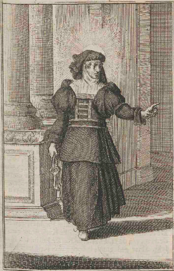
Sta. Phoebe Diaconissa.

Z Y wort door den Apostel Paulus aan 't leste Hoofdstuk van de Zendsbrief aan de Romeynen, haer met deze woorden aanbevolen: Maar ik bevele u onze Zuster Phoebe, die een Dienaresse der Cenchrenfer Kerk is, op dat gy haar ontfangt in Kristo, gelijk Heylige Mannen betaamd, en dat gy haar behulpig zyt in al 't geen waar in zy uwer van noden heeft; en gelijk zy veele bygestaan heeft, is zy my ook behulpig geweest. Volgens d'Aantekening van Erasmus van Rotterdam, zoude zy ook die Zendsbrief des Apostels, van Corinthen aan de Romeynen afgezonden hebben. Men vind haar onder zeer oude overblijfsels, op deze nevensstaande wijs afgebeeld, met een bos Sleutels aan de hant; de kleur van 't kleet is duyster om te weten, maar wy hebbenze in 't swart gesteld.