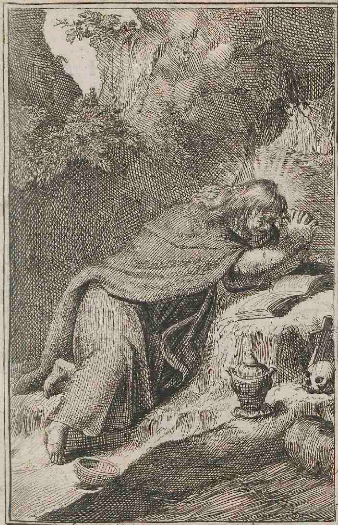
Sta. Maria Magdalena vitae Eremiticæ patrona.