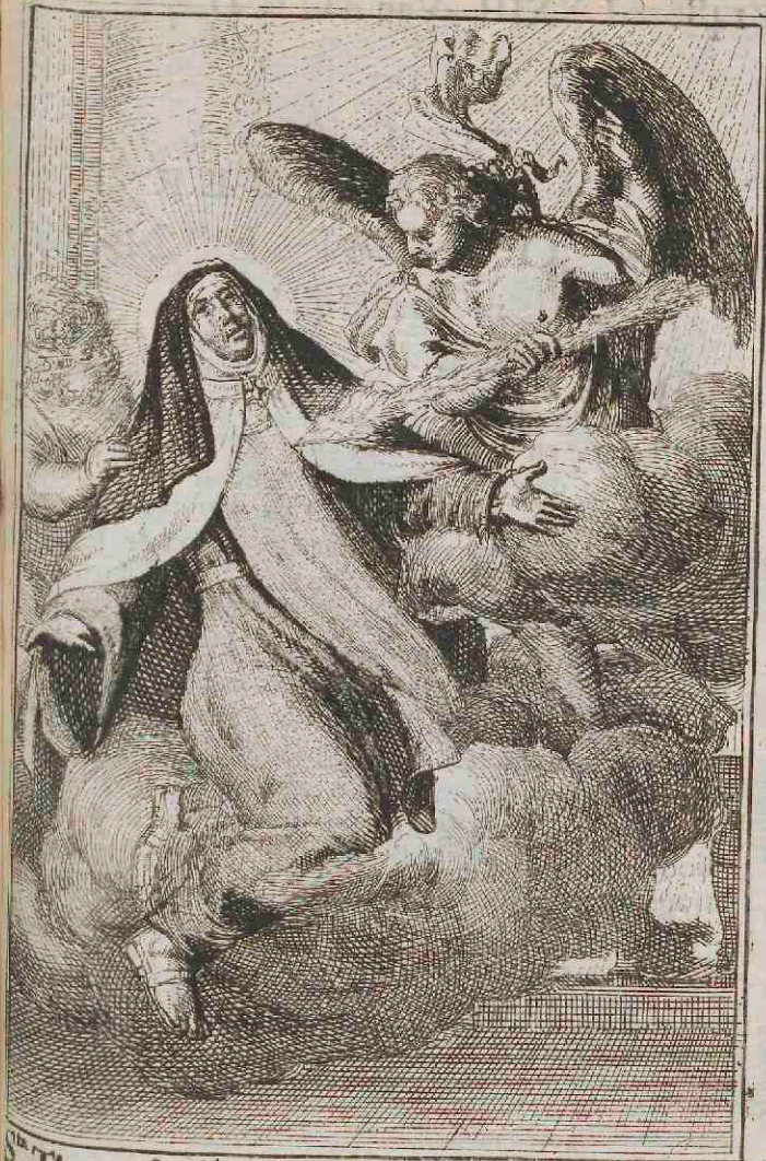
S ta . Theresia Carmelitarum Discalceatarum Fundatrix.

D E H. Theresia de Jesu, geboren in Spanjen, op den 28 Maart 1515, heeft het begin gegeven aan d'Order der Ontschoejde Karmeliten, zoo Mans als Vrouwen, als wanneer Paus Leo X, Ferdinand en Johanna, ouders van Keyzer Karel de V, en Maximiliaan desselfs Grootvader, leefden. Zy haar jonge jaren in alle deftige deugden doorgebracht hebbende, trad op haar twintigste in een Karmeliter Klooster te Avila, haar geboorte Stad, tegen de wil en 't goedvinden van haar Ouders. Eenigen tyd hier na stichte zy binnen dezelve Stad het Klooster van den H. Joseph, alwaar zy de oude luyfter en klooster-tucht deed herleven; hervormde de regels, en schreef haar een byzondere strenge manier van leven voor; deed de geestelijke haars instelling van beyde Sexen blootsvoets gaan, onder 't verlos en goedvinden des Paus. Zy bleef alhier vyf jaren, en stichte voorts op veel meer andere plaatzen klooster-woninge, doenmaal met zeer zobere renten voorzien; Paus Gregorius XIII. was 't die haar regels en instelling in 't jaar 1582. bevestigde, in welk jaar zy sturf. Paus Paulus V. deed in 't jaar 1614. met groote plechtelykheyd haar heiligmaking-dag op den 24 April, zoo wel tot Romem, als de gantsche Kriстен wereld door, vieren, en zy is door Gregorius de VIII. in 't jaar 1622. gecanoniseerd. De klederen die de Nonnen van deze Order dragen, zyn gelyk met de voorgaande, te weten een grauwe rok en Scapulier, een witte mantel, en deswarte wiel op 't hoeft. LXXIII.