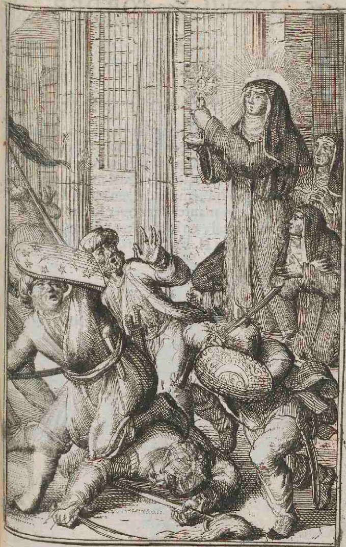
Ordinis S tae Claræ.