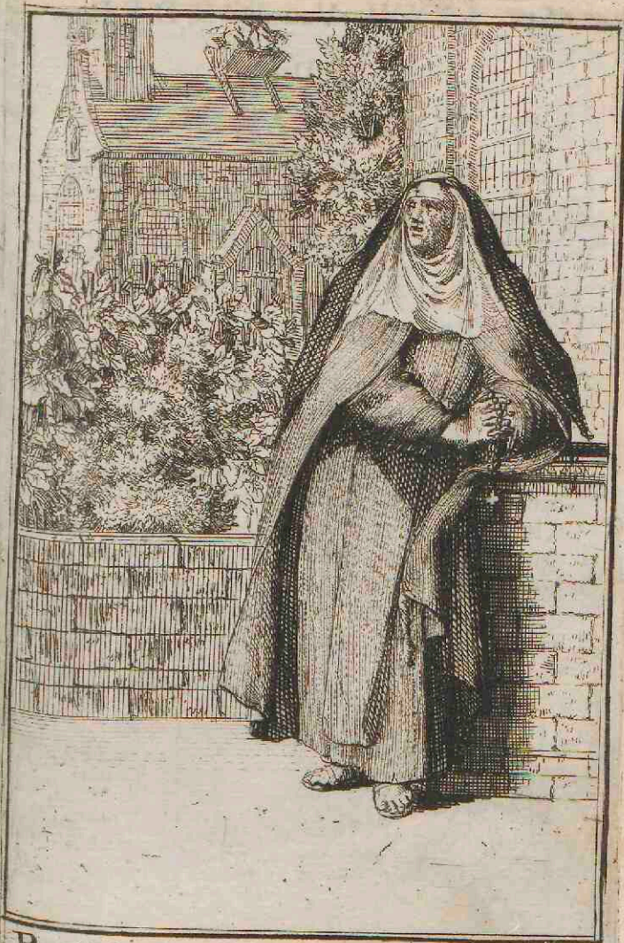
Poenitens tertii Ordinis S ti Francisci.