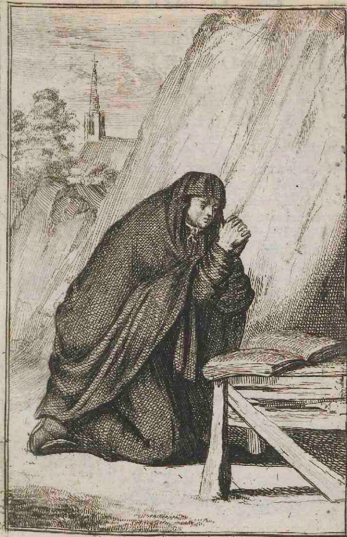
St a . Marcella.