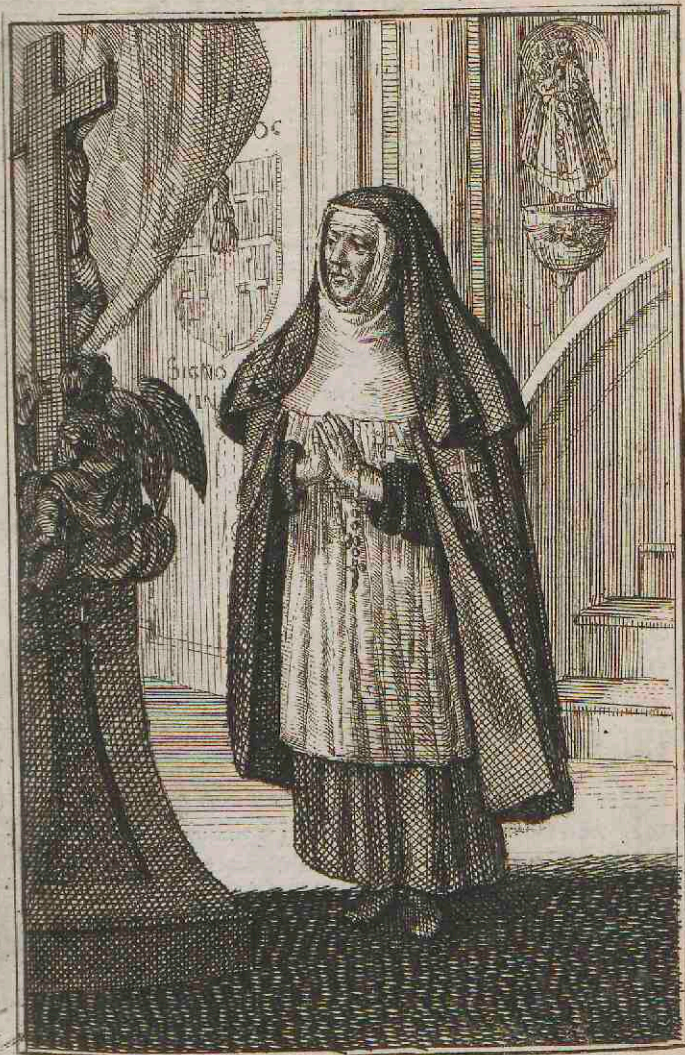
Canonissa Regularis S ti Sepulchri.