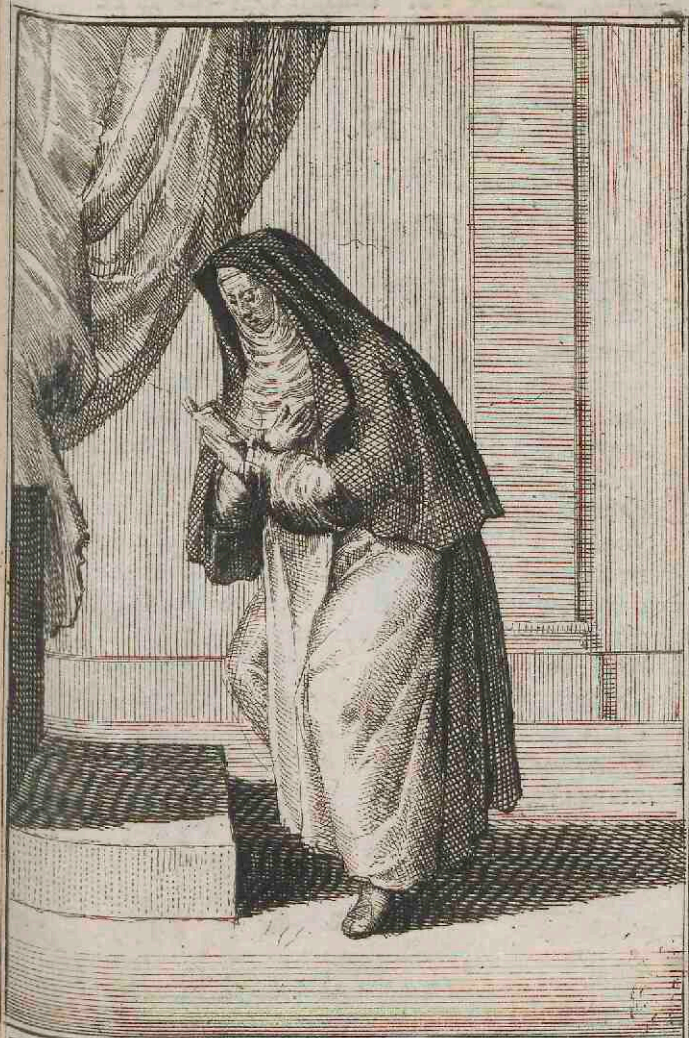
Monialis primi ordinis S ti Dominici.

A Ls den H. Dominicus in Languedocq tegens d'Albigensen leerde en predikte, omtrent het jaar 1206. stelde hy dit slag van Nonnen in, onder den regel van den H. Augustinus; hy verbond haar tot gehoorzaamheid, zuiverheid en derving van eygen goed; dragen de swarte wiel, en zyn geheel in 't wit gekleed, deze noemt men van den eersten regel of 't school van den H. Dominicus. De regels zyn door Paus Honorius III. bevestigd, en hy zelf door Gregorius IX. in het jaar 1235. onder de Heyligen geplaatst. Deze Nonnen zyn schier de gantsche Kristen wereld door verspreid, en bezitten tegenwoordig veel rijke en kostelijke Kloosters.