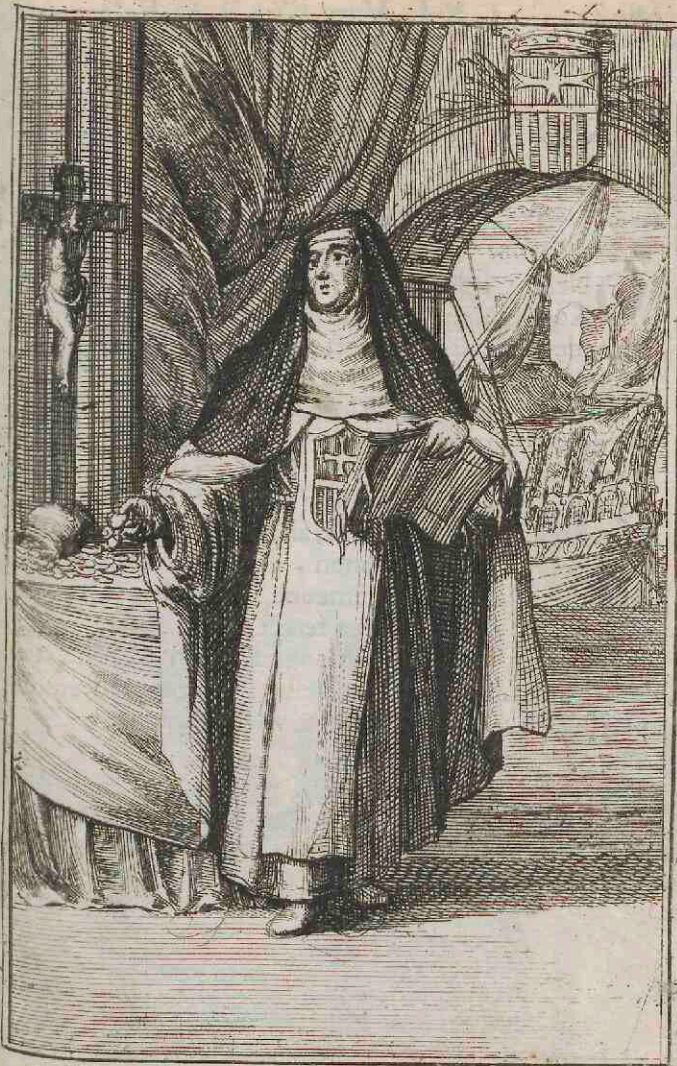
Monialis mercedis Captivorum

E Enigen tijd na dat de Order der Barmhertigheid tot het verlossen der Gevangenen uyt de Turkze slaverny, was ingesteld tot Barclone, door Jakob, Koning van Arragon, en in 't jaar 1230. van Paus Gregorius IX. onder den Regel van den H. Augustinus, bevestigd, heeft de zalige Maria Socors mede een Nonnen-Order tot die zelve inzicht opgerecht. Zy is gestorven tot Barclone, in 't jaar 1288, en ligt daar ook begraven. De Nonnen van dees Order zijn gewield en gantsch in 't wit gekleed, met het wapen des Konings van Arragon op de borst.