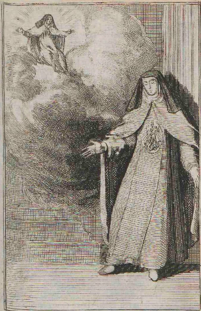
Monialis Conceptionis B Mariæ Virginis

IN 't jaar 1484. is deze Order in Portugaal door de H. Beatrix de Silva ingesteld. Zy gaan gantsch in 't blaau gekleed, hebbende op haar Scapulier een beeld van Maria, met het kindje Jesus op den arm, 't welk mer een speer een draak onder de voeten van Maria dood.