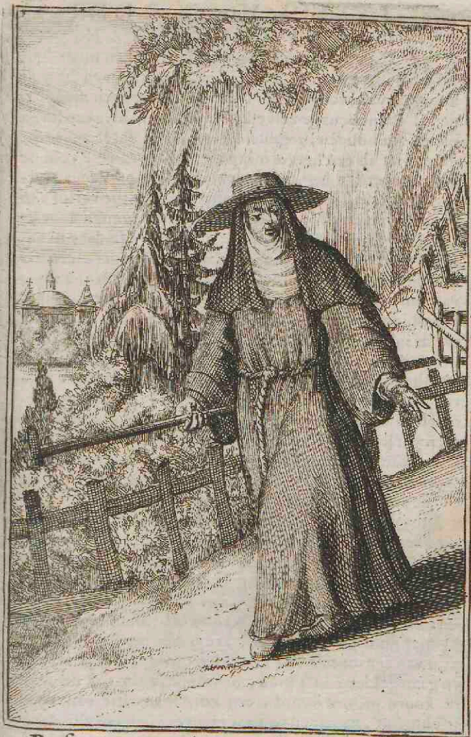
Reformatā trium Ordinum S t i Francisci