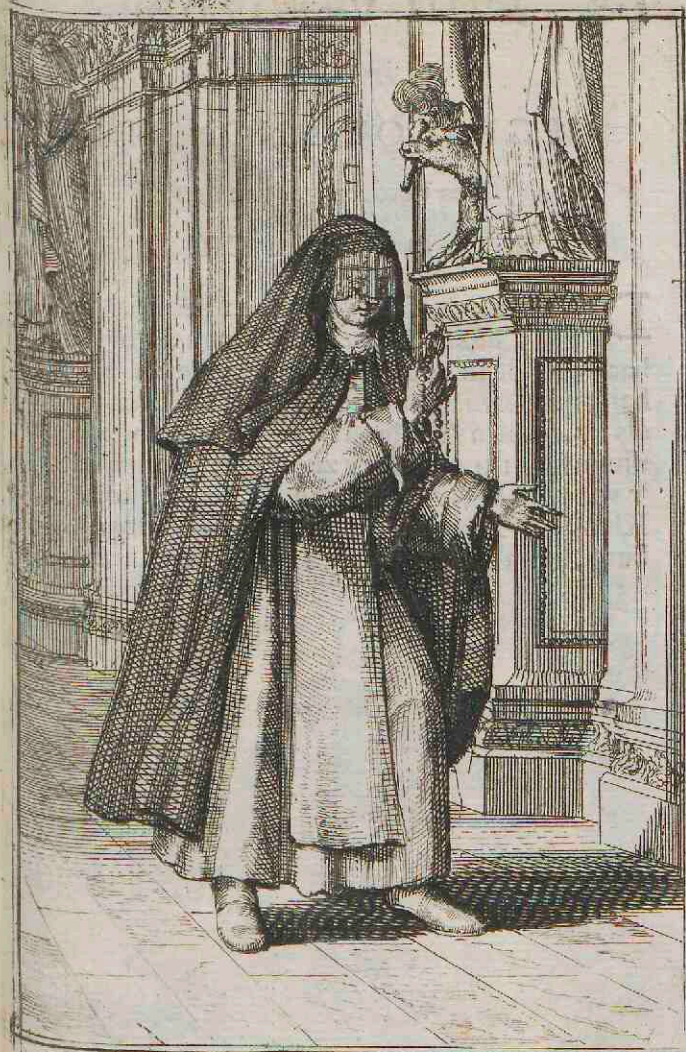
Monialis secundi ordinis S t i Domini.