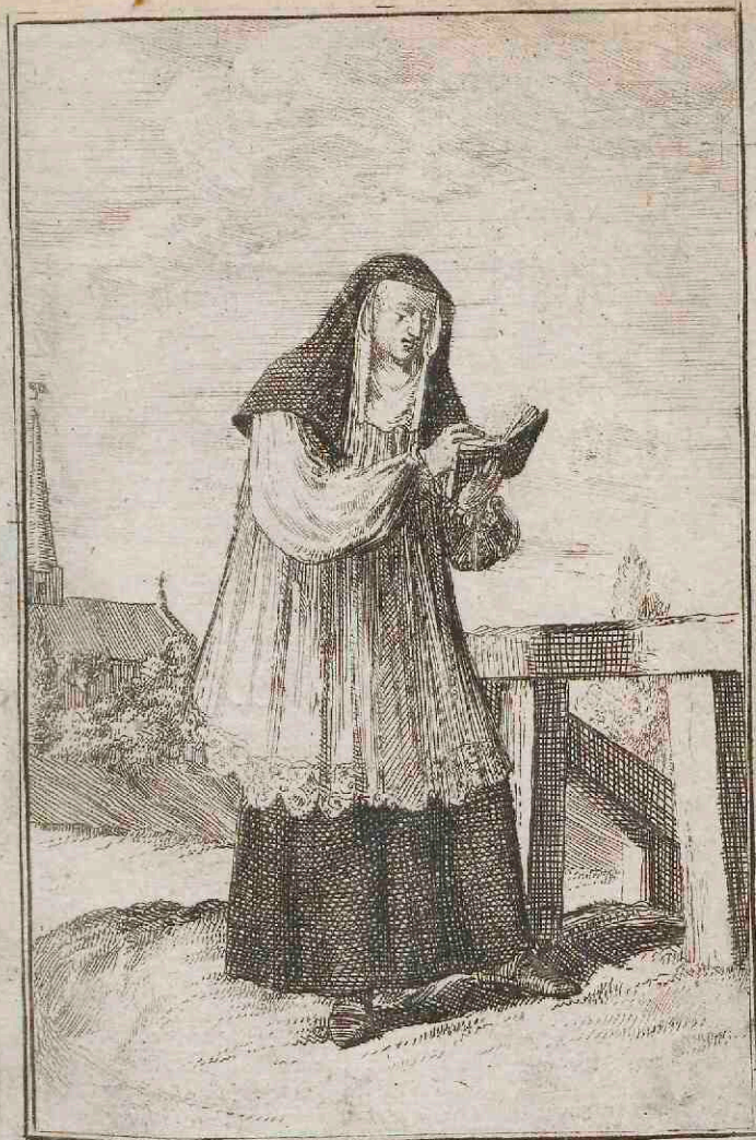
Canonissa Hodierna, Montis in Hannonia.

D Eze zijn nu van de vorige beloften afgeweken, te weten, de belofte van eeuwige zuiverheit, alzooy 's morgensgeestelijk zijn, en de diensten waernemen als de Nonnen; en 's namiddags wereltlijk; zy mogen ook trouwen als 't haer goetdunkt, zonder vermindering van haar agting, en bestaen al t'zamen uyt de grootste, en edelste Juffers van 't lant, in swarte onderrokken gekleet, met een witte linne rok daer over, en de swarte wiel op 't hoofd. Men vintze ook van deze zelve kleeding te Nivelles.