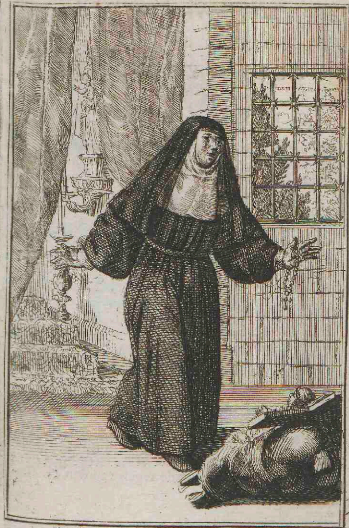
Congregata B. Mariæ Virginis.