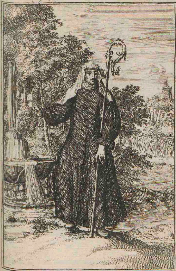
Abbatissa fontis Ebraldi.