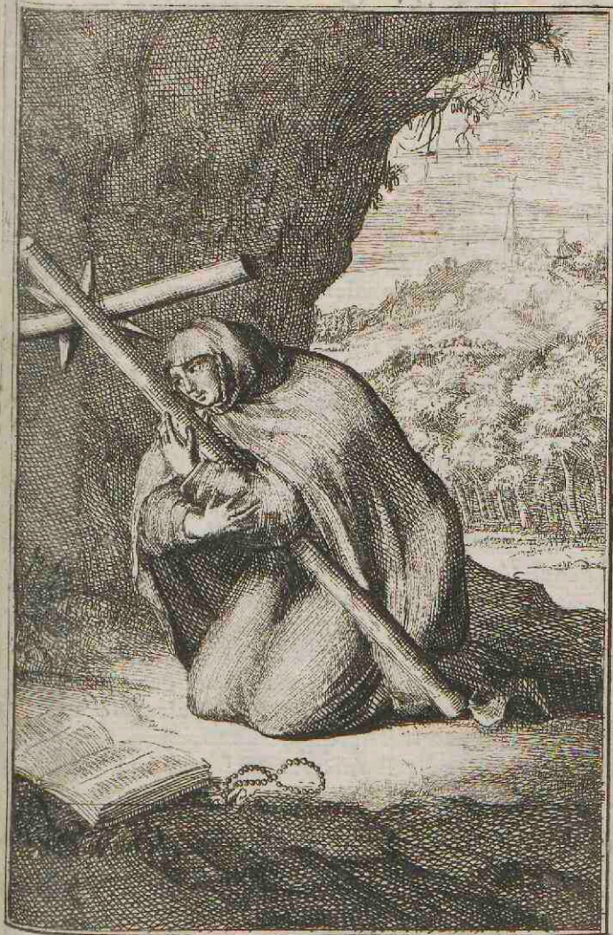
Monialis St i Isidori.

D E H. Florentina, van Gotze afkomst, in Spanjen geboren, was de zuster van den H. Leander en den H. Isidorus, Bisschoppen van Sicilien. Zy sichte een Order voor Vrouwen, ontrent het jaar 598, volgens de regels die haar broeder den H. Isidorus, in zijn twee boeken van de Maagdelyken staat, haar voorgeschreven had. Zy gingen in 't lecus-graau gekleed.