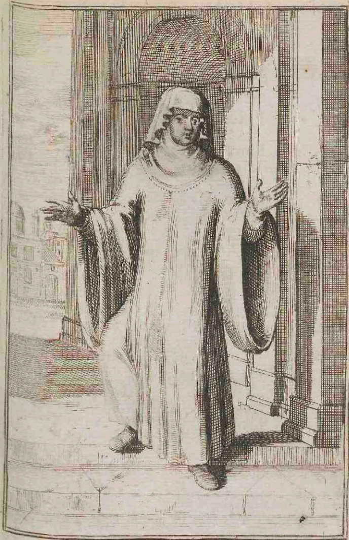
Monialis S ti Columbani.

N A dat den H. Columbanus, een Yer van geboorte, in Vrankrijk veel weder-waardigheden geleden had, wiert daar na van de Koningen Guntran en Childebert beter onthaald, die hem verlof en macht gaven om Kloosters op te rechten, gelijk hy ook vervolgens het zeer vermaarde Klooster van Luxeu, in 't gebergte van Vosge, stichtede, waar door zijn naam in Vrankrijk zco vermaard wierd, dat zeer veel aanzienlijke lieden tot hem kwamen, en daar door zijn vergaderingen in korten tijd zeer aangroeyde. Het Concilie te Mascon, gehouden in 't jaar 627, verdedigde zijn leere en regels tegen den Monik Agrestinus, die dezelve wilde wraken, 't geen hem aanstonts in zeer groote achting bracht, en zijn Order door gantsch Vrankrijk en Italien deed verspreyden. De Nonnen door hem ingestelt, hebben haar begin gekregen door de zuster van den Bisschop Faron, Faro, of Burgundo Fare genoemd, die 't Klooster te Faremonstier stichte, ontrent het jaar 615, zy waren in 't wit gekleed, en den regel van den H. Benedictus onderhoorig.