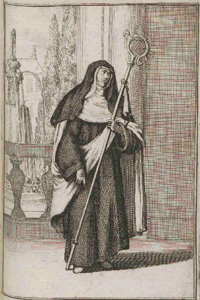
Abbatiffa Reformata fontis Ebraldi