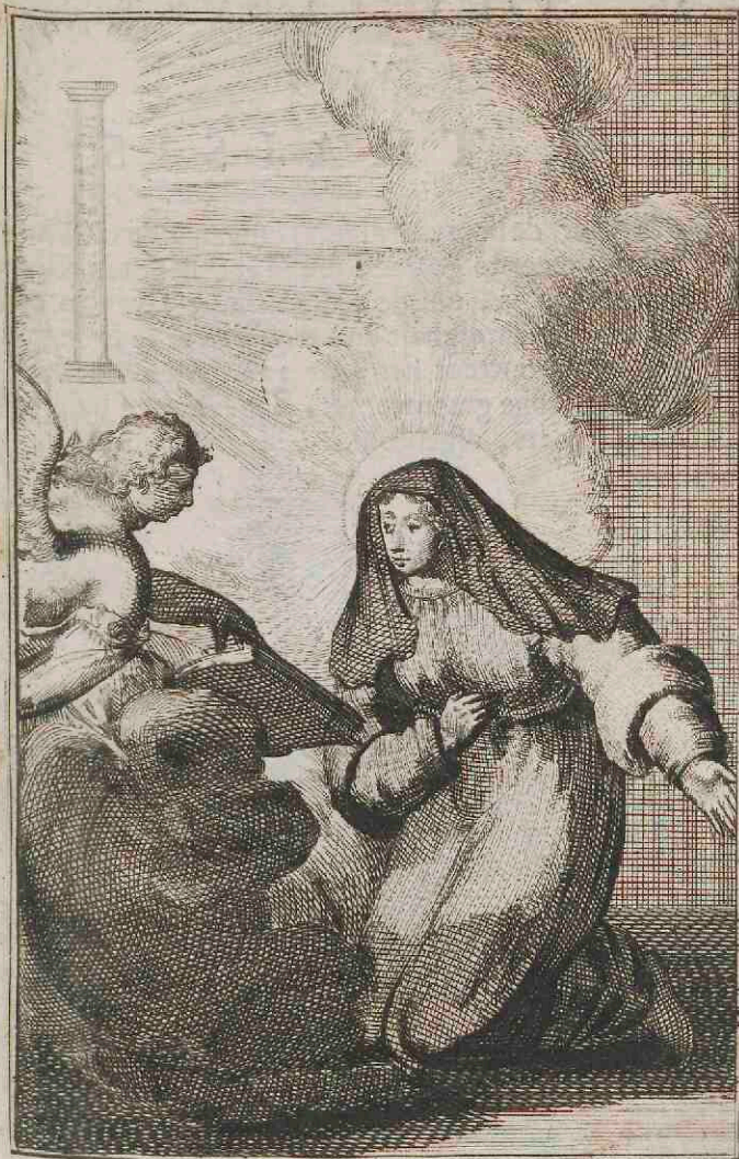
S ta Basilissa Antiochena mille Monialium priora mater