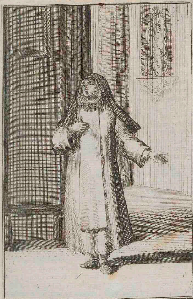
Monialis Regularis Dordracena S tae Agnetis.