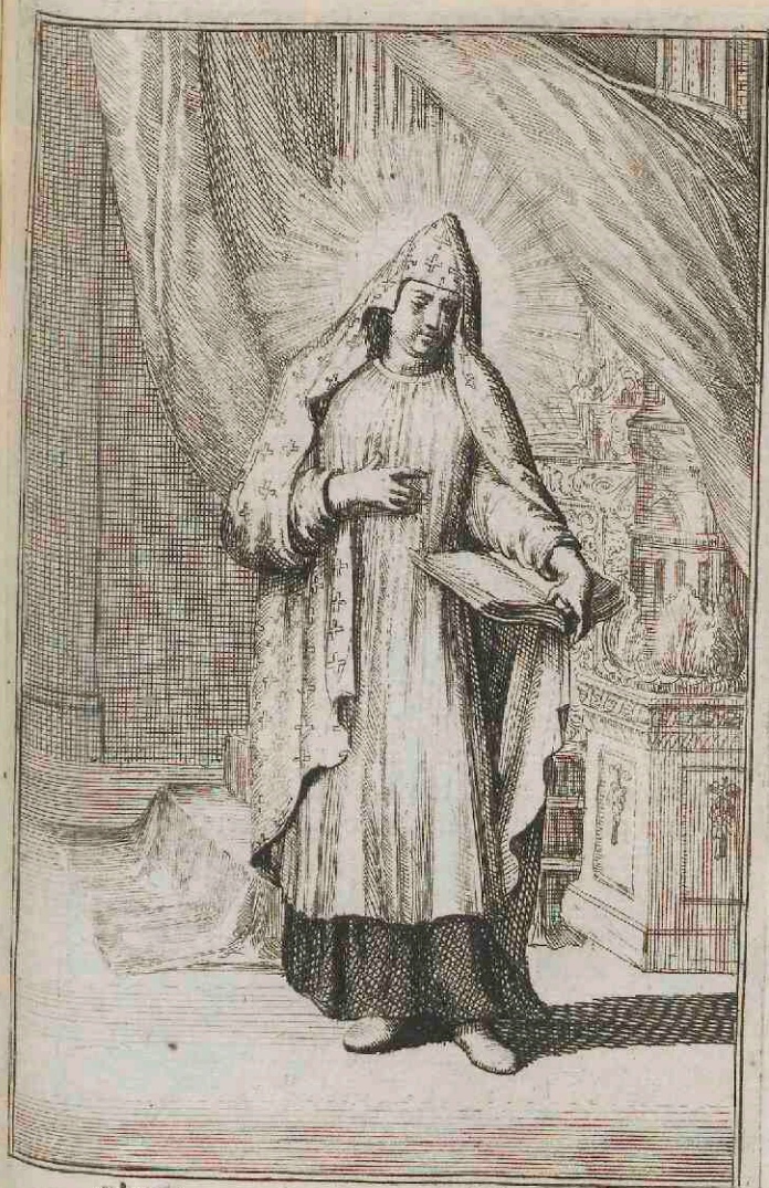
Sta Perpetua Soror S ti Augustini.

M En verzekerd dat den H. Augustinus de geestelijke Orders hervormende, mede de vrouwen en dochters lessen voorschreef, en kloosterwoninge stichte, op 't verzoek van zijn zuster de H. Perpetua, die gehouden word voor de moeder en grondlegster van alle Nonnen, en Orders, die onder den regel van haar broeder zijn, alhoewel 'er tegenwoordig geen zusterschap meer gevonden word, die regelrecht zoude kunnen rekenen van haar instelling af te dalen, maar al te zamen van andere hervormingen haar begin en naam te hebben, als by de volgende zal blijken. De H. Perpetua leefde ontrent het jaar 390, wanneer zy haar instellinge begon, en men vind haar afgebeeld in een swarte onder en witte linne overrok, met een witte huyk van 't hoofd tot de voeten toe afhanginge, die vol roo kruysjes gestikt is.