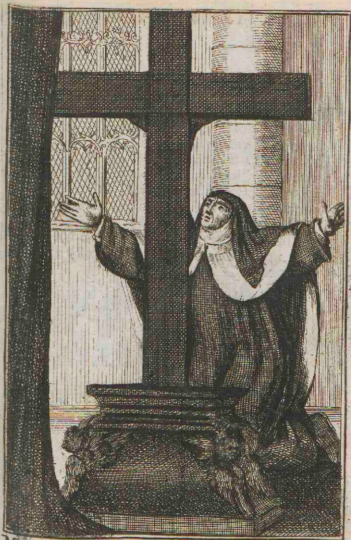
Monialis Observans Regulas Episcoporum.