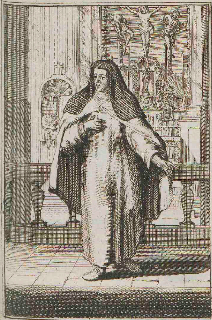
Benedictina Montis Calvariae.