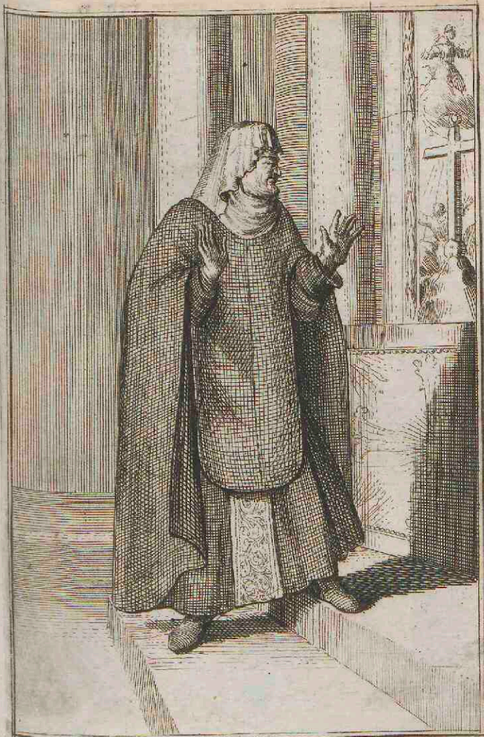
Monialis S ni . Basili.

M En vind de H. Macrina, zuster van den grooten Basilius, in 't swart byna Priesterlijk gewaad, zeer veel trekkende na de gedaante eens Cassuffels, mogelijk darze ook eenige bediening der Priesters waargenomen hebben, nademaal hy haar op meer als een plaats Sacerdotes noemt, dat cygentlijk die geen betekende. die eenige heylige of gewijde dingen uytgaven. Zy wonderlijker wyze van een kanker in de borst genezen zijnde, begaf haar op 't voorbeeld haars broeders, en volgens zyn regels, tot het oprechten van kloosters, en 't vergaderen van geestelijke dochters, die byzonderlijk belofte van zuiverheid en armoede deden. Zy leefden zeer streng, want droegen noyt hemd, sliepen op stro, en aten nimmer vleesch, houdende schier een geduurige vasten.