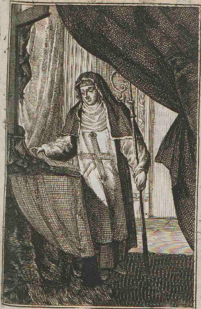
Monialis ordinis Equestris de Calatrava & Alcantara.