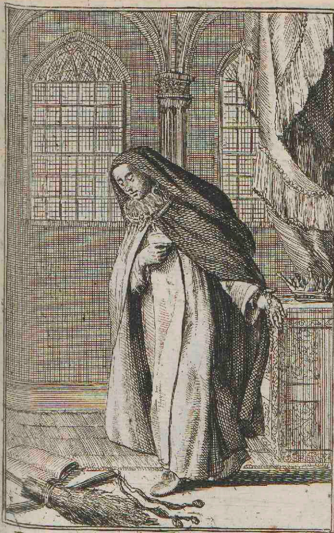
Penitens tertii Ordinis S ti . Dominici