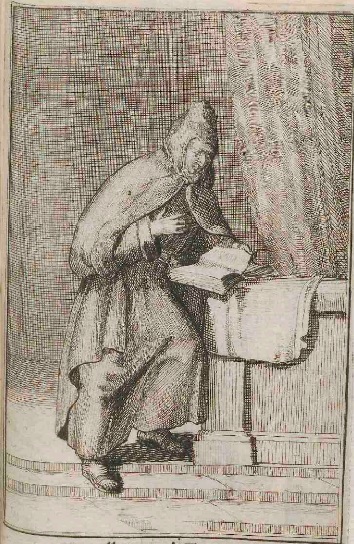
Recolleta S t . Fructuosi.