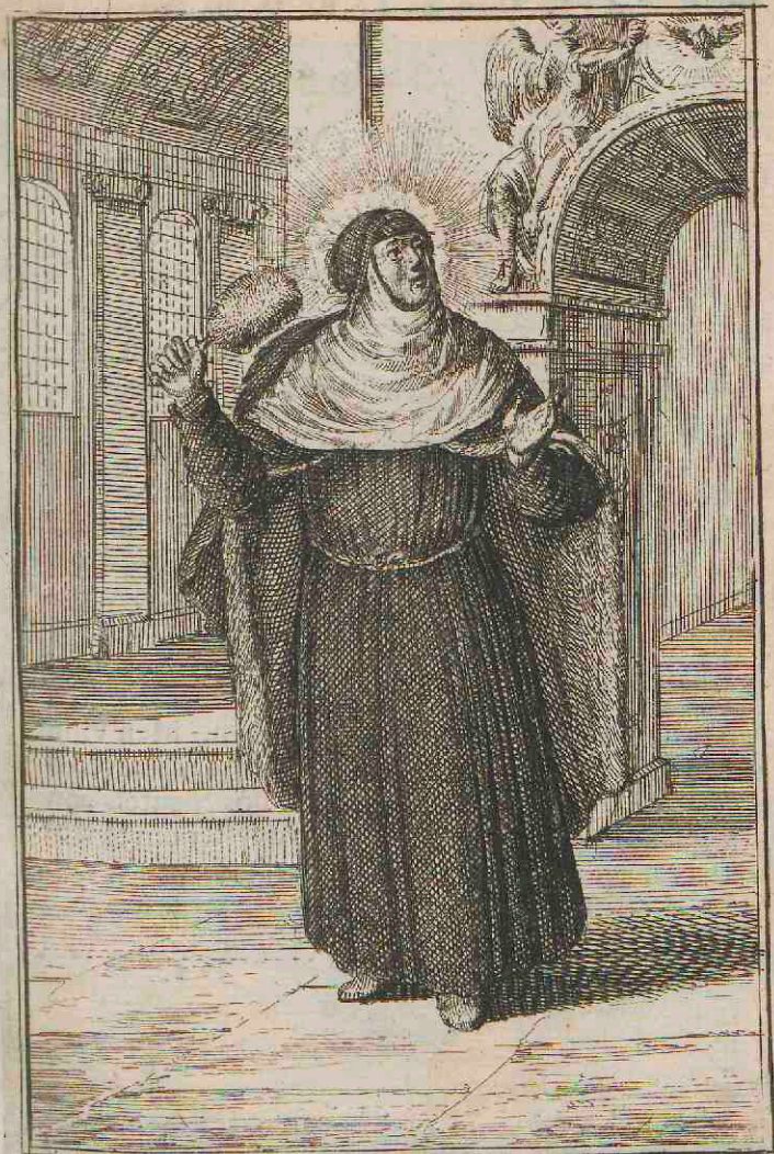
S ta . Martha vitæ Cœnobiticæ, & Clericorum Hospitalarium patrona.

DEZE met haar Broeder Lazarus en zufter Maria Magdalena mede te Marfeille aangekomen zijnde, word van veel Schrijvers als de Inftelfter van de Herberglyke Order van den H. Geest aangemerkt, alhoewel veel dit wat te duyster achten om vast te ftellen; althans 't is zeker dat zy van die zelve Order de Patronerffe is. Zy leefde tot Marfeille in een Klooster met veel andere Dochters, tot op den 29 July des Jaers 84. wanneer zy fturf. Deze nevenftaande Afbeelding is gelijk met die op 't graf noch te zien is, maar de kleuren zyn onzeker, nochtans is, om dat die van d'Order van den H. Geest meeft in 't fwart gekleed gaan, 't fwart verkozen. De Order der Gafthuys-meesters en Nonnen, die haar voor haar Patroon achten, zyn door Italien, Vrankrijk, Duytsland, en meer Landen, in de volgende tijden zeer uytgespreid, en met voorrechten van verfcheyde Pauzen bevestigd.