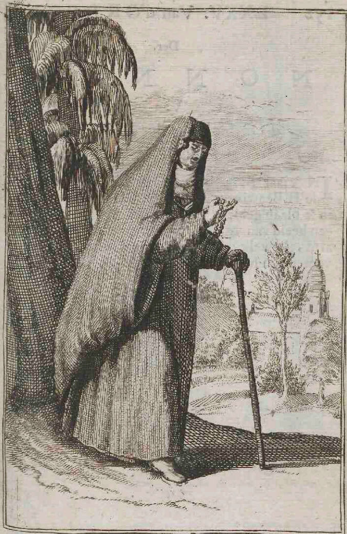
Virgo Collegii Cæsar Augustæ.