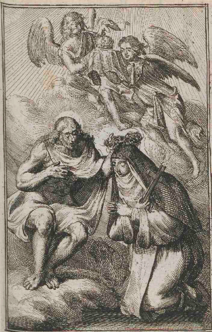
Monialis Clausa tertii Ordinis S ti . Dominici.

DE H. Catharina van Senen heeft in 't jaar 1368, deze Order veel strengheid bygezet, haar doende in groote stilswijgendheid, zuyverheid, gehoorzaamheid, en opgesloten leven, want als zy eens in 't Klooster gaan, mogen zy daar nimmer uyt komen; zy zijn als de voorgaande in 't wit gekleed, en hebben in Italiën veel kostelyke Kloosters. Men vindze ook te Neurenburg, Augsbürg, en in Nederland op verscheide plaatsen,