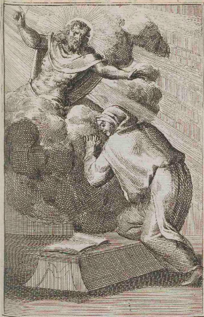
Monialis S u . Gregorii.

IN 't jaar 594 heeft Paus Gregorius de Groote in Sicilien verscheide Kloosters geboud, waar onder mede van Vrouwen zijn geweest, over welke hy zijn Moeye, de H. Tharilla heeft gestelt, en met overvloedige inkomsten uyt zijn eygen goederen voorzien; gaan gekleed gantsch in 't wit, en behorende onder den regel van den H. Benedictus. Zy leefden volgens des Paus instellingen zeer streng en ingetogen.