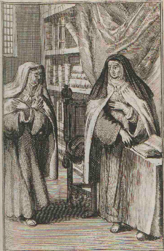
Discalceatarum mater & soror Carmelitarum.

d'ORDER van de H. Theresia had in Spanjen en Portugael, als mede in Italien, zeer grooten voortgang, en wierden van alle regeringen begunstigd, zoo dat haar Kloosters in getal en inkomsten byzonder aangroeyde, als wanneer twee dochters, de eerwaardige moeder Anna de Jesu, een Spaansche, en zuster Maria del'Incarnation, een Fransse van geboorte, de zelve in Vrankrijk overgebracht en opgerecht hebben, in 't jaar 1604 en zijn die geen die men in de Nederlanden vindt, mede uyt deze instelling gesproten, en de Keulze, hebben van die uyt 's Hertogenbosch gejaagt wierden, 't begin genomen. Zy zyn byna als d'aaloude Karmeliten gekleed, uytgenomen datze blootvoets gaan, en de mantel vry wat korter dragen, voor de rest is de kleur even eens. De moeders dragen de swarte wiel, en de zusters de witte huyven.