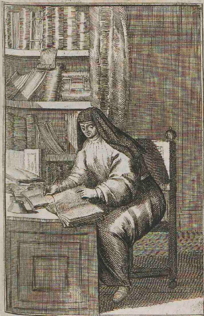
Monialis S ti . Cæsarii.

Den H. Cæsarius vertrok zich in zijn jonge tyd in 't Klooster van Lerins, door den H. Honorarius gebouwd; naderhand Abt en Aartsbisschop van Arles geworden zijnde, wierd hy valschelyk by Koning Alarik beschuldigd, en na Bourdeaux in ballingschap gezonden, maar eenigen tijd daar na zyn onschuld blijkende, wierd hy wederom geroepen, en boude verscheyde Kloosters, waar onder een was voor Vrouwen, dicht by de Kerk, daer hy zyn zuster, de H. Cæsaria, instelde tot Abdissc, krigende in korten tijd een groote toeloop van voorname dochters, die haar onder zyn Klooster-wetten begaven; maar een nieu ongemak dwong hem zyn Aartsbisdom te verlaten, en zich te gaan ontschuldigen voor Theodorik, Koning van Ravenne; dat gedaan zijnde, reysde hy na Romen, en wierd door den Paus Symmachus in zyn Aartsbisdom, nevens zyn instelling, in 't jaar 478, bevestigd. De Nonnen van zyn Order zyn gewielt, en dragen een witte rok om 't lijf gegord.