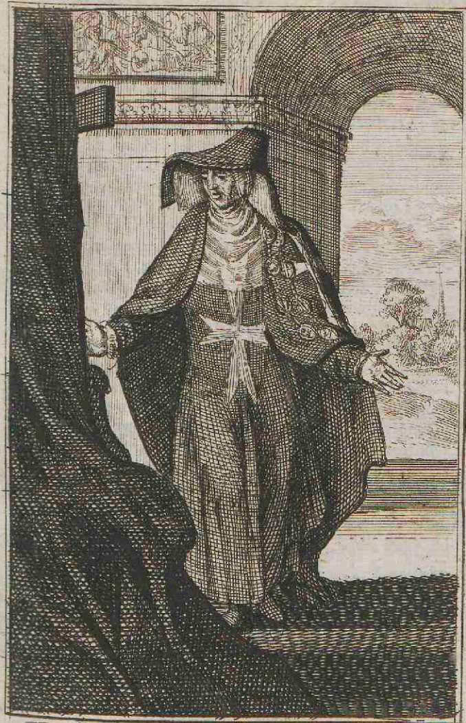
Hospitalaria Reformata S ti Ioannis Hierosolymitani.