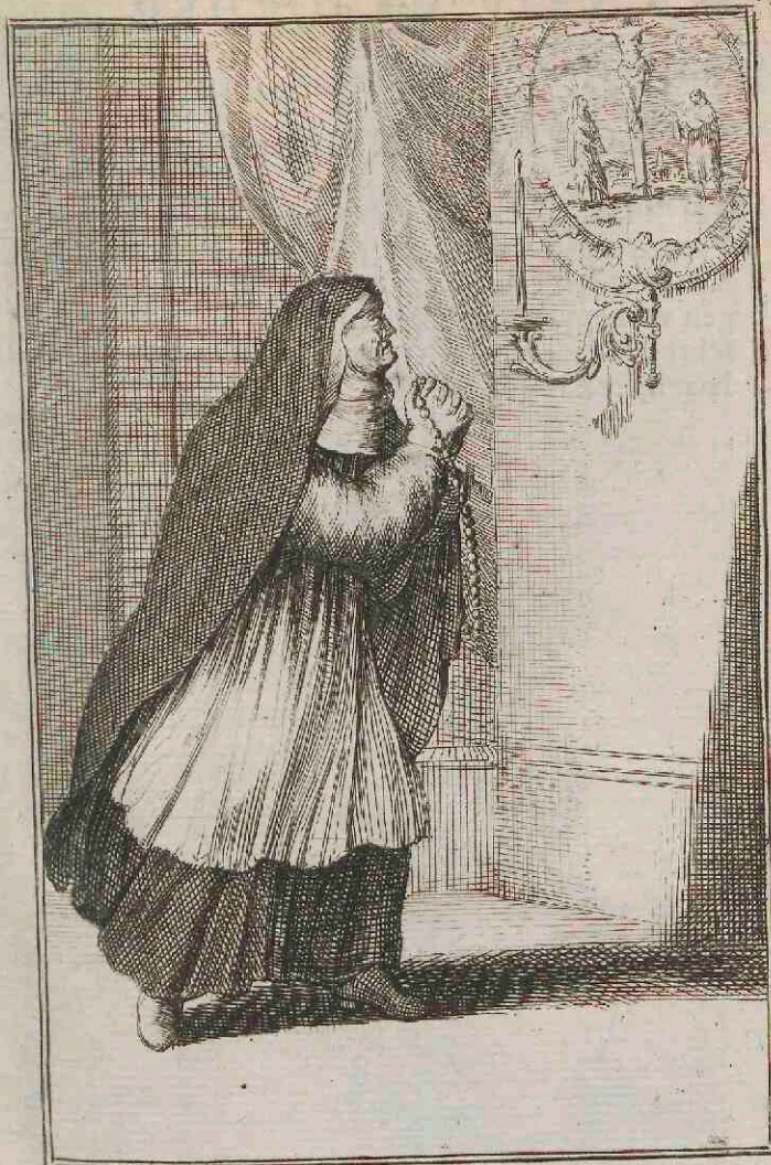
Matrona Congregationis doctrinae Christianaë.

Onder veel Kloosters door den H. Carolus Borromeus, Cardinaal en Aarts-Bisschop van Milaan, gesticht, is mede een vergadering of school der Kristelijke Leere, zoo wel van mannen ale vrouwen, ontrent het jaar 1568, aangestelt, welkers plicht is de kinderen in 't geloof te onderwijzen en te oefenen. De Vrouwen gaan in 't swart gekleed, met een linnen overrok, hebbende dan noch een huik of mantel, van 't hoofd af tot de voeten toe. Zy leven na den regel van den H. Augustijn.