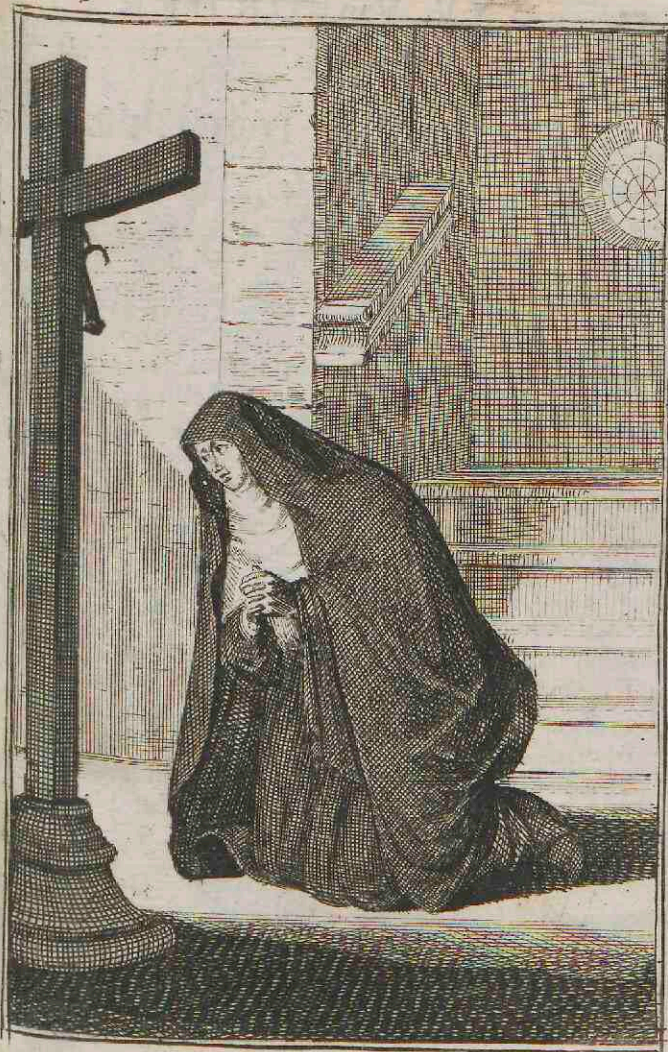
Mulier congregationis mediolanensis

IN 't Jaar 1574. is door den H. Carolus Borromeus een Vergadering van Vrouwen te Milaan ingestelt, aan de welken hy Klooster-woningen verzorgde, en regels om na te leven voorschreef. Zy gaan in 't swart laken gekleed, en haar lijfrok is gegord.