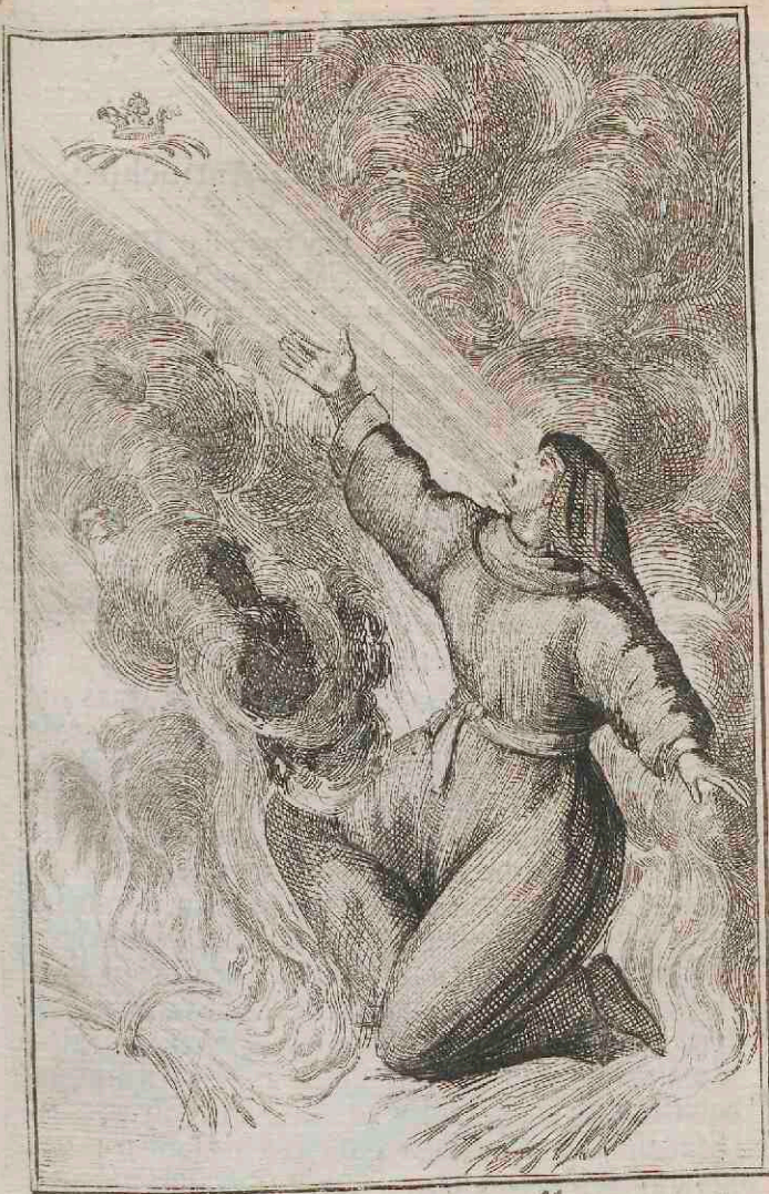
St a Flavia Domitilla.