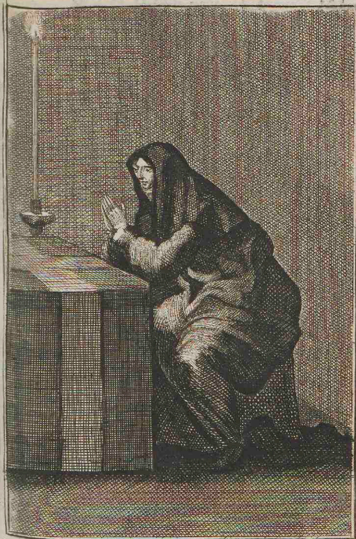
Momialis St i Ambrosii.

D Ees Order is mede een tak van de Benedicti- nen, en zy worden in 't Milanees genaamd Dochters van den H. Ambrosius. Men zegd datze ingesteld zijn lang voor dat den H. Benedictus het Klooster op den Berg Kassyn inwilde, en de Kloos- ter-tucht herstelde; maar 't is zeker datze nader- hand onder zijn regels en instellinge geschikt zijn, en nu eygentlijk onder de Cisterciensen behoren. Zy dragen de swarte wiel op 't hoofd, en de rest van haar klederen zijn wit, alhoewel den H. Am- brosius graauwe klederen ingestelt heeft; en 't is ook wel te gelooven darze t'zijner tijd graauw ge- kleed zijn geweest; Hy zelve maakt gewag van Mauritaanze Meysjes door hem zelfs gewield, on- der de H. Marcellina, in 't jaar 360.