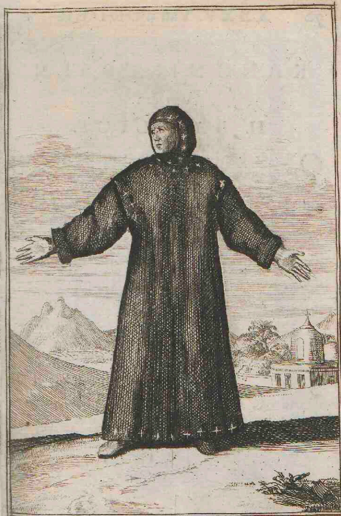
Monialis Insulæ Tabennis.