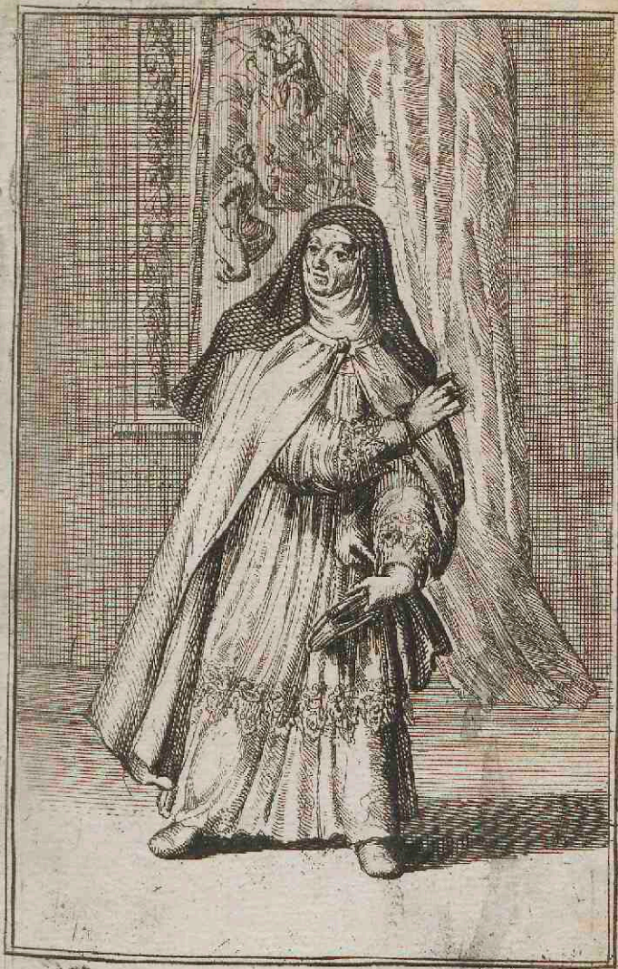
Canonissa Sti. Johannis Lateranensis.

D Eze Kanonikessen vind men te Romen, in de Kerk van St. Jan te Lateraan, en gaan gekleed gantsch in 't wit. Zy dragen een rok en mantel, een linnen overrok, en de zwarte wiel. Men meynt datze zeer oud zyn, zelfs van de Apostelen tyden af. Paus Gelafius, Leerling van den grooten Augustinus, heeft ze onder desselfs regel gebracht, in 't jaar 440. Alexander II. heeft haar Order goed gekeurt in 't jaar 1060. Paus Bonifacius VIII. heeftze uyt haar bezit gejaagt, ter oorzaak van eenige ingeslovene misbruyken, maar zy zyn door Eugenius IV. wederom herstelt in 't jaar 1445, en hebben zeder, tot tegenwoordig toe, gerust haar inkomen en bezit genoten. 't Merk van d'Order is de Maagd Maria, zittende met het kindje Jesus op haar schoot, St. Jan te rechter, en den H. Augustinus ter linkerhand, met deze woorden: domine auferatur luna , tot dat de mane weg genomen word.