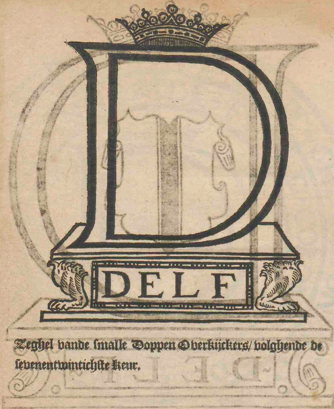
Zeghel vande smalle Doppen Overkijckers/ volghende de sevenentwintichste keur.