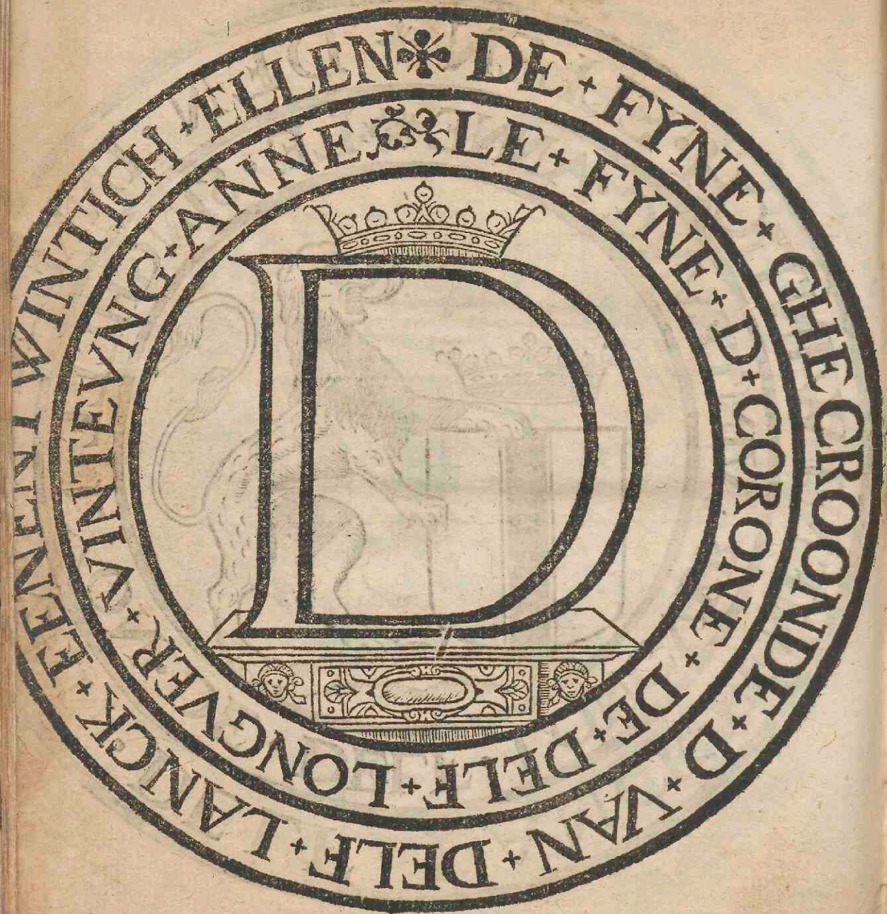
Afdrukkel vande pack-papieren vande D saep-fustepnen / volghende de sevenentwintichste keur.