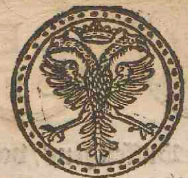
Eerste zeghel tot de Weselsche vierſchachten/ diemen noemt Buffeltgens of Bombalijnen / volghende de ze- venentwintichste keur.

Zeghel vande smalle Doppen Overkijckers/ volghende de sevenentwintichste keur.