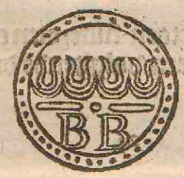
Tweede zeghel tot de Weselsche vierſchachten/ diemen noemt Buffeltgens of Bombalijnen / volghende de ze- venentwintichste keur.