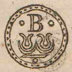
Derde zeghel tot de Weselsche vierſchachten/ diemen noemt Buffeltgens of Bombalijnen / volghende de ze- venentwintichste keur.