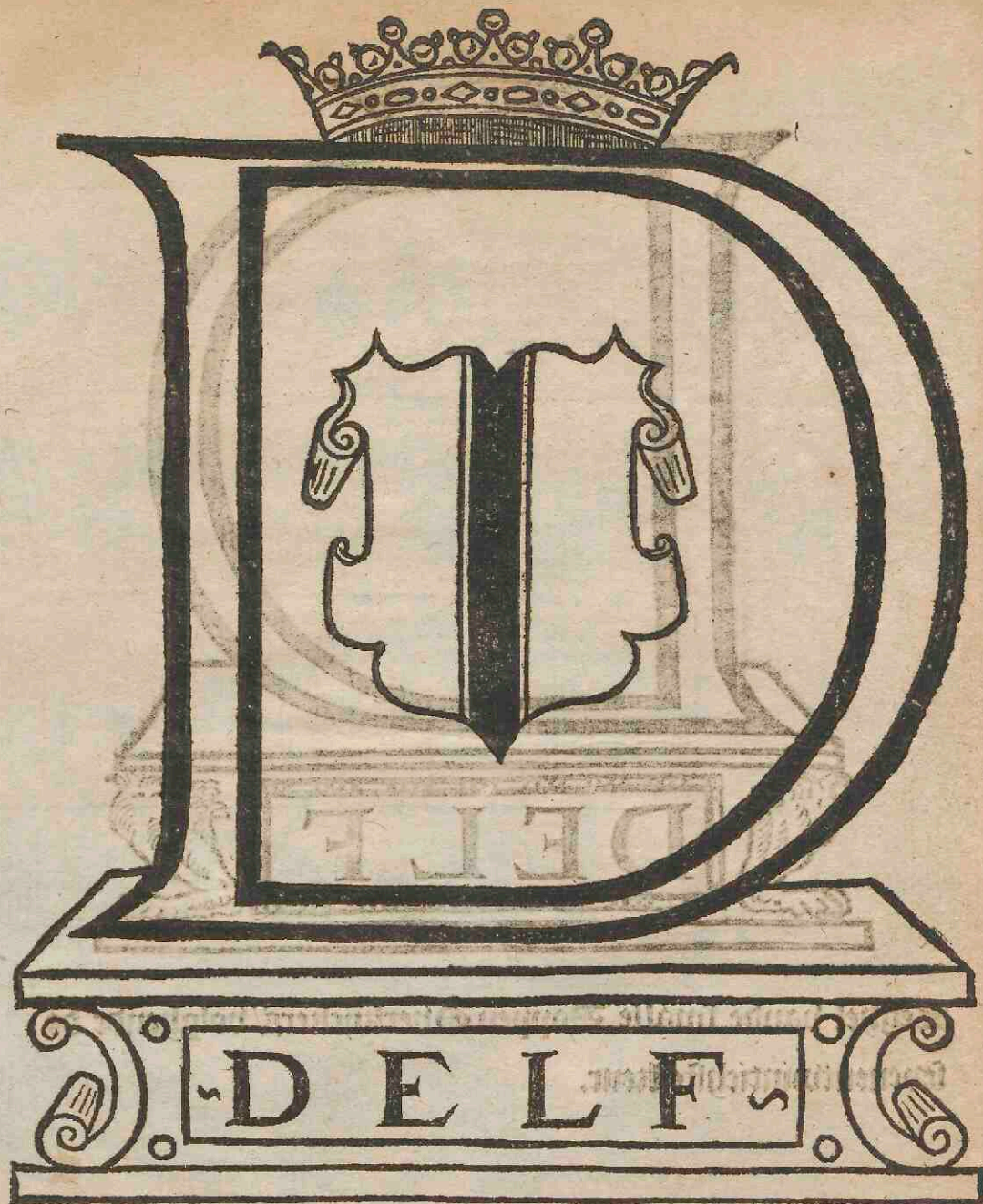
Zeghel vande breede Doppen Overkijckers / volghende de lebenentwintichste keur.