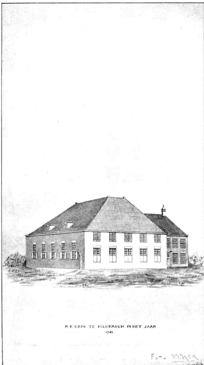
R. K. KERK TE HILVERSUM IN HET JAAR 1740