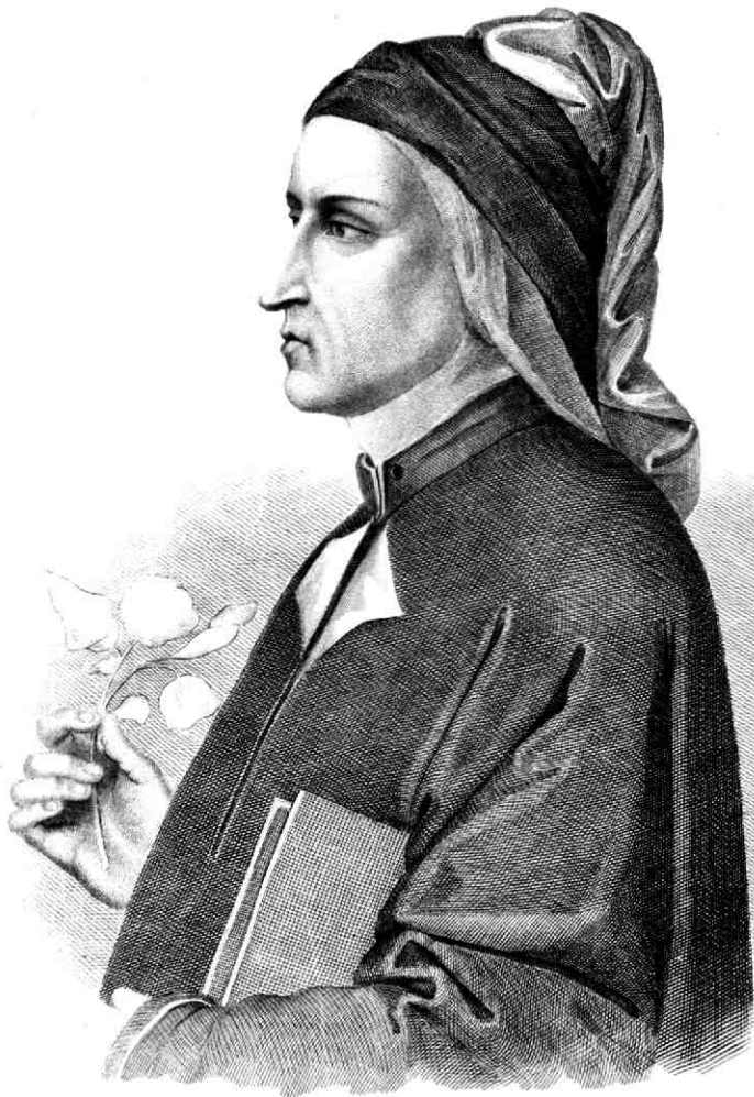
Gemälde von Giotto.