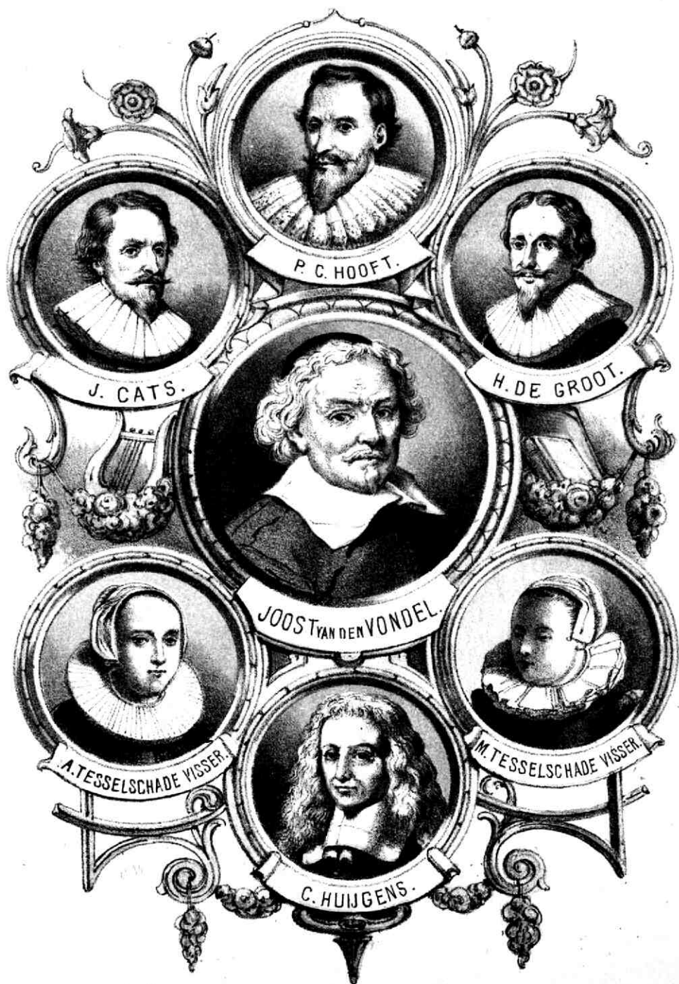
P. C. HOOFT.