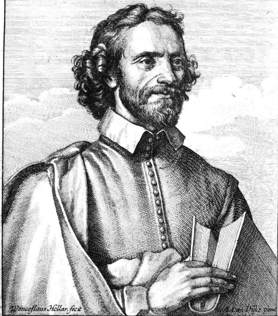
FRANCISCVS IUNIVS F.F. Dits IUNIVS, Der Schilders Rechte hant, Zijn Bloet is Eel, Noch Eeler Zijn Verstant. I.V. Vondelen