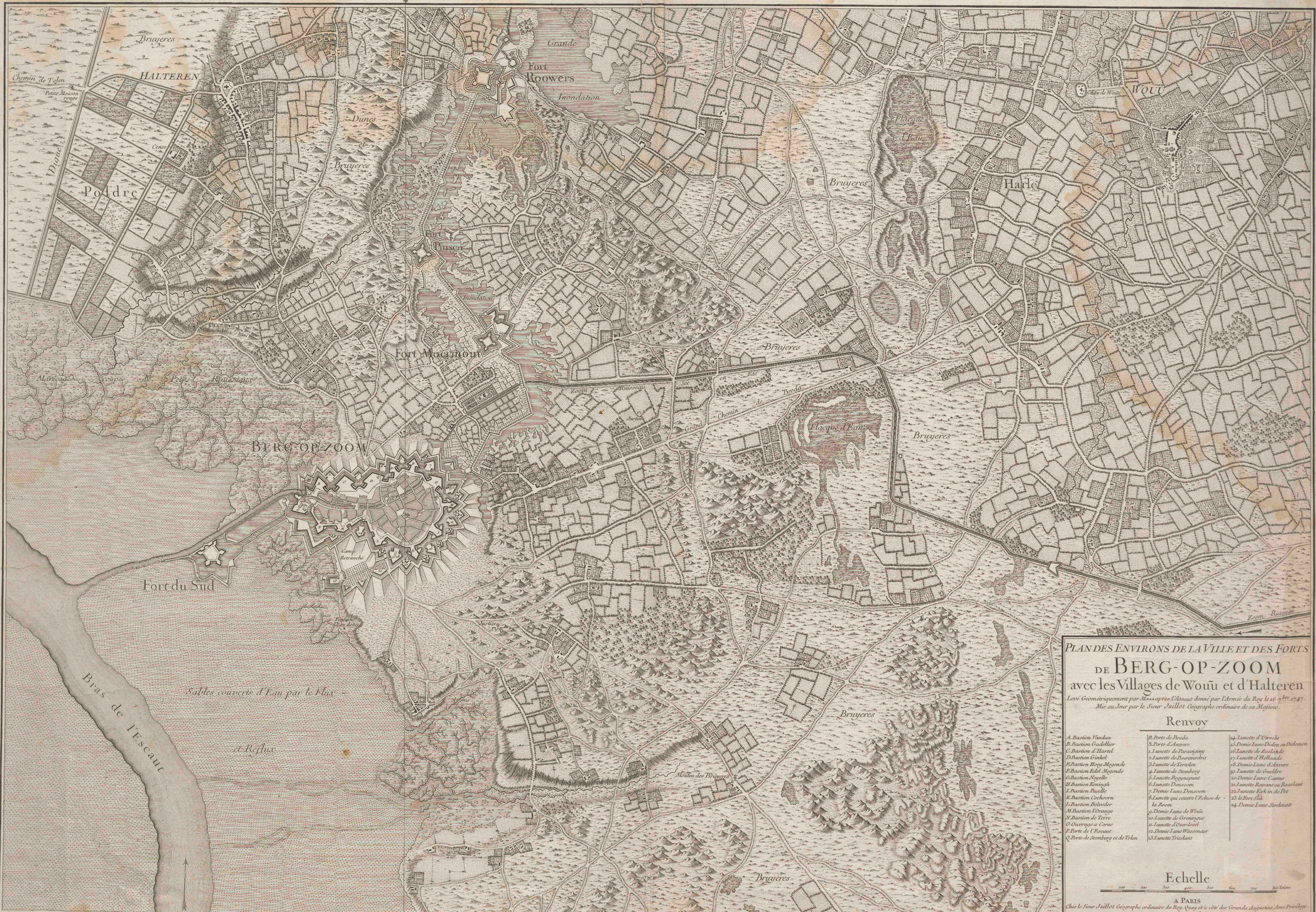
PLAN DES ENVIRONS DE LA VILLE ET DES FORS DE BERG-OP-ZOOM avec les Villages de Wouu et d'Halteren Levé Géométriquement par M... après l'Assaut donné par l'Armée du Roy le 16 7 bre 1747. Mis au Jour par le Sieur Jaillot Géographe ordinaire de sa Majesté.