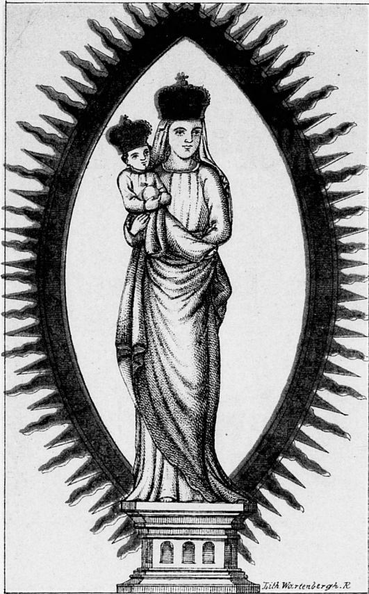
Oud Miraculeus Beeld van Onze Lieve Vrouw in de Parochiekerk te Sittard.