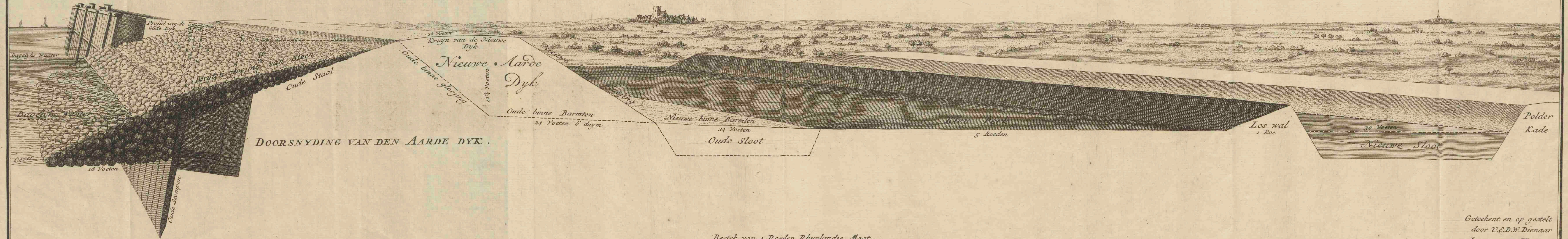
DOORSNYDING VAN DEN AARDE DYK.

PROJECT van den Zee-dyk beoosten Muyden soo als deselve soude kunne werden met Steen versterkt.