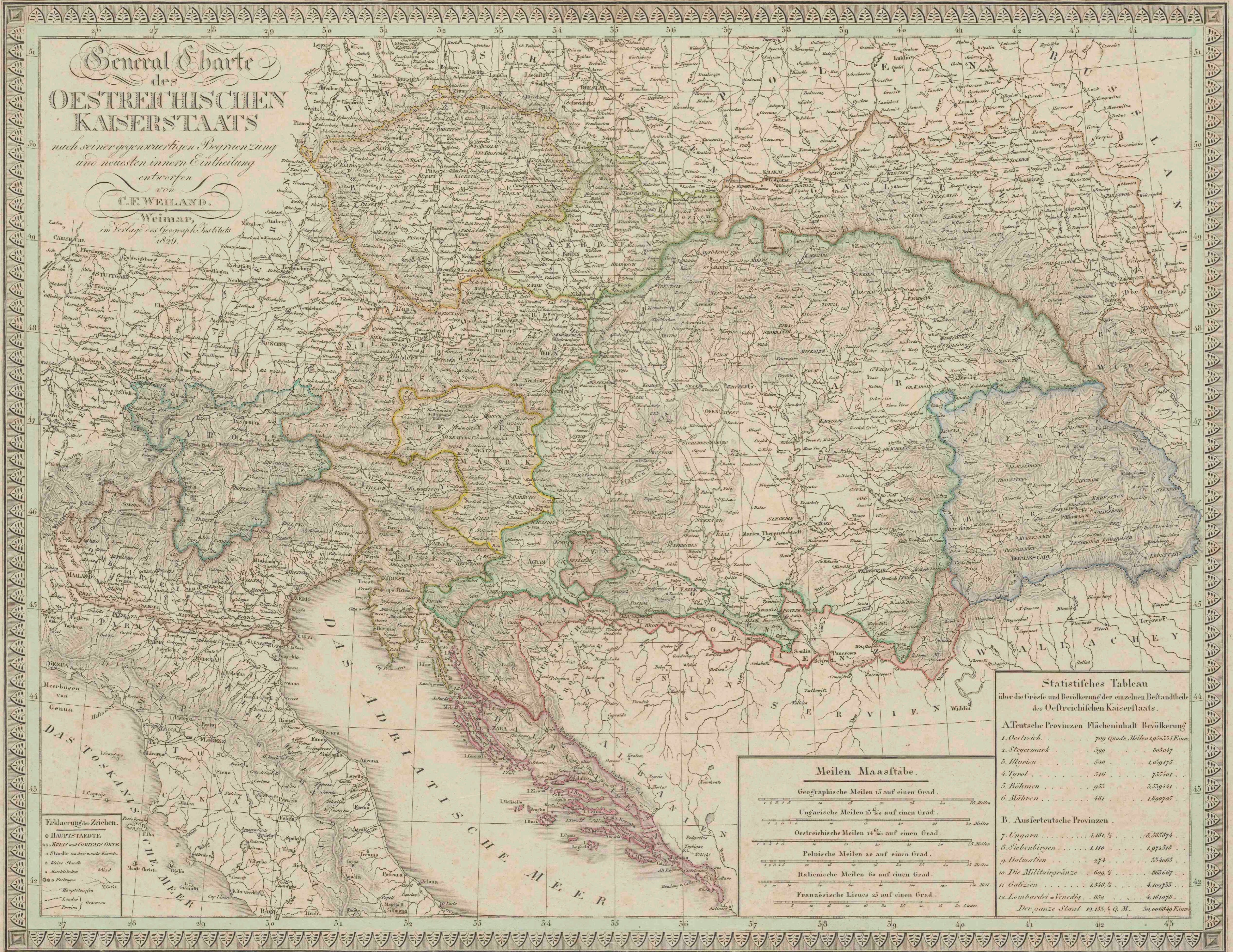
Statistisches Tableau über die Größe und Bevölkerung der einzelnen Bestandtheile des Oestreichischen Kaiserstaats.

im Verlage des Geograph. Instituts 1829.