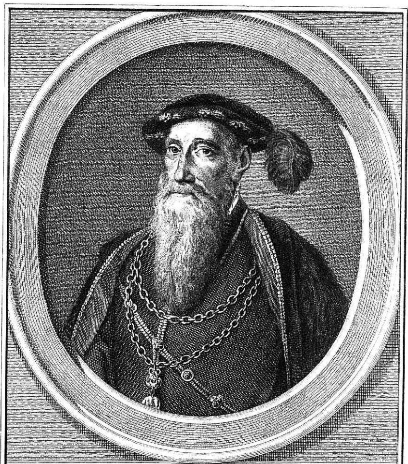
REINOUD DE III VAN BREDERODE, uit de Graven van Holland, Ridder van 't Gulden-Vlies. enz.