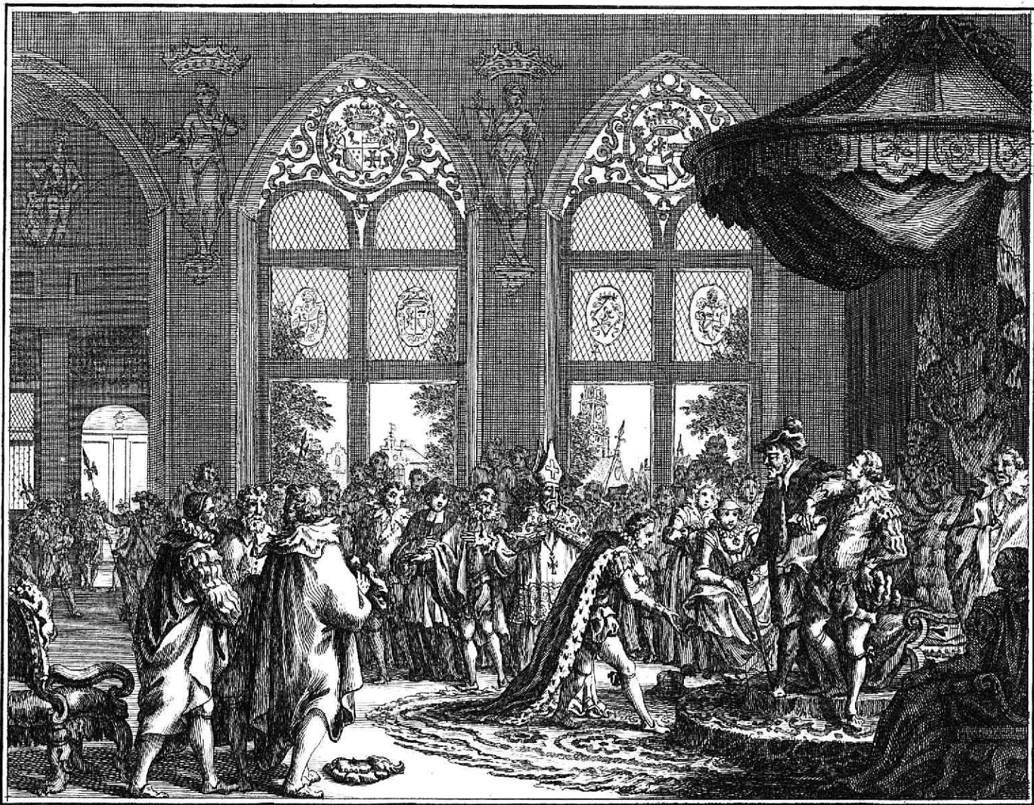
Overdragt der Nederlanden, door Keizer KAREL den V. aan zynen zoon, FILIPPS, in 't jaar 1555.