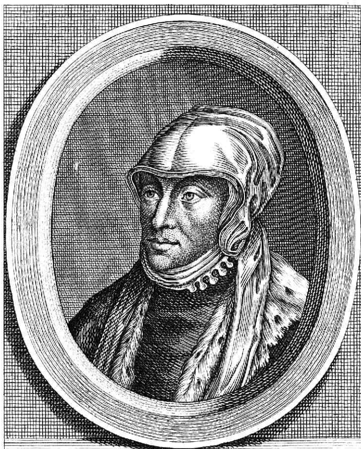
MARIA VAN OOSTENRYK Douariere van Hongaryen. Gouvernante der Nederlanden. Zuster des Keyzers KAREL de V. GESTORVEN, DEN 18 OCTOBER M D LVIII.