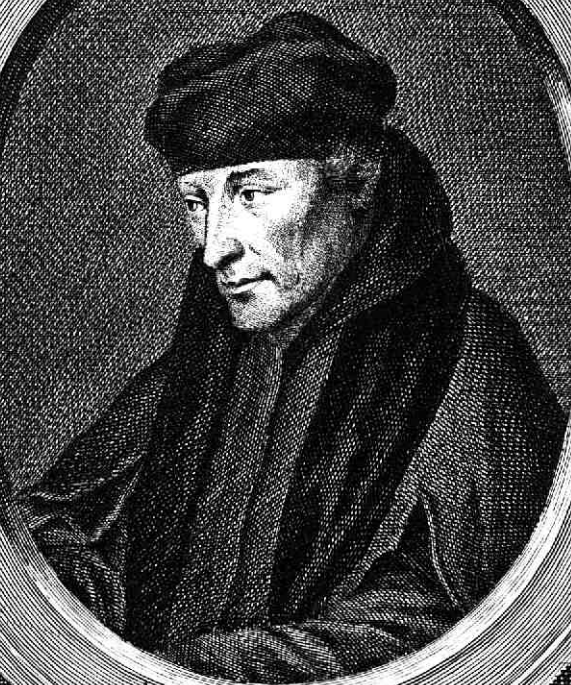
DESIDERIUS ERASMUS, geboorente Rotterdam, int jaar 1467 overleedente Bazel, int jaar 1536.