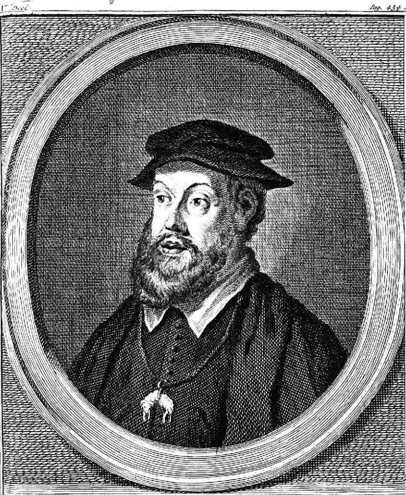
CAREL DE VYFFDE, Roomsch Keyfer.