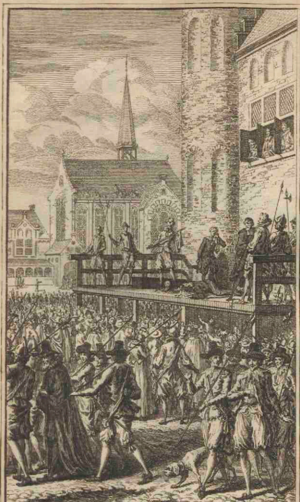
het Rechtsgeding van Joen van Oldenbarneveldt &c.