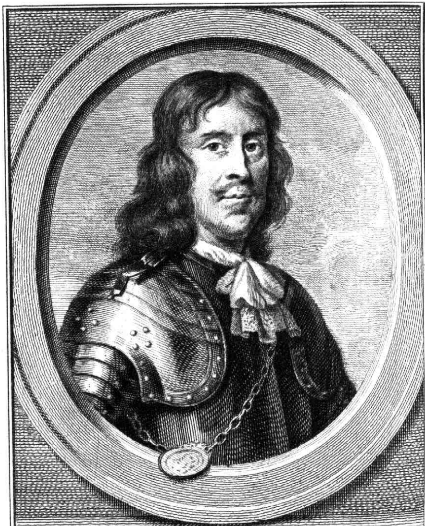
KORNELIS EVERTSEN, Luitenant-Admiraal van Zeeland: