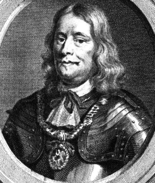
JAN EVERTSEN, Luitenant-Admiraal van Zeeland.