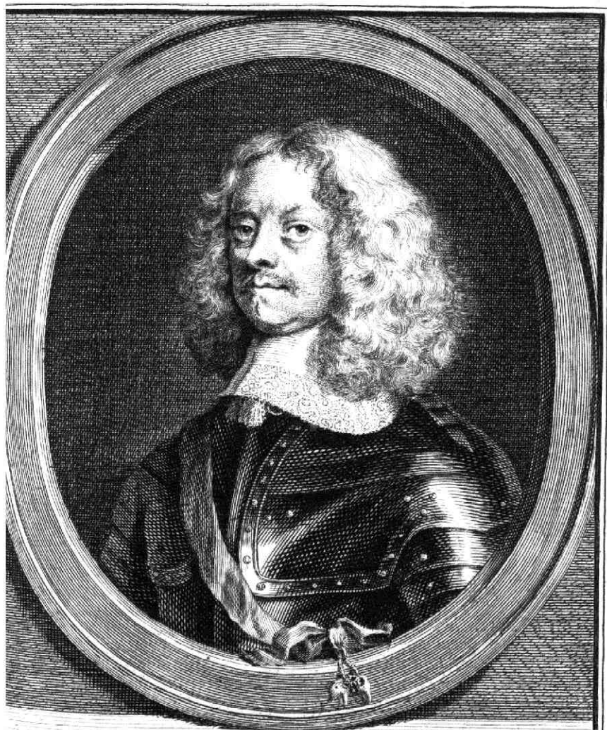
JACOB, BAANDER-HEER VAN EN TOT WASSENAER, Heer van Obdam enz. Luitenant-Admiraal-Generaal der Vereenigde Nederlanden, enz.