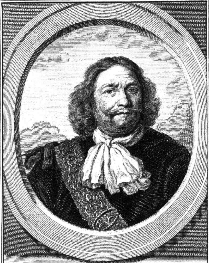
EGBERT MEELUWSZON KORTENAAR. Luitenant-Admiraal van Holland en Westfriesland.