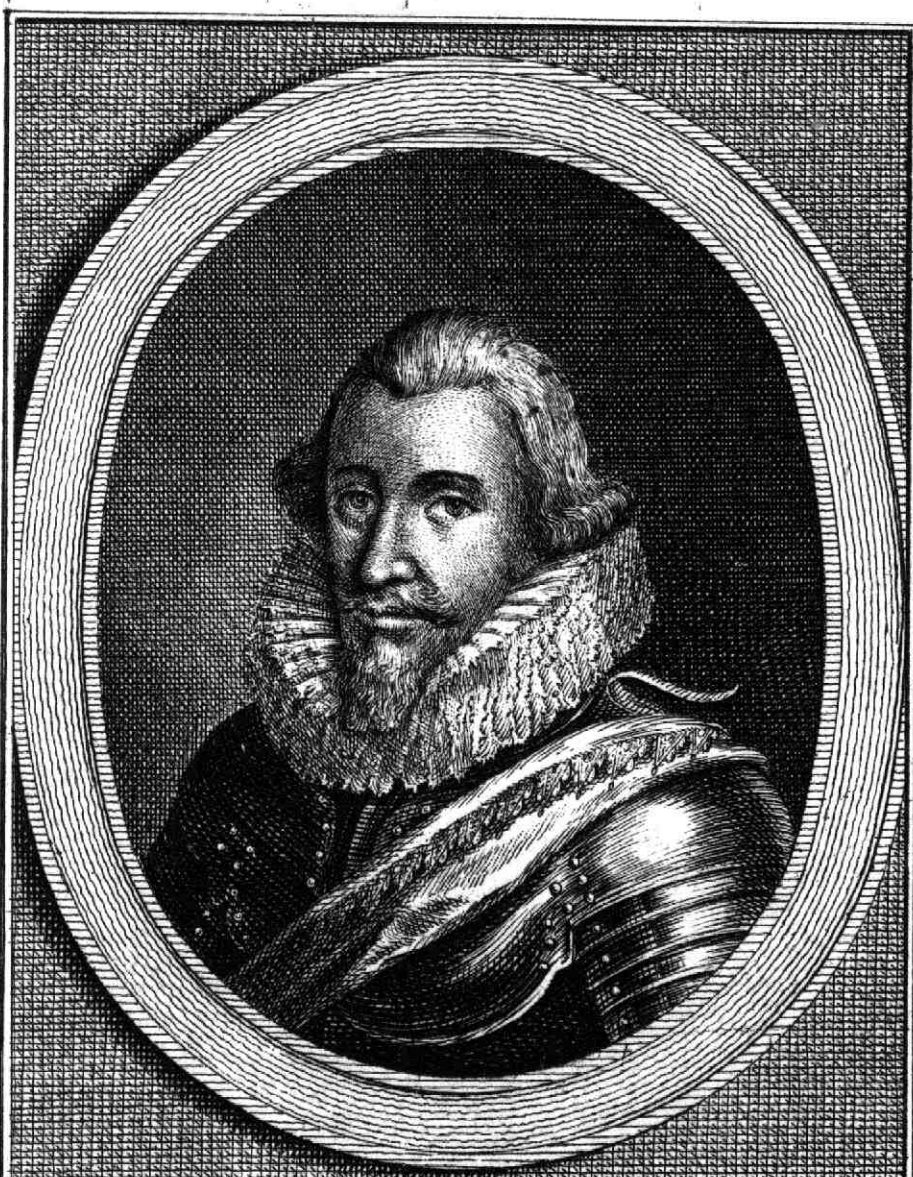
ERNESTUS CASIMIR Princeps von Nassau Carolinobogen, Würtem. Dux.