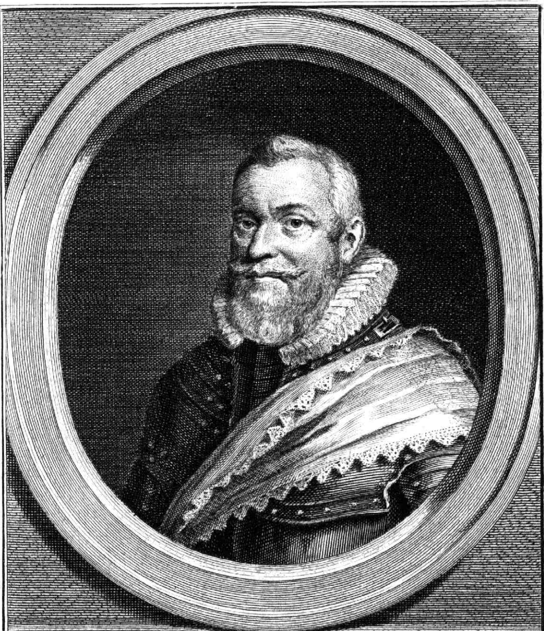
WILLEM LODEWYK, Graaf van Nassau, Stadhouder van Friesland en Groningen.