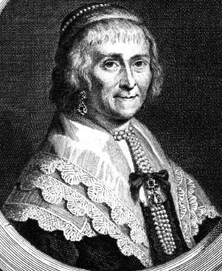
LOUIZE DE COLIGNY, Prinseſſe Weduwe van Oranje.