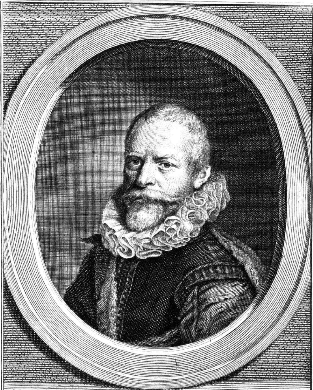
MR. ROMBOUT HOGERBEETS, Pensionaris van Leiden.