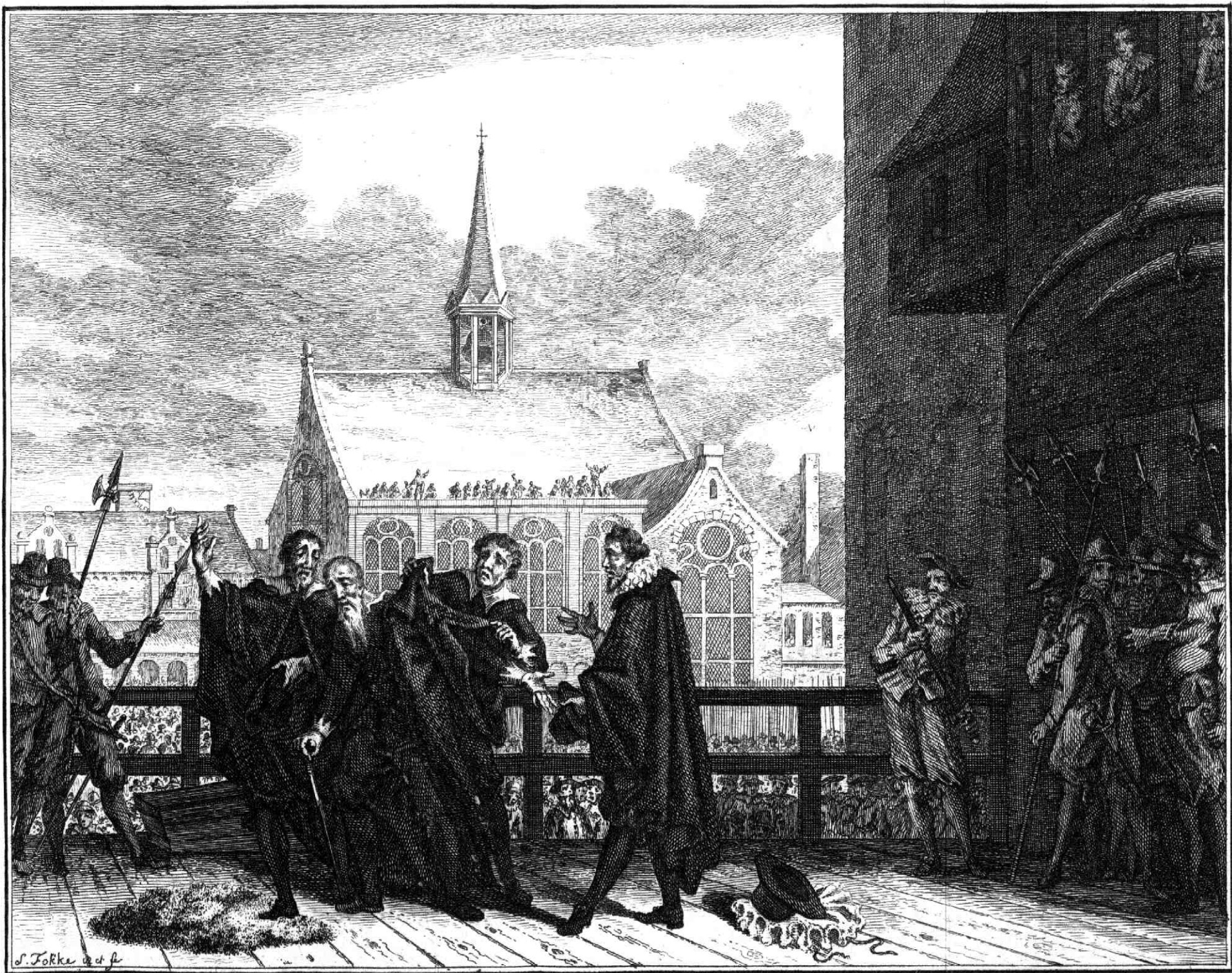
's Lands Advokaat, Joan van Oldenbarnevelt, op't Hofschavot in den Haage, gereed, om onthalt te worden, in't jaar 1619.