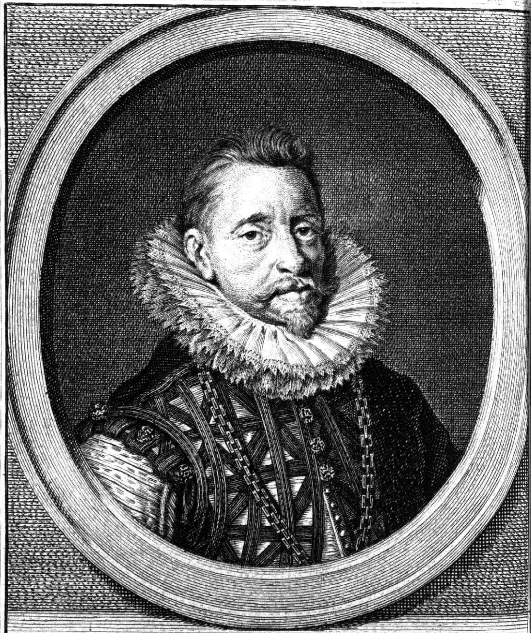
ALBERTUS, Aartshertog van Oostenryk. Gouverneur der Nederlanden.