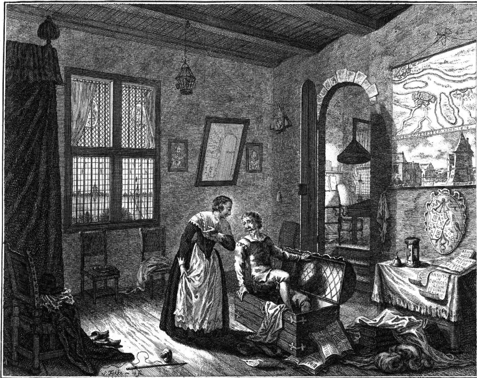
Hugo de Groot zig bereidende tot de vlugt uit de Loeresteinsche gerangenis, in't jaar 1621.