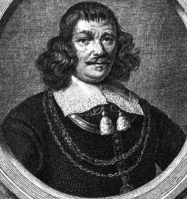
PIETER FLORISZ, Vice-Admiraal van Holland en Westvriesland.