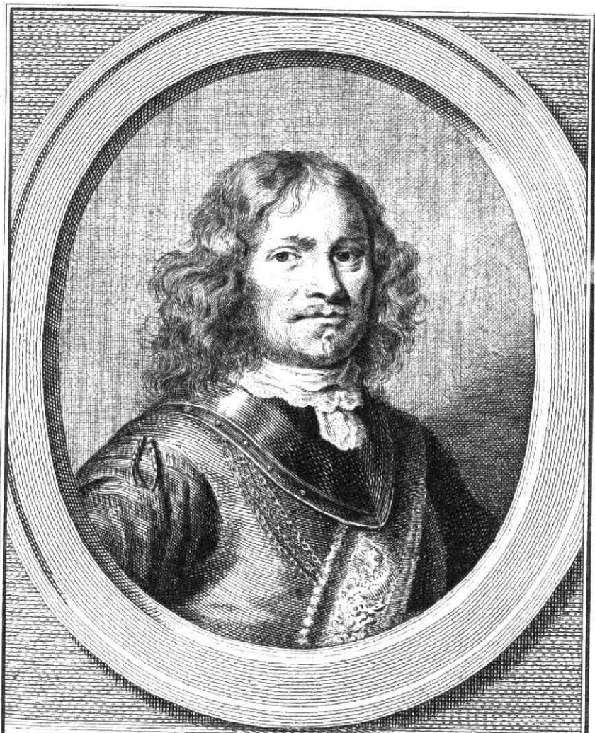
JAN VAN GALEN, Kommandeur ter Zee.