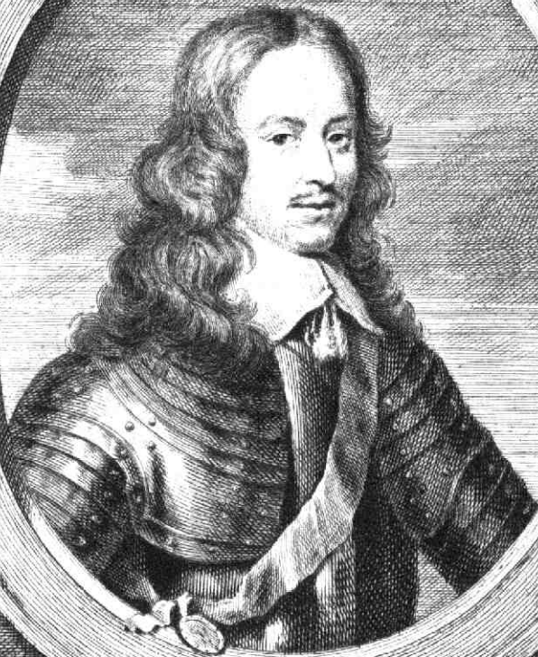
WILLEM DE TWEEDE Prins van Oranje, Stadhouder van Gelderland, Holland, Zeeland, Utrecht, Overijsel en Groningen enz.

A. Schouwen de maet v'ingel van Houtwardt. opt. Sch. in 's. Overijsel.