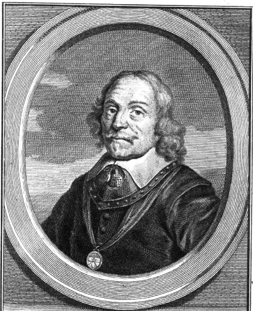
MAARTEN HARPERTSZOON TROMP, Luitenant Admiraal van Holland en Westfriesland.