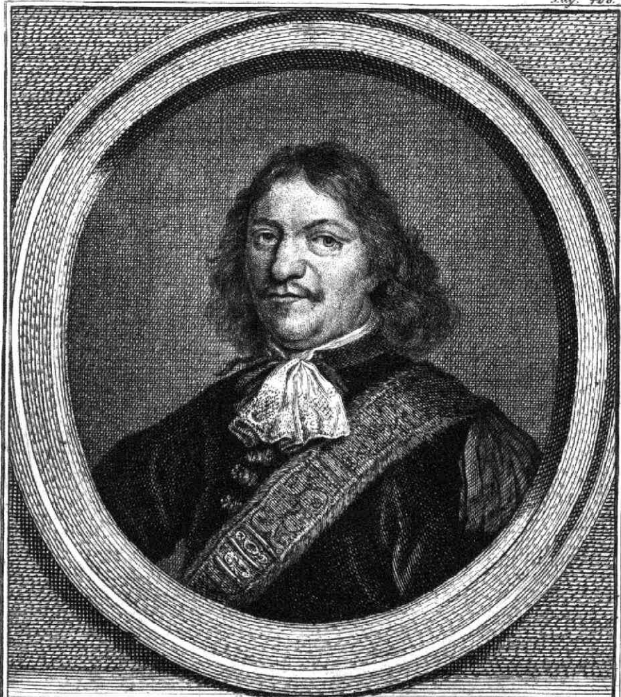
AERD VAN NES, Luitenant-Admiraal van Holland en Westvrieland.