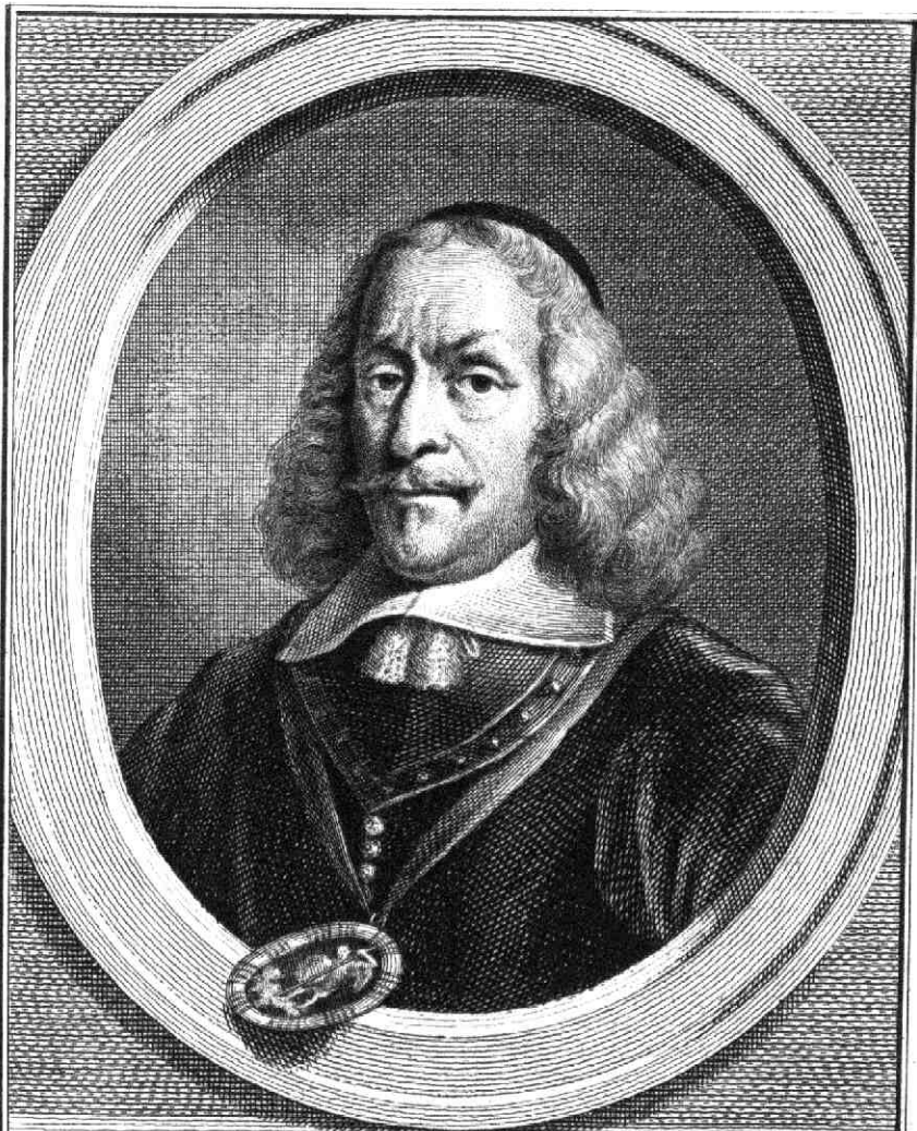
WITTE KORNELISZ DE WITTE Vice Admiraal van Holland en Westfriesland.