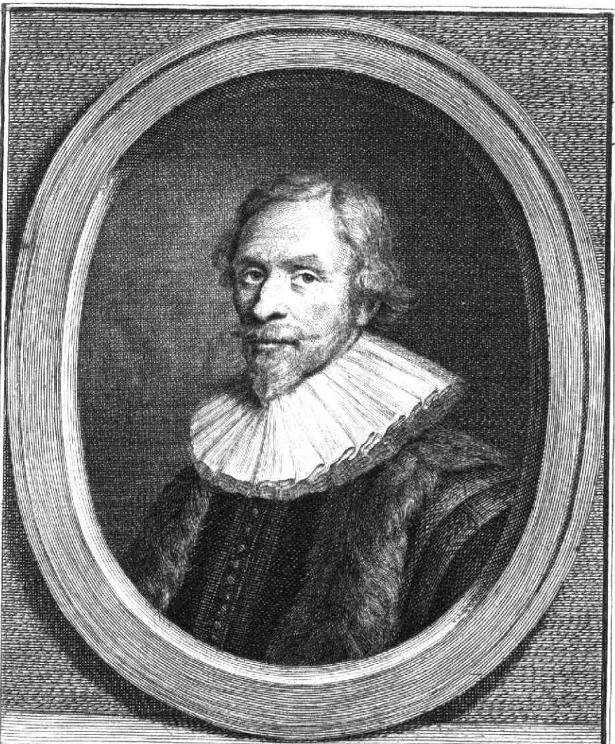
J A C O B C A T S, Raad-Pensionaris van Holland enz.