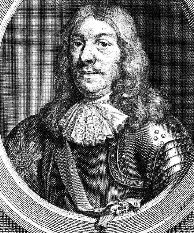
KORNELIS TROMP, GRAAF, RIDDER, BARONET, Luitenant-Admiraal-Generaal van Holland en Westfriesland.