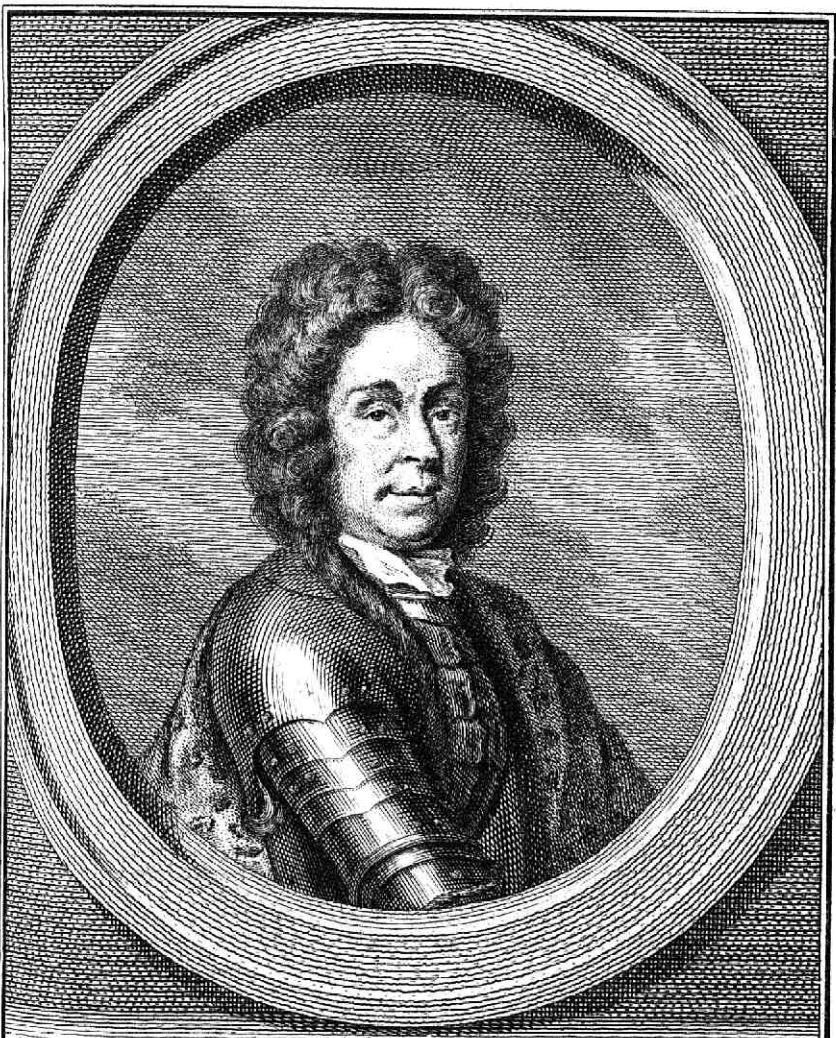
MENNO BARON VAN COEHOORN, Generaal der Artillerie in dienst van de Vereenigde Nederlanden enz.