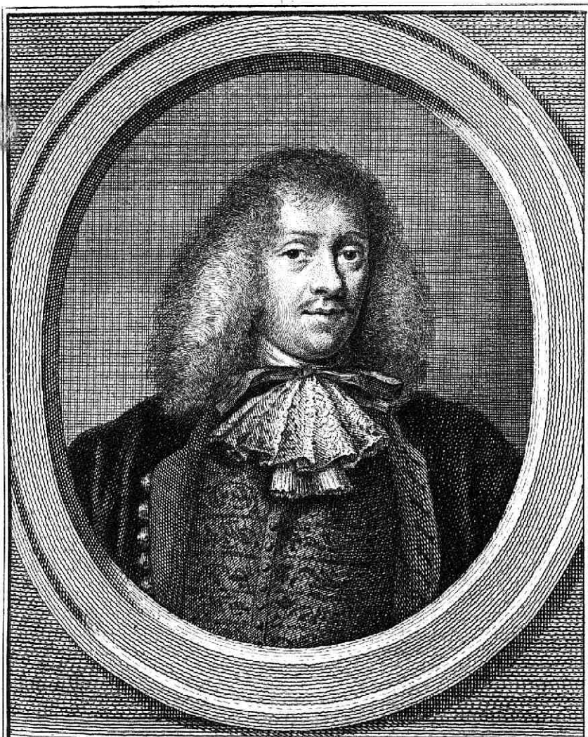
HIERONIMUS VAN BEVERNINGK Thesaurier-Generaal der vereenigde Nederlanden enz.

A. Schramm del. nunc & Original by den. Hier. Comite van Beverningk.