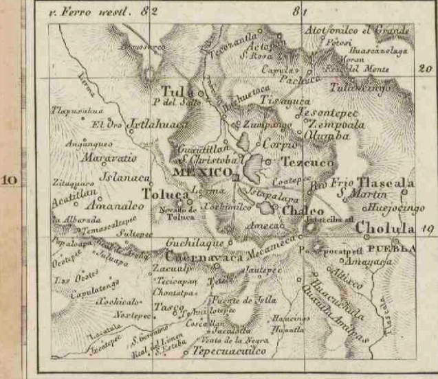
Umgeb. d. Stadt MEXICO in 4 fachen Maasstab.