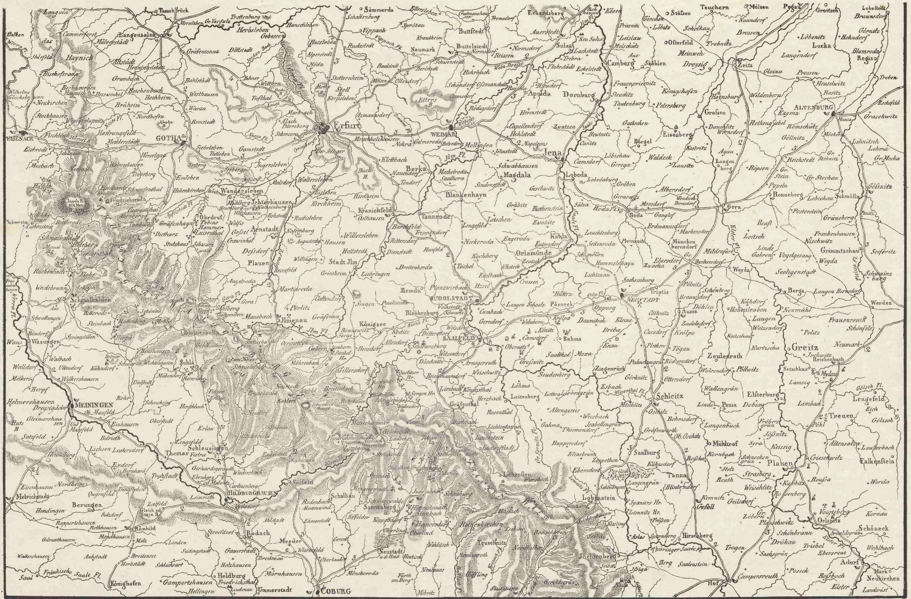
Neuhaldensleben bei A. Eyraud.