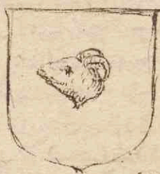
De Rableis Thueninas.