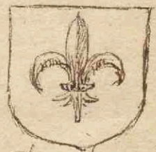
IDEAL DE CASTALIONE

Hunc potuit quondam Lucraeus habere magistrum. Est unius sed plus impetratis habet. Lis tibi Castalis cum Bera sacra probatur se tibi nobiscum lis quoque nulla foret.