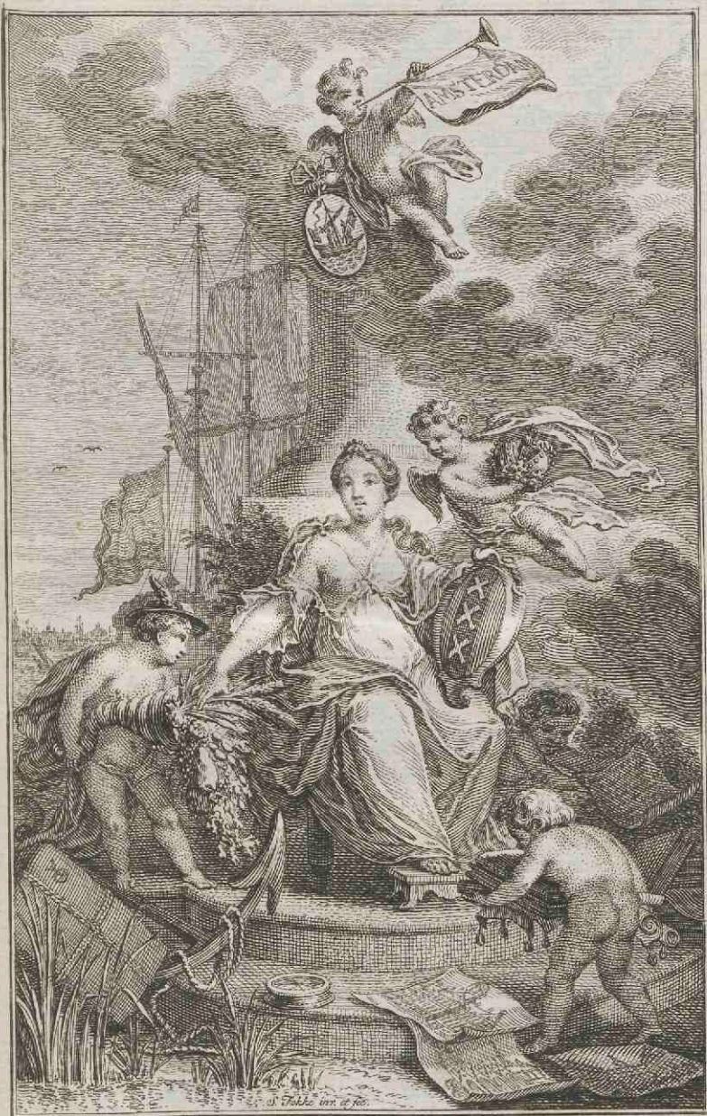
To AMSTERDAM by ISAAC TIRION.