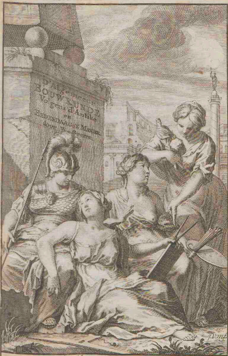
J. AMSTERDAM. by Wilhelmus Goeree, op t Rokin in Cicero. 1681.