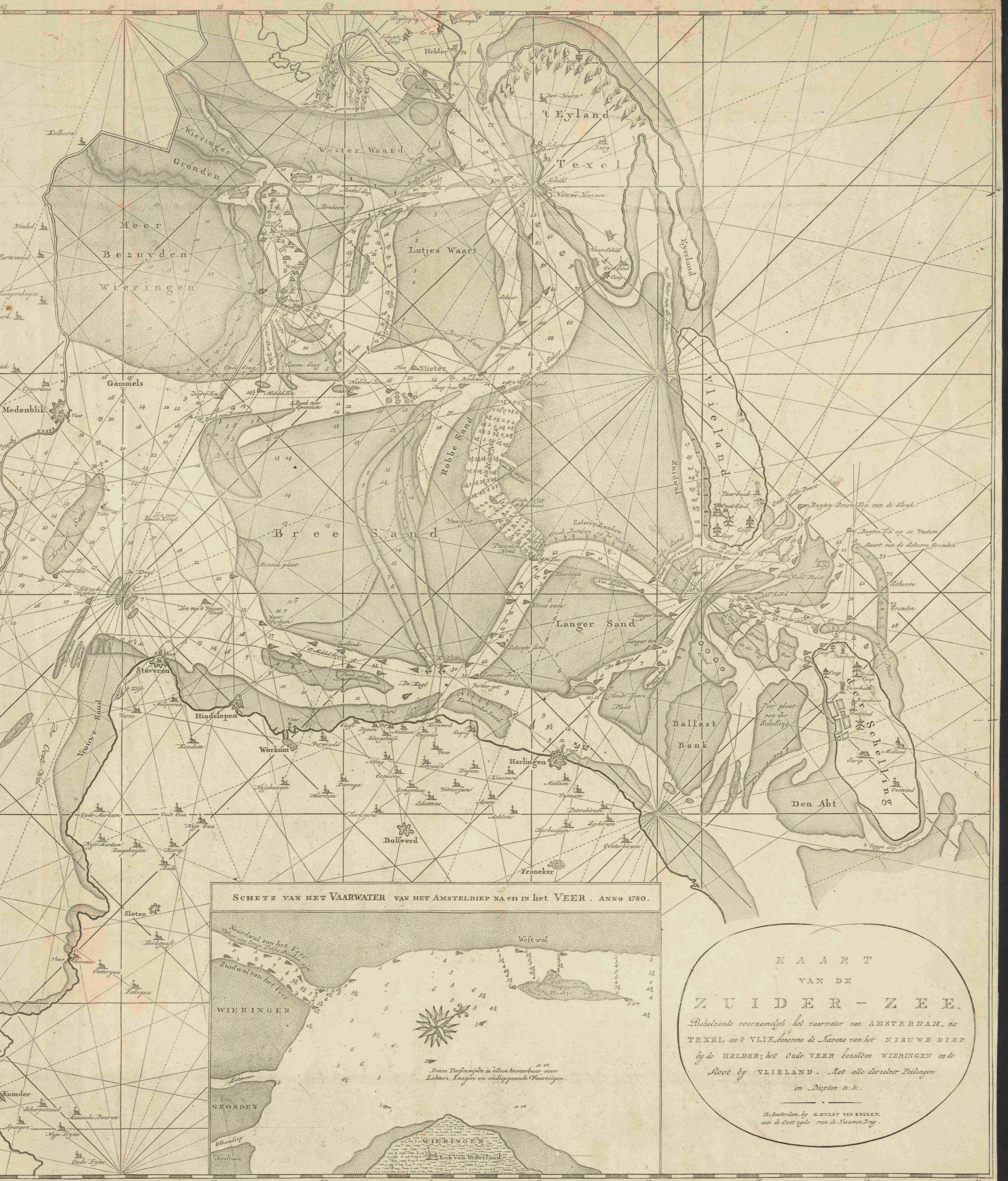
SCHETZ VAN HET VAARWATER VAN HET AMSTELDIEP NACH IN HET VEER. ANNO 1780.

KAART VAN DE ZUIDER-ZEE. Bezelende voornamelyk het vaarwater van AMSTERDAM, na TEXEL en VLIET, benevens de Haven van het NIEUWE DIEP by de HELDER; het Oude VEER bezuden WIERINGEN en de Sloot by VLIELAND. Met alle derzebr Deelingen en Diepten &c. R. Amsterdam, by G. H. VAN KULEN, aan de Oost zyde van de Nieuwen Brug.