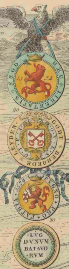
VOORSTELLING VAN HET BELEG EN ONTZET VAN LEIDEN