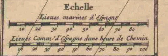
TABULA GEOGRAPHICA PARAGAIÆ, CHILIS, FRETUM MAGELLANICUM &c.

Dans cette Mer Glaciale il y a beaucoup d'animaux qui font moitié Oyseaux et moitié poissons. Ils ont le col comme un Oyseau qu'ils avancent hors de l'eau seulement pour prendre l'air, le reste est toujours sous l'eau