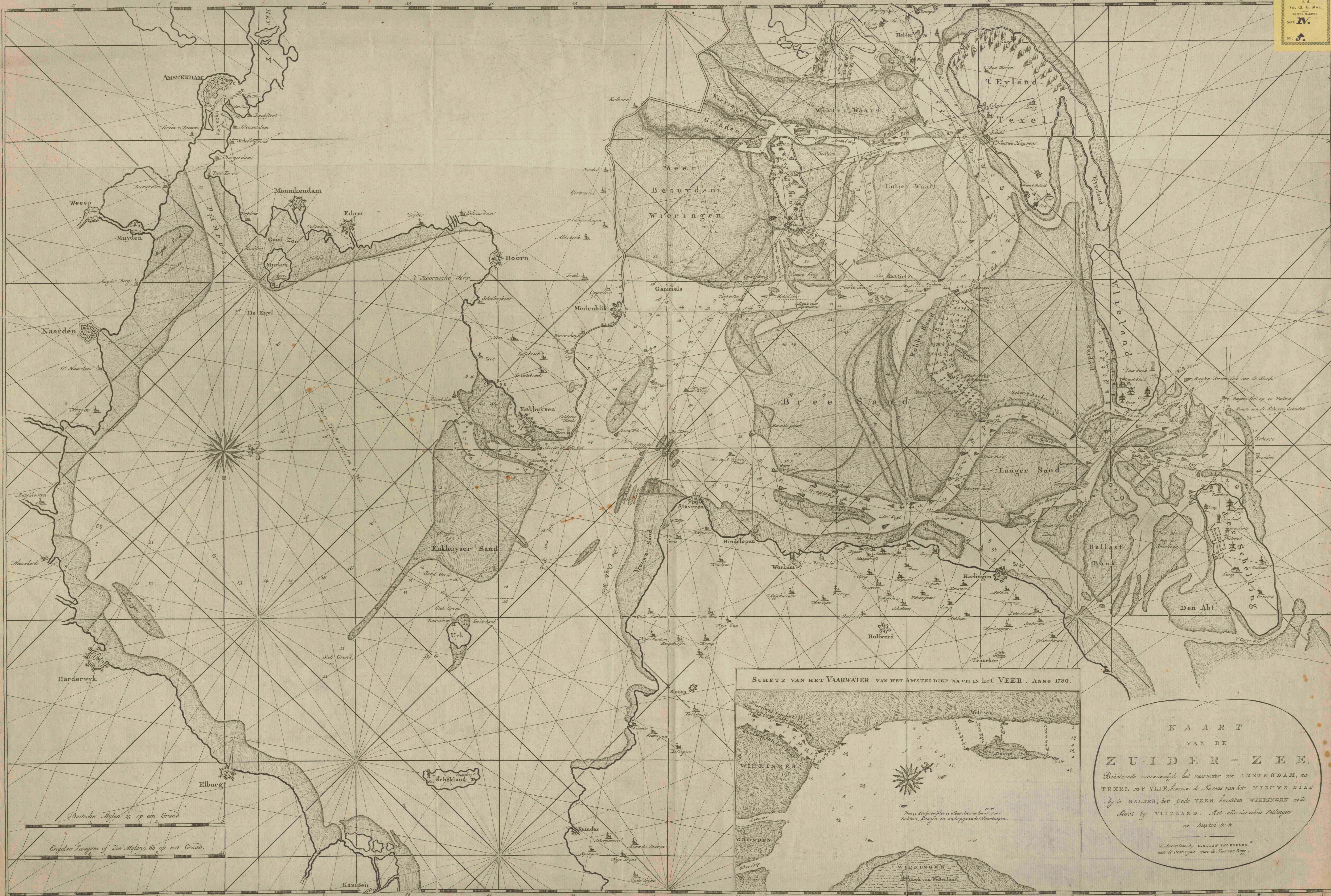
SCHETZ VAN HET VAARWATER VAN HET AMSTELDIEP NA EN IN HET VEER. ANNO 1780.