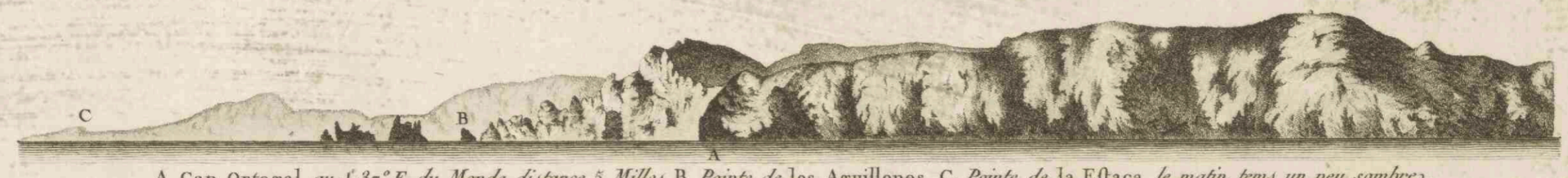
A. Cap Ortegal, au S. 37° E. du Monde, distance 5 Milles. B. Pointe de los Aguillonos. C. Pointe de la Estaca, le matin, tems un peu sombre.

CÔTES D'ESPAGNE ASTURIES et PARTIE DE GALICE. d'après les Plans levés en 1788. Par Don Vicente Tofiño Officier de la Marine d'Espagne PUBLIÉ PAR ORDRE DU MINISTRE DE LA MARINE Pour le Service des Vaisseaux de la République Française. au Dépôt des Cartes Plans et Journaux de la Marine. en 1793. L'An 2 e de la République Française.