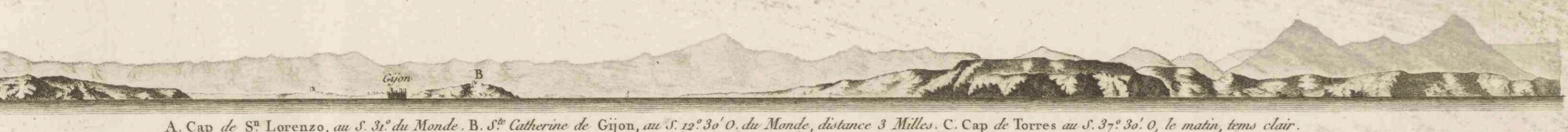
A. Cap de S te Lorenzo, au S. 31° du Monde. B. S te Catherine de Gijon, au S. 12° 30' O. du Monde, distance 3 Milles. C. Cap de Torres au S. 37° 30' O. le matin, tems clair.