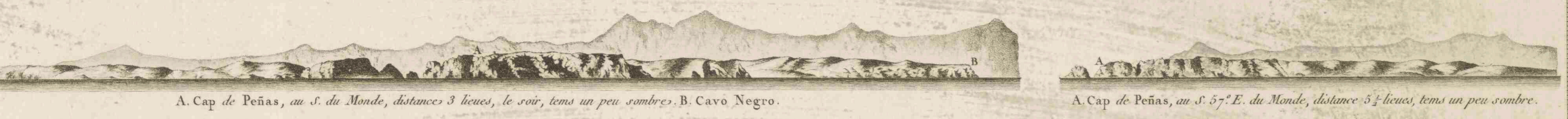
A. Cap de Peñas, au S. du Monde, distance 3 lieues, le soir, tems un peu sombre. B. Cavo Negro. A. Cap de Peñas, au S. 57° E. du Monde, distance 5 1/2 lieues, tems un peu sombre.

30' 30' 40' 50' 9° 20' 20' 30' 40' 50' 10° 20' Longitude à l'Ouest du Méridien de Paris.