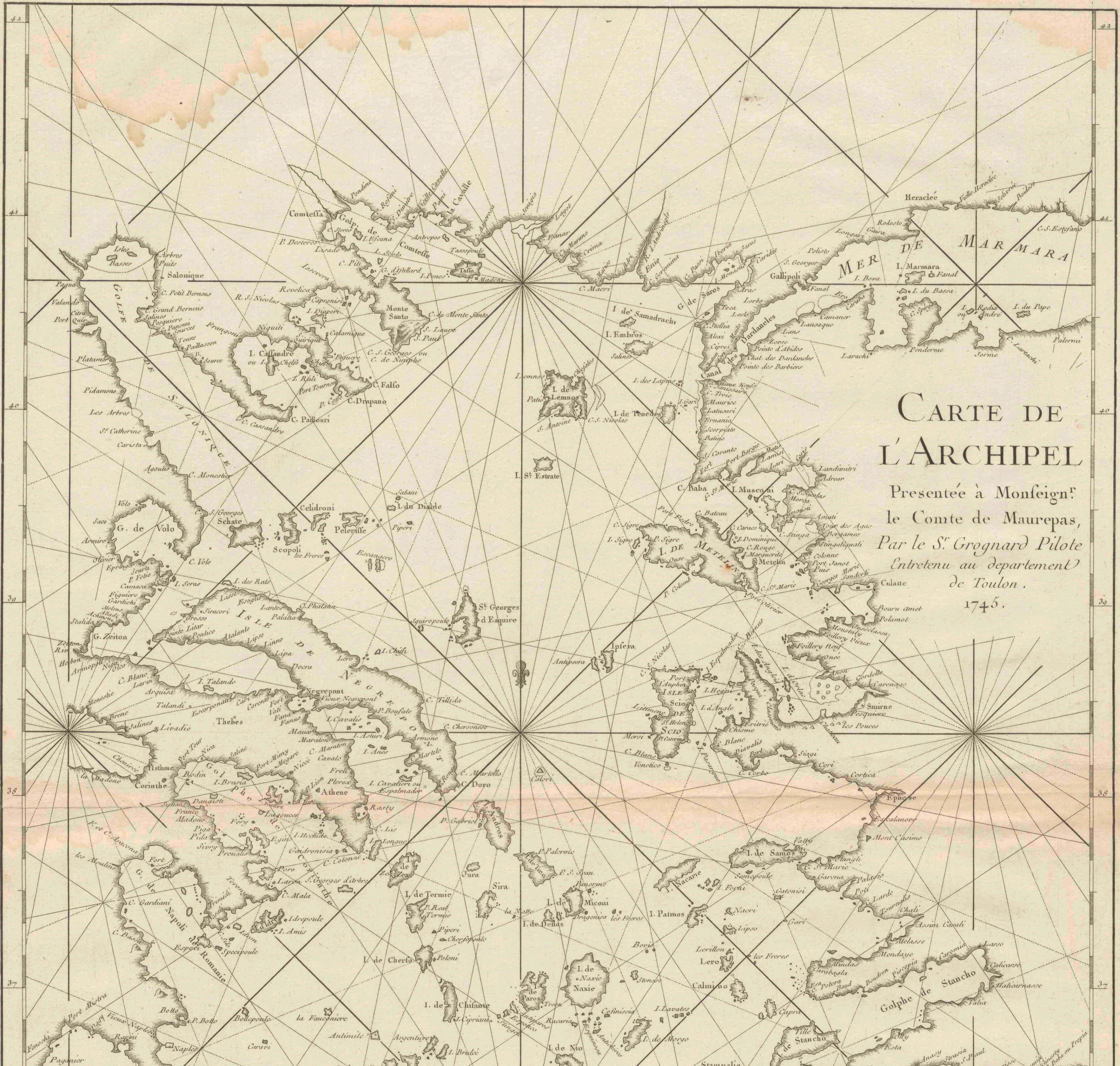
CARTE DE L'ARCHIPEL Presentée à Monseign r le Comte de Maurepas, Par le S r Grognard Pilote Entretenu au département de Toulon. 1745.