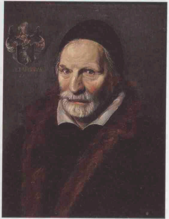
Jacobus Zaffius (1611) door Frans Hals

Haarlemse Noon gaf Zaffius al zijn eerste dimissoriaalbrieven 57 uit, iets wat eigenlijk volgens het Concilie van Trente in het eerste jaar van sedisvacatie nog niet kon. 58 Vanaf die tijd ging Zaffius nog zelfstandiger optreden, en noemt hij bij zijn benoemingen niet meer het Kapittel als gemachtigde instantie. Vanaf dat moment baseerde hij zijn zelfstandige optreden op zijn functie van aartsdiaken en de omschrijving daarvan zoals die in de Statuten van 1573 was opgetekend. Zelf was hij van mening dat de uitoefening van zijn functie nu weliswaar verschilde van die in het verleden, maar dat dit simpelweg kwam omdat de bisschop niet meer aanwezig was en de omstandigheden hem daarom