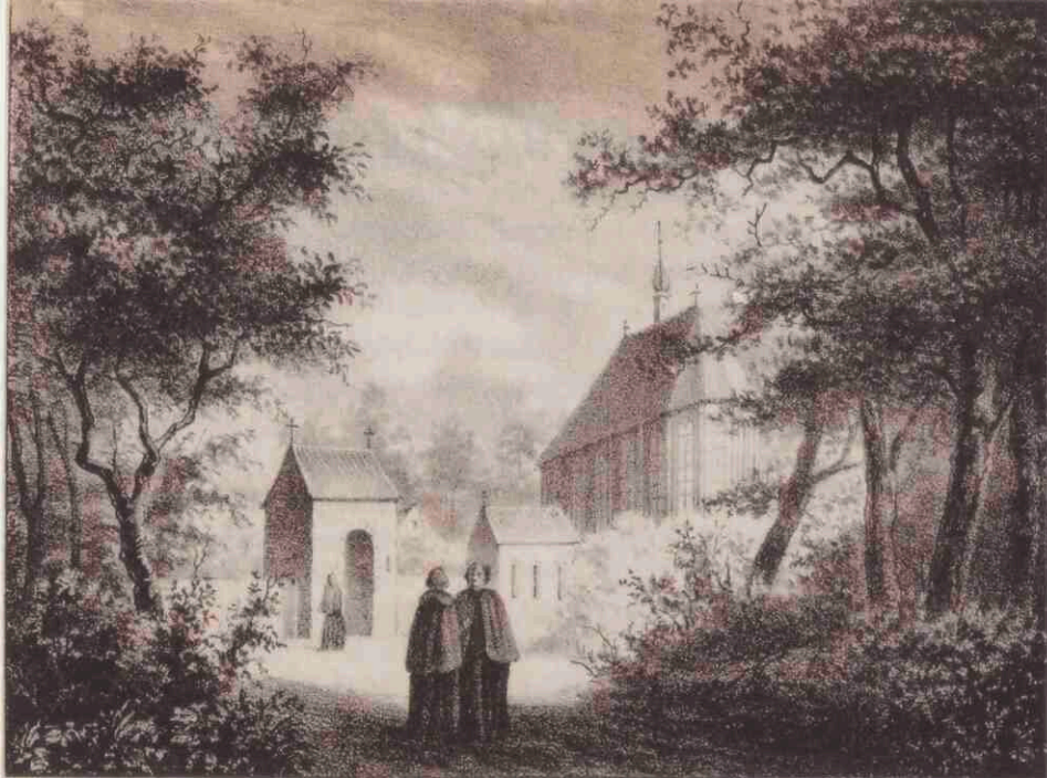
'Het Reguliers Klooster De Blinken, in de Varnebroek onder Heijloo'

Jan III, eerste graaf van Egmond (1438-1516), er ooit hebben overnacht. De inkomsten vanuit Heiloo en Geervliet waren van belang om de prebenden van de kanunniken te kunnen betalen. Uit Heiloo kwamen meer inkomsten dan uit Geervliet, wat in het net gevormde kapittel vrijwel direct tot spanningen zou leiden.