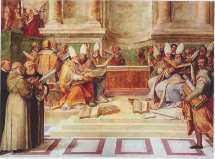
Het Concilie van Trente

voorstel bekrachtigt – hij kan er ook nog voor kiezen om dat niet te doen – is de keuze van een bisschop een feit.