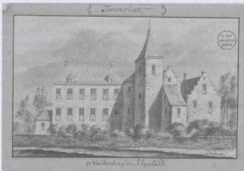
Torenvliet, tekening door Abraham Rademaker, tussen 1706 en 1735. Universiteitsbibliotheek Leiden, COLLBN Port 312-I N 22.