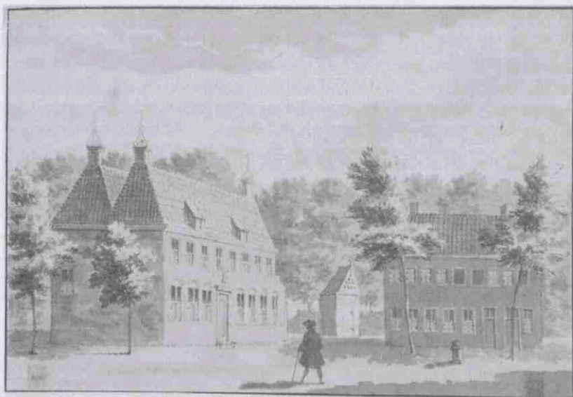
Rijnwijk, tekening door Louis-Philippe Serrurier, 1731. cat.nr. 201835