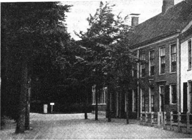
De situatie der voormalige Portugeesche Synagoge van Maarssen naast den tuin van het kasteel „Ter Meer”.

(Naar een photographie uit de 19de eeuw).