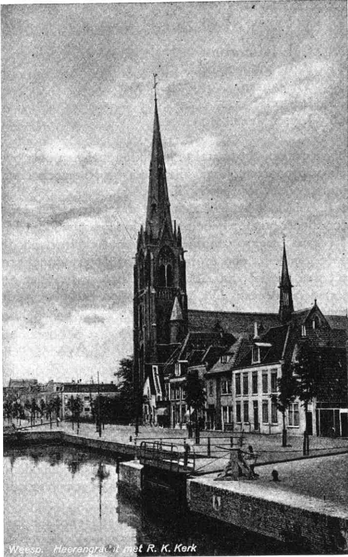
Weesp. Heerengraafte met R. K. Kerk