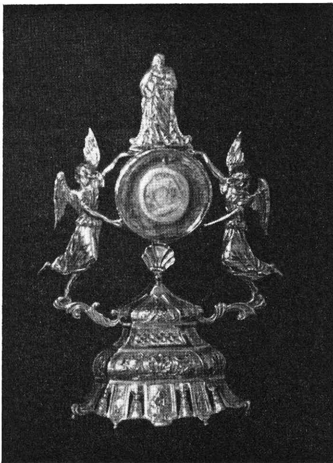
Zilveren Reliekhouders van A. v. D. te Maarsse

recht. Uit alles blijkt dat er behalve in de musea ook in de kerken van Utrecht, Vechtstreek en Amsterdam iets bewaard wordt aan zilver drijfwerk voor kerkgebruik, dat de Bogaerts hebben geleverd. Er was geen gelegenheid om het avondmaalszilver in Vecht- en Geinstreek in dit opstel te verwerken. Waarschijnlijk zal zich daaronder ook nog wel werk van Utrechtse meesters bevinden.