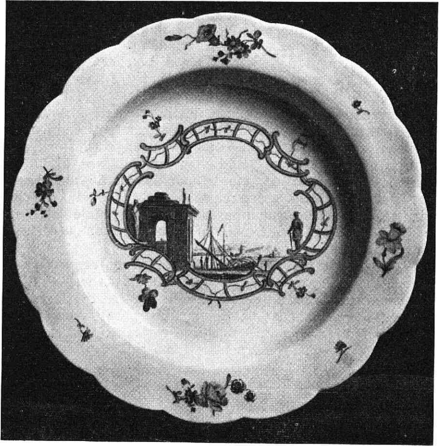
Bord van Weesper porcelein (Voorzijde),