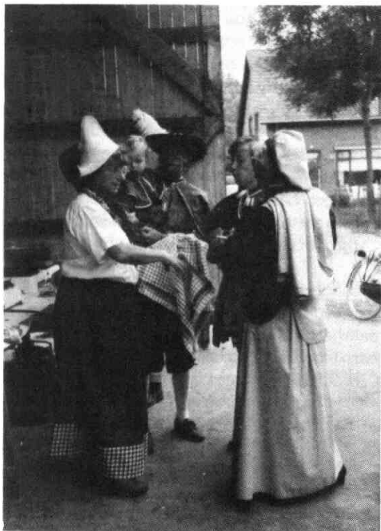
Afb: Schalkwijkers in middeleeuwse kledij.

Daarna ging de feestweek steeds meer mensen bezig houden. Overal draaiden de naaimachines om middeleeuwse kledij te maken. Er werd