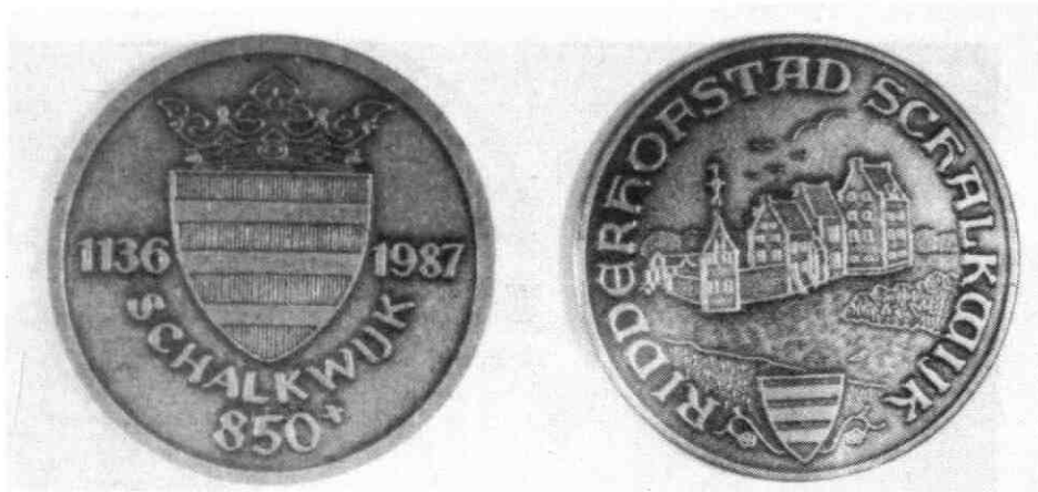
Afb: De Schalkwijkse Florijn. Een ontwerp van Moesman.

toe was gekomen. In de loop van de generaties werkte men in de slappe periodes steeds een stuk naar achteren toe. In de loop van de 14de of 15de eeuw was pas heel Schalkwijk ontgonnen.