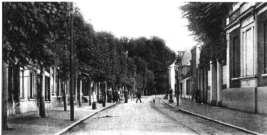
De 2e Dorpsstraat met één van de laatste openbare pompen. Foto uit circa 1900.