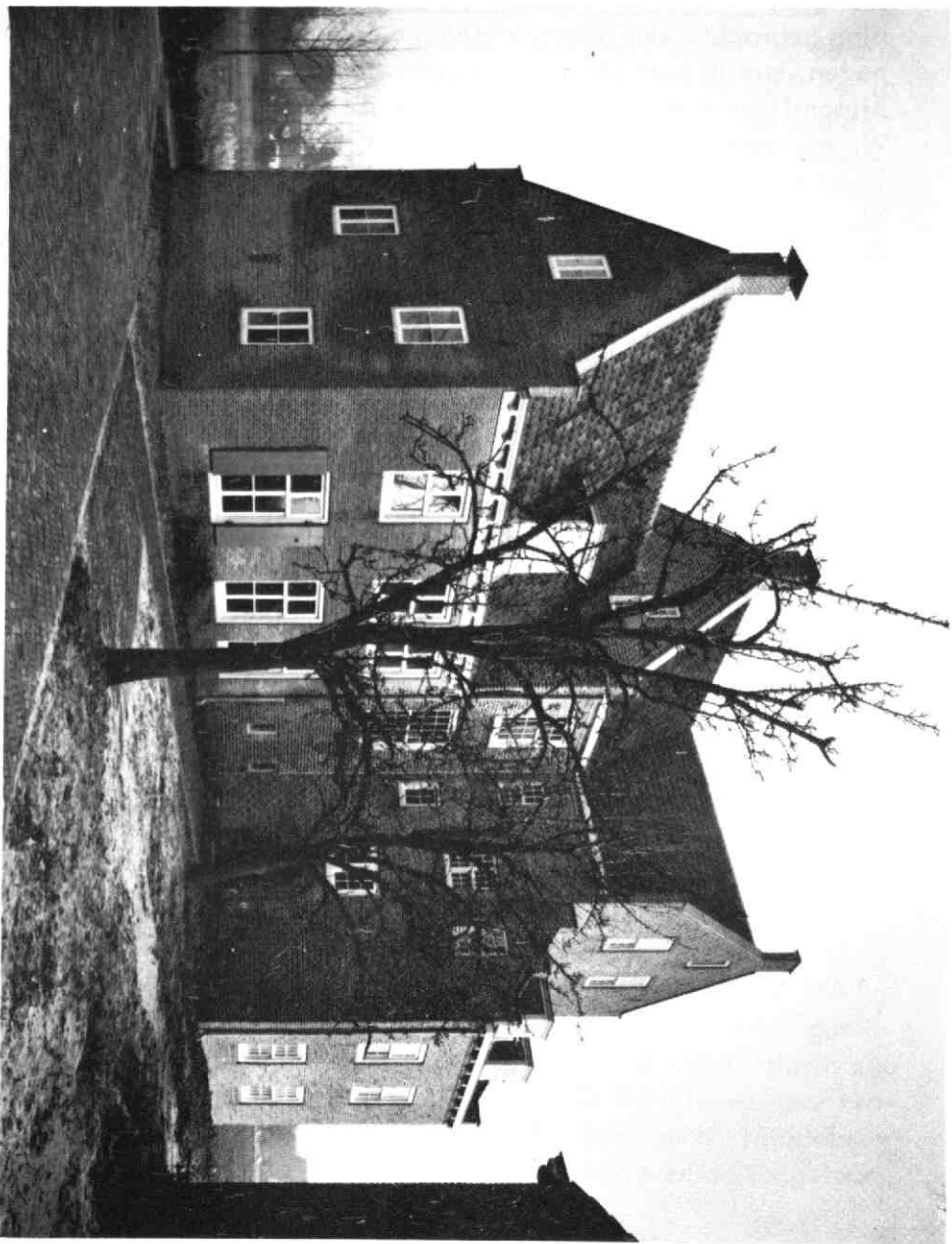
(Cammingha) na de restauratie