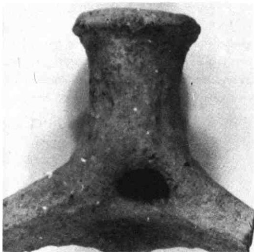
Steelevatting van een bakpan