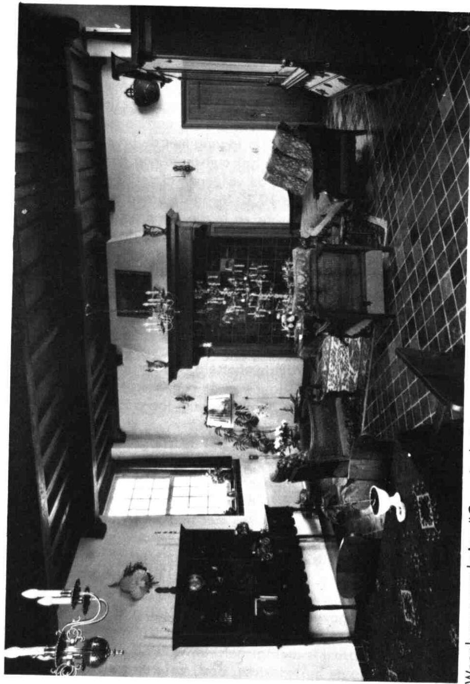
Woonkamer van huize "Cammingha"