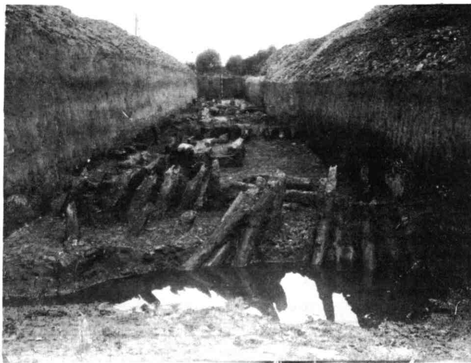
Paalwerk van een in 1932 ontdekte aanlegsteiger te Vechten, daterend uit de eerste jaren van onze jaartelling.

Tenslotte werd ten oosten van het huidige fort de plaats teruggevonden van het kampdorp. Dergelijke nederzettingen bevonden zich in de directe nabijheid van elke romeinse legerplaats. Ze boden huisvesting aan de vaste troepen en vervulden een belangrijke functie in de dienstverlenende en vooral de recreatieve sector.