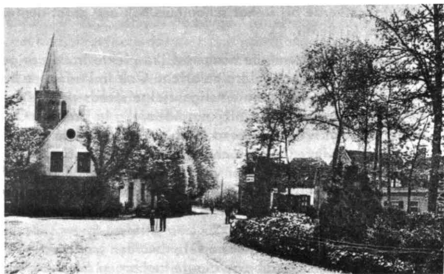
Houten - Brink - rond de eeuwwisseling tegenwoordig