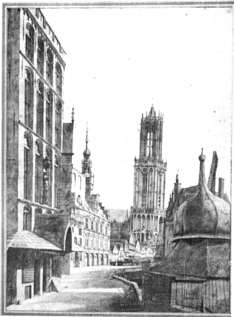
Stadhuisbrug met de stadskraan