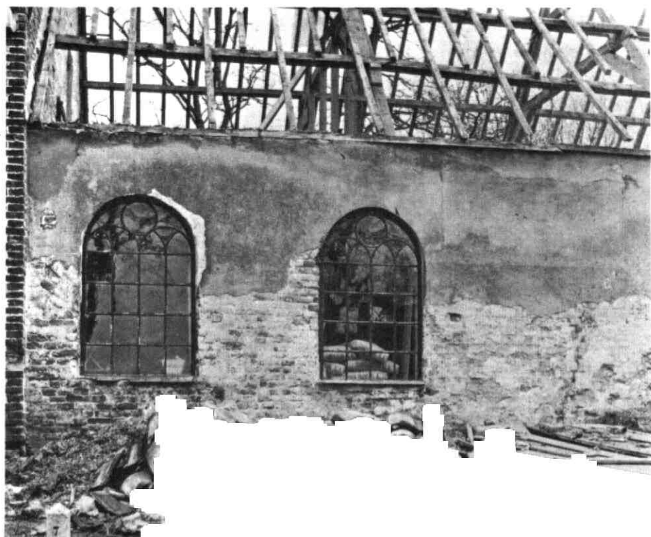
Het koor van de Hervormde kerk van Schalkwijk tijdens de restauratie.