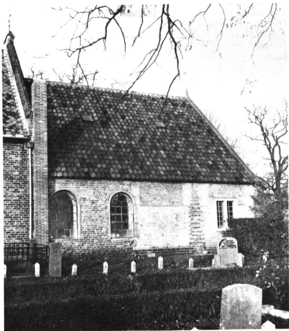
Het koor van de Hervormde kerk van Schalkwijk na de restauratie.